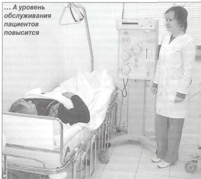
... А уровень обслуживания пациентов повысится

- Основная цель национального проекта - развитие первичной медицинской помощи, к которой относятся ФАПы, сельские участковые больницы, скорая помощь, санавиация и вся участковая служба во всех поликлиниках страны. Еще одно направление проекта - профилактическое, то есть дополнительные медицинские осмотры, прививочная работа, а также улучшение снабжения материальными ресурсами, которое предусматривает обеспечение санитарным транспортом и медицинским оборудованием сельских больниц. По этому проекту в каждой сельской больнице должны быть маммографы, рентген и флюороаппараты, ультразвуковое оборудование, лабораторная техника. Это должно обеспечить весь объем мероприятий, предусмотренных проектом. В этот объем входит дополнительная диспансеризация (осмотр узкими специалистами), лабораторные исследования, маммография (снимки молочной железы), флюорография. Дополнительным медицинским осмотрам подлежат работники бюджетных организаций от 35 до 55 лет и граждане, занятые на вредном производстве - в наших северных усло-