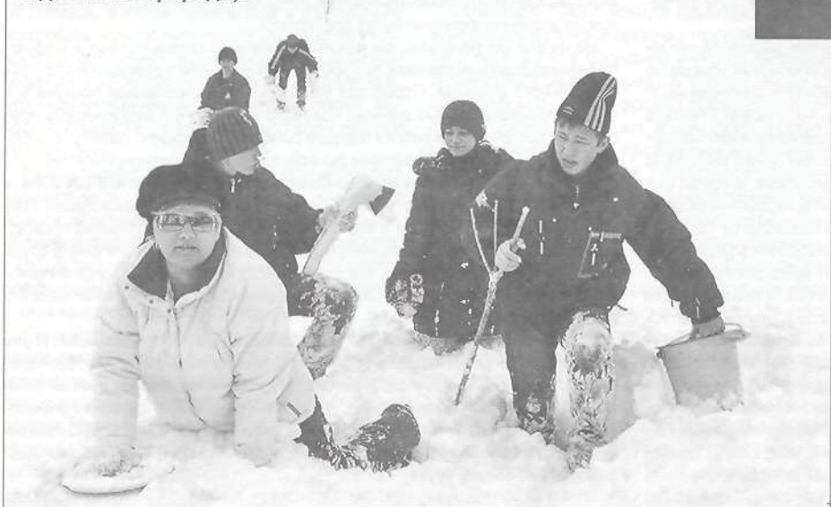
отдыхать на природе,...

тами, шоколадками и просили по традиции рассказать стихотворения взамен. Трудно передать словами, как реагировали тарко-салинцы: дети радовались встрече со сказочными персонажами, взрослые, вначале немного опешив, тоже подключались к происходившему действию. Можно с уверенностью сказать, что горожане - и большие, и маленькие - очень доброжелательно встретили гостей: стихи рассказывали, песни пели, загадки отгадывали и даже в гости приглашали.