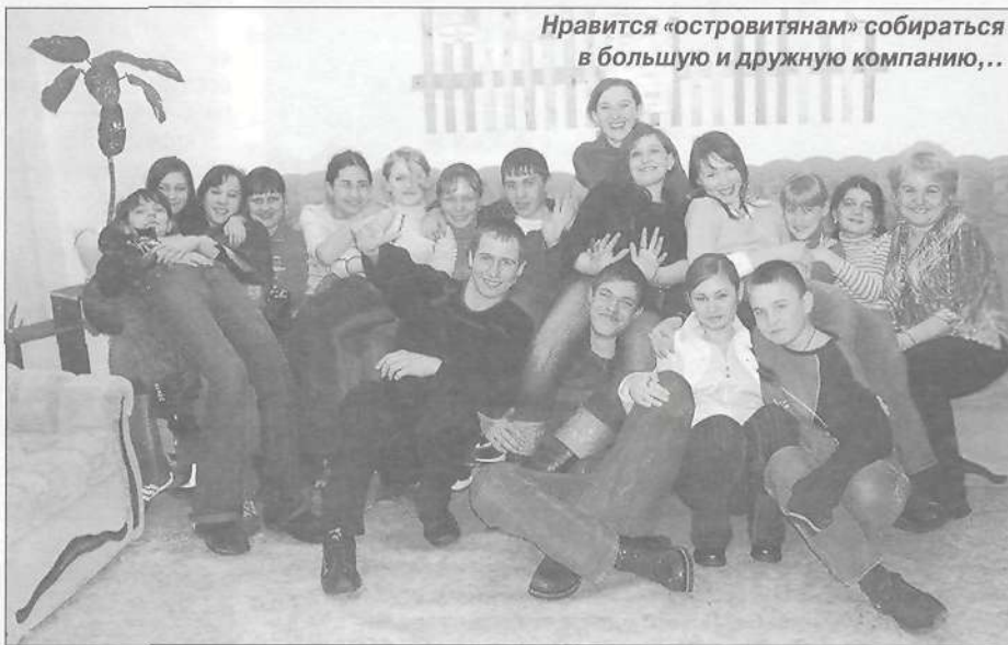
Нравится «островитянам» собираться в большую и дружную компанию...

Работает масса клубов по интересам - это и волонтеры - родоначальники «Островка», добровольцы и борцы за здоровый образ жизни. Это и творчески активная молодежь - любители театральных постановок и КВНа. Это «Самоделкины» и «Вожатые» - названия говорят сами за себя, и еще несколько клубов. И главная фишка во всем этом многообразии - это свобода. Ребят никто ни к чему не принуждает. Хотят рисовать - рисуют, хотят выжигать - выжигают, а захотят самостоятельно провести мероприятие - да пожалуйста! Так, собственными силами «островитяне» организовали и провели Хэллоуин. Декорации, костюмы, сценарий - все сделали сами, да к тому же втайне от старших. И получилось все здорово! Понрави-