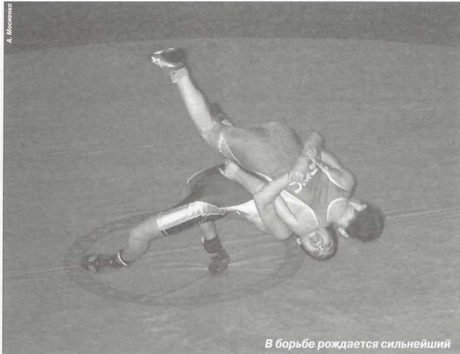
В борьбе рождается сильнейший