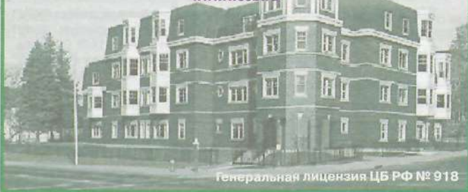
Генеральная лицензия ЦБ РФ № 918

Также вся необходимая информация расположена на сайте: www.wscb.ru