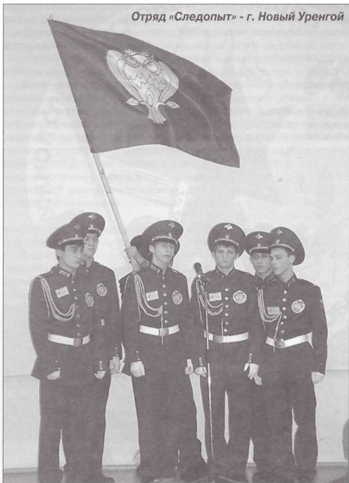
Отряд «Следопыт» - г. Новый Уренгой