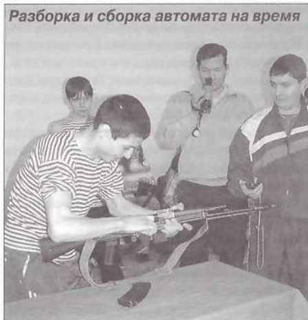
Разборка и сборка автомата на время

В ходе слета состоялись презентация отрядов, где они выступили со своими «визитками», конкурс инсценированной военно-патриотической песни, спортивное многоборье. Ребята показали на что способны: шагать строем, разбирать и собирать автомат (лучшее время 33 секунды), работать с миноискателем. Выступления всех