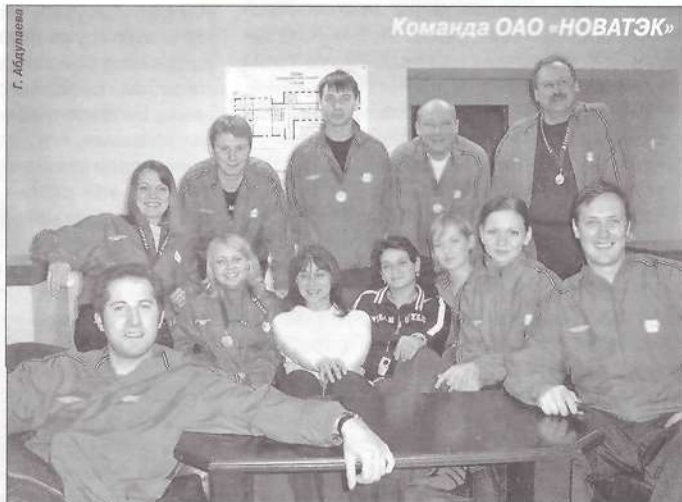
Команда ОАО «НОВАТЭК»