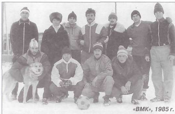
«ВМК», 1985 г.