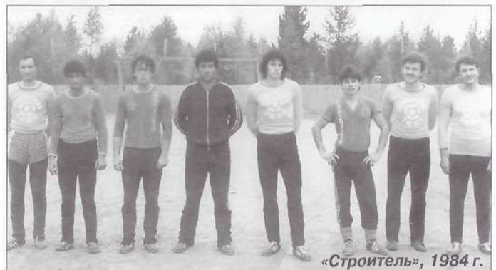
«Строитель», 1984 г.