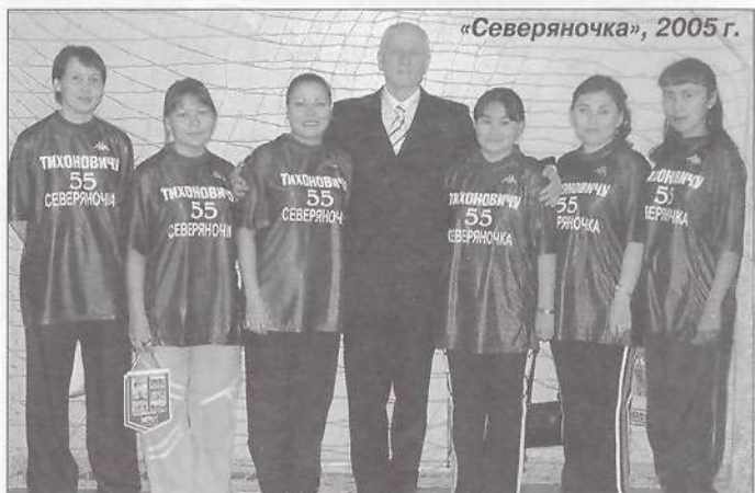
«Северяночка», 2005 г.