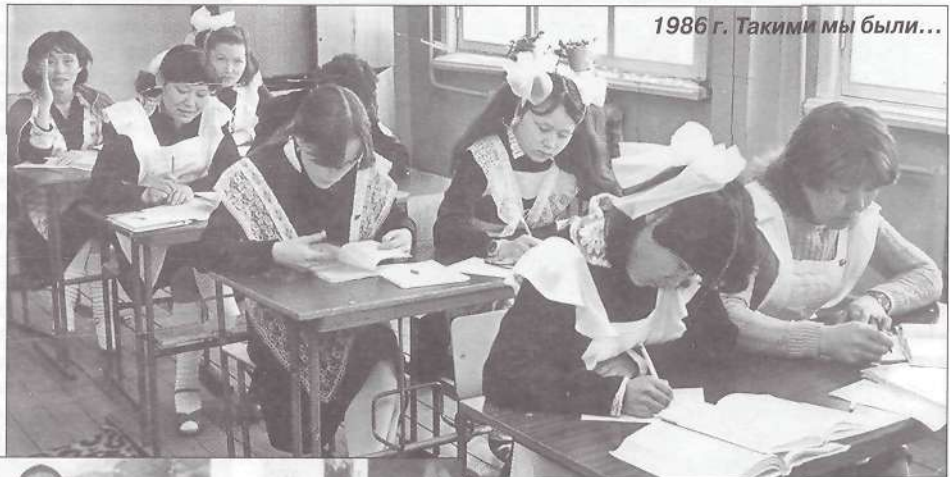
1986 г. Таковыми мы были...