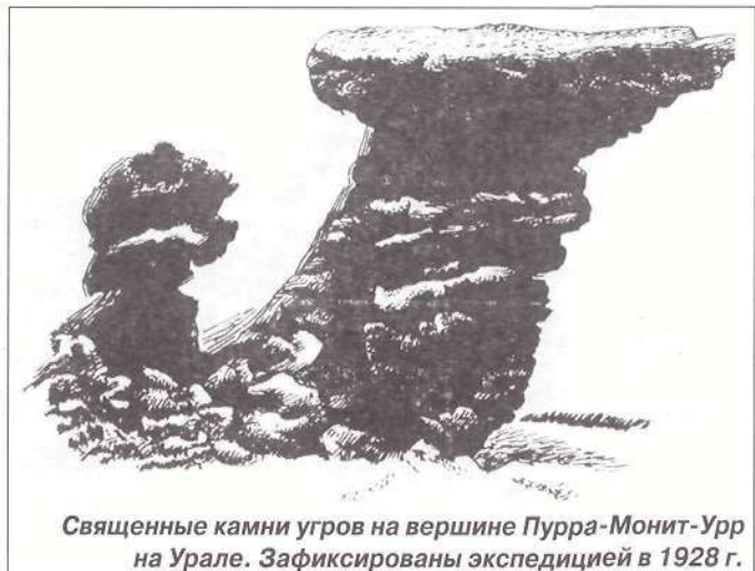
Священные камни угров на вершине Пурра-Монит-Урр на Урале. Зафиксированы экспедицией в 1928 г.

С этим же камнем связана еще одна история-быличка. Поехали люди на лодках за продуктами. Обычно, проезжая мимо священного камня, они всегда останавливались и молились. А в тот раз один мужчина не стал молиться и говорит другим: «Что это вы молитесь, это же камень!» Затем взял топорик и постучал по спине камня, доказывая тем самым, что это обыкновенный камень и ни-