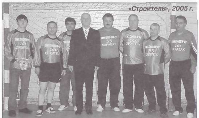
«Строитель», 2005 г.