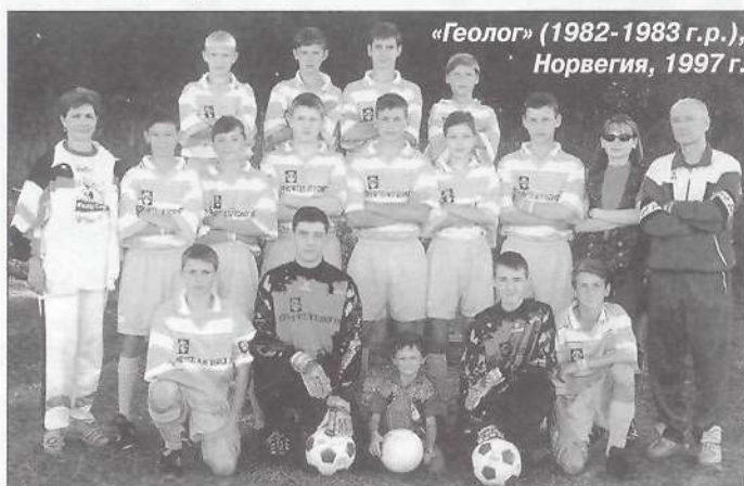
«Геолог» (1982-1983 г.р.), Норвегия, 1997 г.