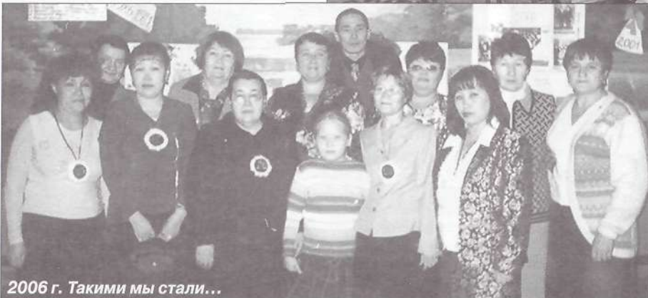
2006 г. Таковыми мы стали...

Как известно, стирается из памяти многое, а вот мимолетные вроде бы и незначительные улыбка, слово утешения, похвала, полученные в детстве, следуют за нами всю жизнь.