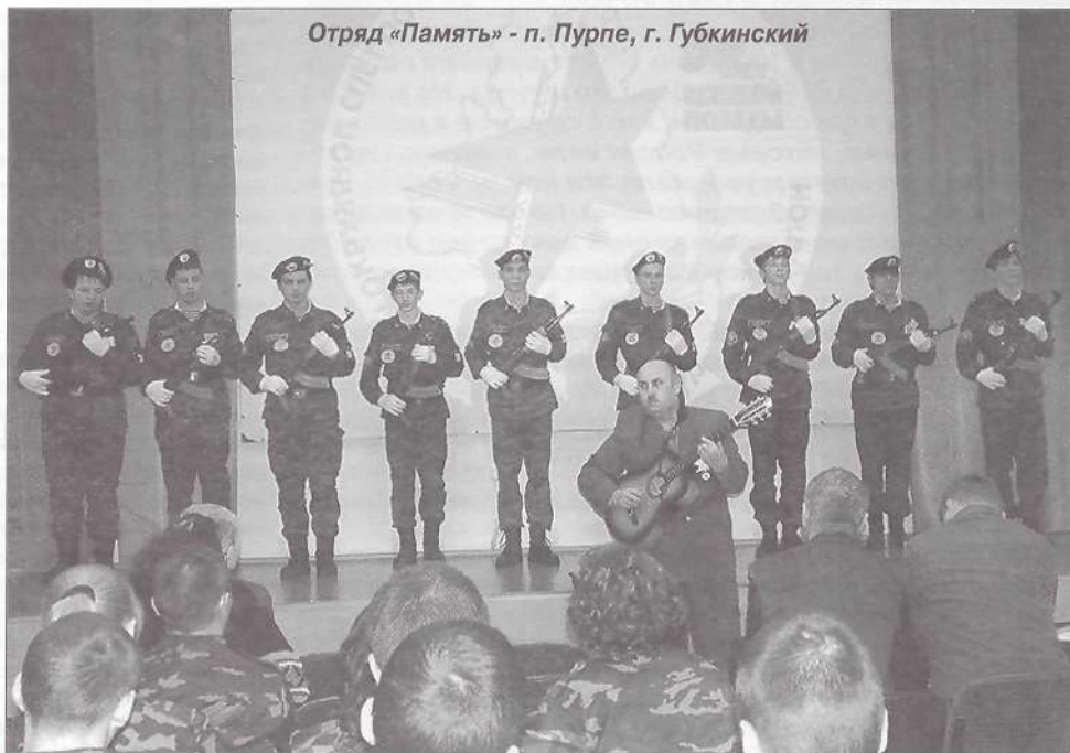
Отряд «Память» - п. Пурпе, г. Губкинский