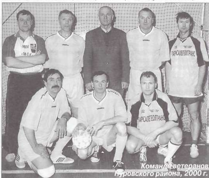
Команда ветеранов Пуровского района, 2000 г.