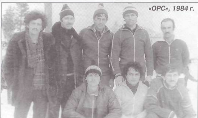
«ОРСа», 1984 г.