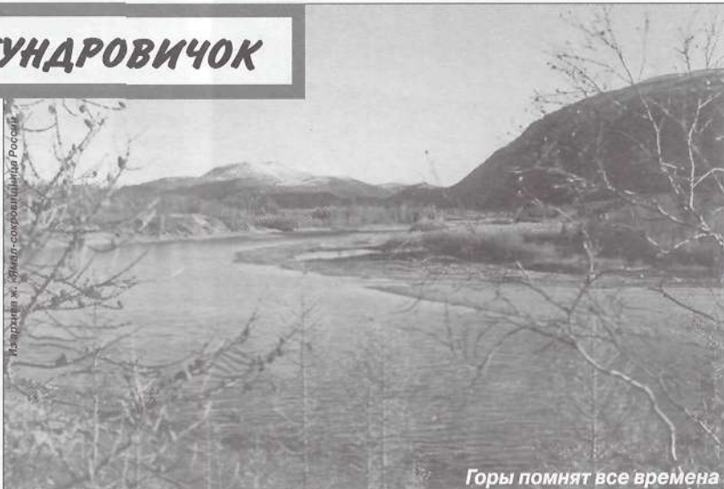
Горы помнят все времена

(Из материалов полевых экспедиций автора, 1992 г.)