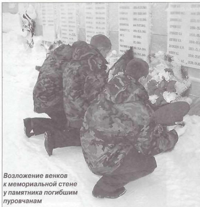
Возложение венков к мемориальной стене у памятника погибшим пуровчанам

В ходе слета состоялись презентация отрядов, где они выступили со своими «визитками», конкурс инсценированной военно-патриотической песни, спортивное многоборье. Ребята показали на что способны: шагать строем, разбирать и собирать автомат (лучшее время 33 секунды), работать с миноискателем. Выступления всех