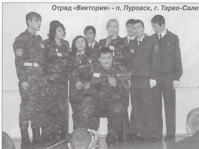
Отряд «Виктория» - п. Пуровск, г. Тарко-Сале

Торжественное открытие слета началось с песни