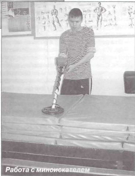
Работа с миноискателем

ника погибшим пуровчанам, где возложили венки к мемориальной стене. У Вечного огня была высыпана земля, привезенная с мест боев в Ленинградской области, где, как установили поисковики, погибли бойцы, призванные Ямальским окрвоенкоматом. Об этом свидетельствуют материалы архивов, с которыми работают ребята, вернувшись из экспедиций. Затем состоялось