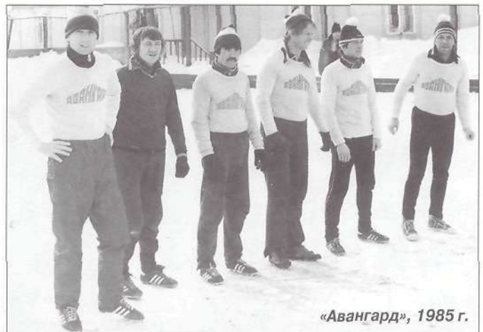
«Авангард», 1985 г.