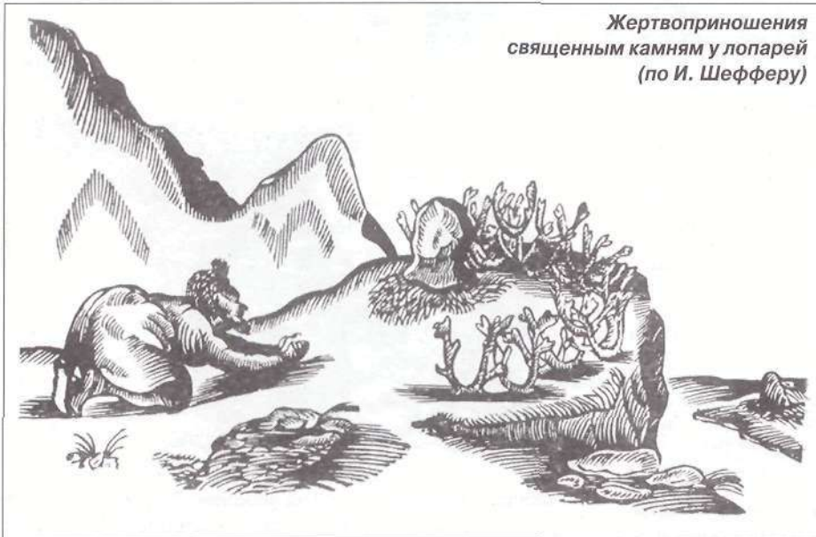
Жертвоприношения священным камням у лопарей (по И. Шефферу)

В горных массивах Ловозерской тундры («тундры» по-саамски означает «горы»), у священного Сейдозера, есть гора Нинчурт. Много каменных загадок таит она, много великих тайн хранит. Неоднократно и в разные годы предпринимались попытки разгадать эти тайны, но все безуспешно. А некоторые экспедиционные отряды, придя в эти места, попросту терялись, других же находили уже околелыми. Может, они и были близки к разгадке, но история хранит молчание. Приверженцы же эзотерических учений склонны искать в здешних местах Северную Шамбалу, на это, очевидно, у них