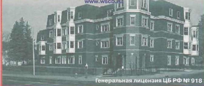
Генеральная лицензия ЦБ РФ № 918

Также вся необходимая информация расположена на сайте: www.wscb.ru