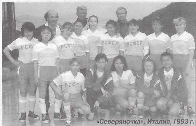
«Северяночка», Италия, 1993 г.