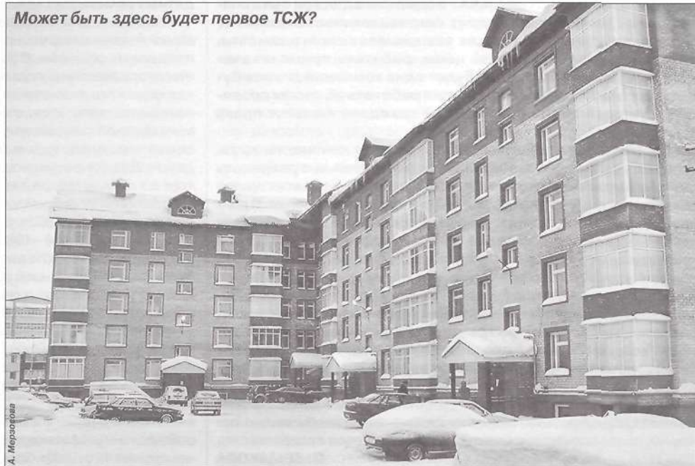
Может быть здесь будет первое ТСЖ?

- Решение не будет принято. Выбор собственниками жилья формы управления является правомочным в том случае, если за данное решение проголосовало более 50 процентов участников собрания.