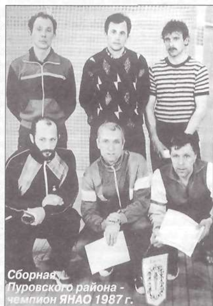
Сборная Пуровского района - чемпион ЯНАО 1987 г.