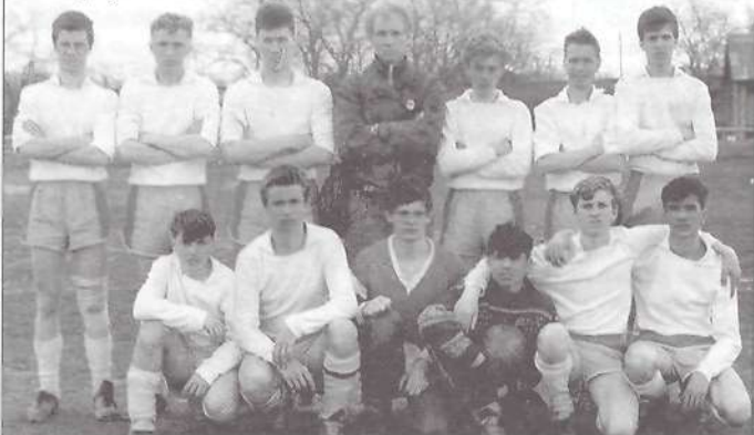
«Интер», 1992 г.

В 1990 году команда «Геолог» (ребята 1979-1981 годов рождения) на Всесоюзном турнире в г. Пятигорске обыграла команду ЦСКА г. Москвы и стала победителем турнира. В 1991 году команда «Интер» приняла участие во Всесоюзном турнире памяти заслуженного мастера спорта