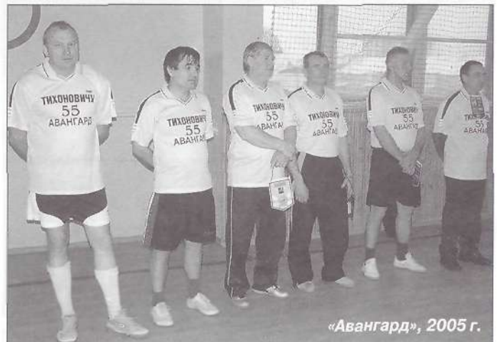
«Авангард», 2005 г.