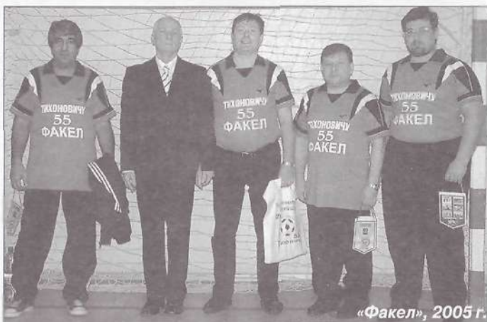
«Факел», 2005 г.