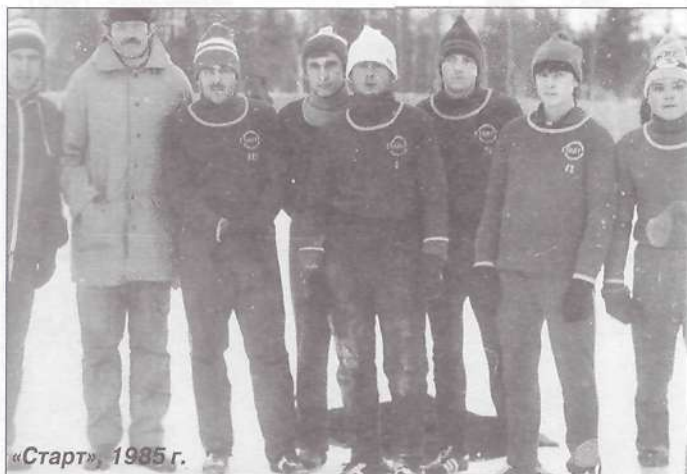
«Старт», 1985 г.