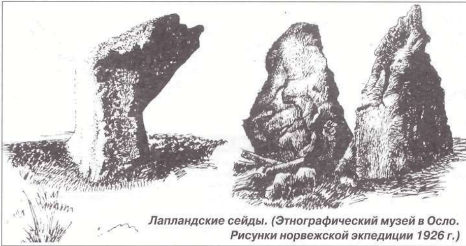
Лапландские сейды. (Этнографический музей в Осло. Рисунки норвежской экспедиции 1926 г.)

имеются свои соображения. Здесь, у склонов горы Нинчурт, обнаружен древнейший мегалитический комплекс: странные (вполне вероятно – культовые) постройки из камня с поваленными колоннами и множеством «разбросанных» в округе сейдов. На некоторых валунах отчетливо проступают «процарапанные» чьей-то сильной рукой знаки: трезубцы, стрелы, косые кресты, свастика, солярные круги, изображения странных существ. А рунические письмена, выгравиро-