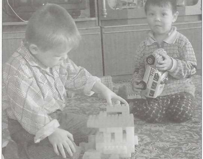
Любимая игра мальчишек - «машинки»

Пересказать все достопримечательности и достоинства приюта практически невозможно. А вот что кажется очень интересным и необычным - так это живой уголок, где маленькие курочки несут яйца,