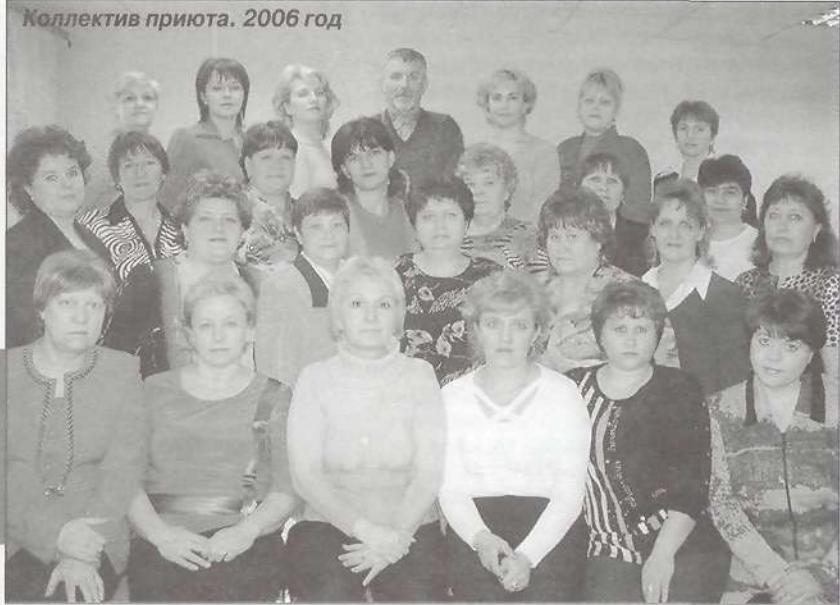
Коллектив приюта. 2006 год

Замечательного, о чем хотелось бы рассказать, в приюте много, но большинство ребят к этому всему - кружкам, забавам, приятному времяпрепровождению - приходит постепенно. Они, познавшие мир с изнанки со всеми ужасами, бедами, побоями и бранью, сначала с опаской и недоверием относятся к новому окружению. И только забота, внимание и доброта сотрудников приюта растапливают оледеневшие детские сердечки. А их тут