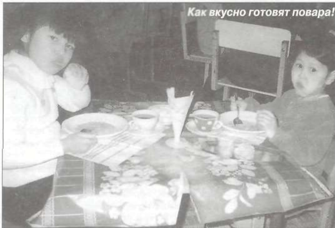
Как вкусно готовят повара!

таких вот детей, - ребенок из неблагополучной семьи. Его родители - алкоголики, дебоширы, безработные. От них пребывают в ужасе все - и даже родной сын. Он в свои пять лет просто сбежал из семейного «рая». Сбежал в никуда, в неизвестность.