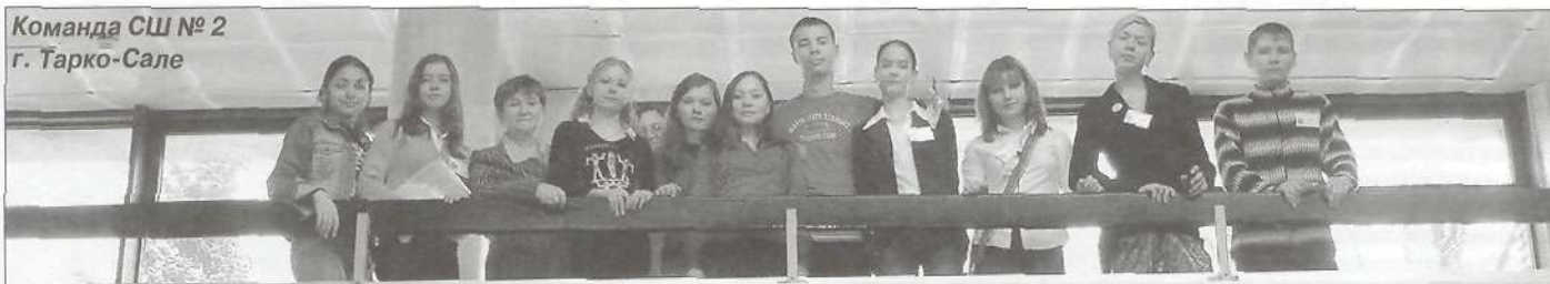
Команда СШ № 2 г. Тарко-Сале