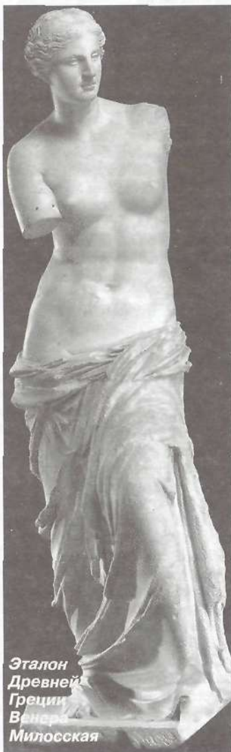
Эталон Древней Греции. Венера Милосская

На Руси красавиц растили по своему. В средние века девочкам из богатых семей запрещали шить, чтобы они не привыкли держать голову опущенной и не кололи пальцы, читать, чтобы не портили глаза, много есть – чтобы не толстели. На ночь в волосы втирали благовонные мази, руки мазали нутриевым салом и надевали нитяные перчатки, а грудь массировали специальной помадой. Будили их рано, чтобы утреннее солнце окрасило лица живым румянцем. Но и русские красавицы не могли устоять перед модой: белились и румя-