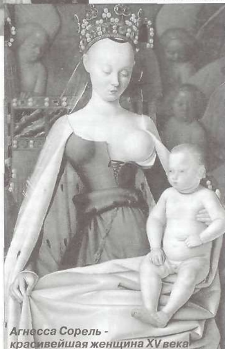
Агнесса Сорель – красивейшая женщина XV века