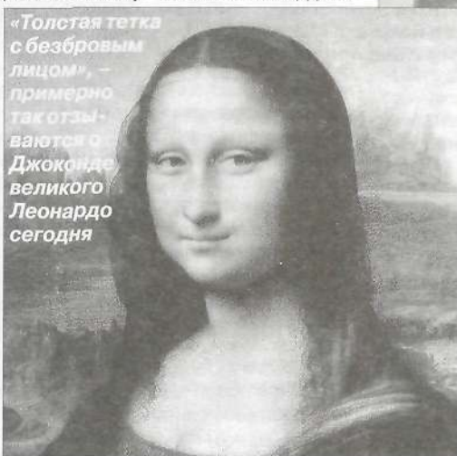
«Толстая тетка с безбровым лицом», – примерно так отзываются о Джоконде великого Леонардо сегодня

ред поездкой в США страшно нервничала. Она вдруг испугалась конкуренции американских красоток, которых знала по кинофильмам. «Что я там буду делать со своим заштатным фэйсом?» – сокрушалась она. Однако вернувшись, полдня рассказывала о своем успехе у ковбоев. «Кстати, красоток я ни разу не увидела!» – подытожила совершенно преобразившаяся женщина. О том же поведала соседка, вернувшись с болгарского курорта. Там, как известно, отдыхают в основном немцы. По словам потрясенной рассказчицы, такого внимания она не имела за всю свою большую и неинтересную жизнь. Это понятно: на фоне бледнолицых и сухопарых Лорхен смуглая шатенка с выраженной талией и милым личиком смотрелась почти экзотическим существом. Что ж, наверное, в некоторых случаях дамам стоит поменять не внешность, а королевство.