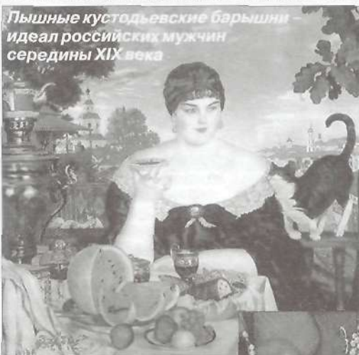
Пышные кустодьевские барышни – идеал российских мужчин середины XIX века

Конечно, можно набрать с дюжину качеств, присущих идеалу красоты современной женщины. Это здоровый вид, гармония черт лица, красивые волосы, пропорциональная фигура, лучистые блестящие глаза, ровные белые зубы, приятный голос, легкая походка, хорошая осанка, общительность, живой ум, искренность. А при мастерстве визажистов и уйме косметических