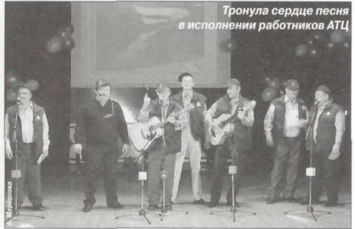
Тронула сердце песня в исполнении работников АТЦ

Успехов тебе, «Таркосаленефтегаз», новых трудовых вершин и жизненной стойкости, оптимистического настроения и счастья каждому сотруднику компании!