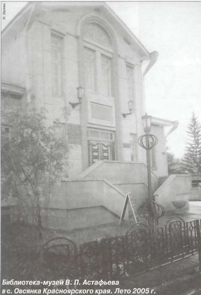
Библиотека-музей В. П. Астафьева в с. Овсянка Красноярского края. Лето 2005 г.