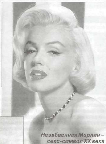
Незабвенная Мэрлин – секс-символ XX века

Есть такая легенда. В одном королевстве жили лысые люди с курносими носами и маленькими глазками. Они считали себя очень красивыми. Лишь одна девушка выделялась «безобразием»: у нее были большие глаза, длин-