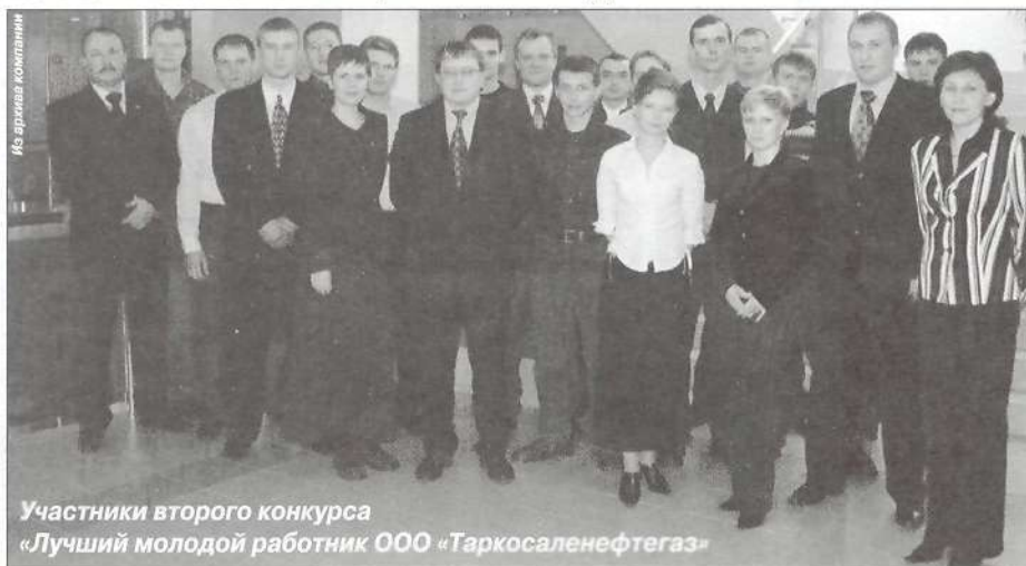
Участники второго конкурса «Лучший молодой работник ООО «Таркосаленефтегаз»

В причинах успеха «НОВАТЭКа» можно видеть самые разные составляющие современного бизнеса, но неизменным условием развития группы компаний всегда оставались крепкие традиции и смелые эффективные новации. Воплощением этих двух столпов стал уже традиционный конкурс «Лучший молодой работник ООО «Таркосаленефтегаз», который в феврале этого года прошёл во второй раз в дочернем предприятии «НОВАТЭКа». На конкурс молодые сотрудники представили 23 производственных предложения в области усовершенствования технологических процессов нефтегазодобычи, качества углеводородов, коммуникаций и связи. Четыре работника ТСНГ стали призерами, а еще семерых конкурсная комиссия отметила в номинации «За актуальность работ и творческий подход в решении задач». Предлагаем вам познакомиться с несколькими участниками конкурса.