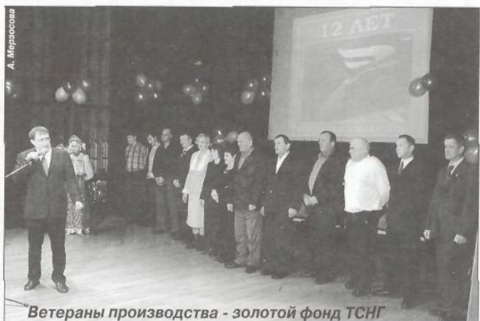
Ветераны производства - золотой фонд ТСНГ

«Таркосаленфтегаз» - это коллектив профессионалов, который успешно справляется со своей главной задачей - добычей углеводородного сырья. Прошедший год был сложным и насыщенным важными событиями. «НОВАТЭК» проводит политику консолидации профильных активов, и наша компания сменила организационно-правовую форму, став обществом с ограниченной ответственностью. С 2005 года ведем разработку двух месторождений - Восточно-Таркосалинского и Ханчейского. В перспективе планируется выход на другие месторождения Пуровского района с целью оказания операторских услуг.