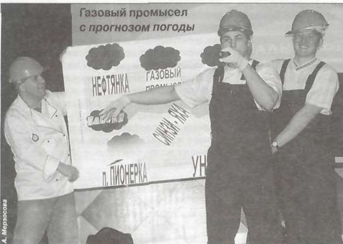
Газовый промысел с прогнозом погоды

Все было здорово! До следующего Дня рождения, «Таркосаленефтегаз»!