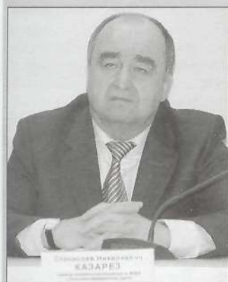
Станислав Николаевич КАЗАРЕЗ, главный федеральный инспектор по ЯНАО в УрФО:

- Главное, что на территории Ямало-Ненецкого округа власть понимает коренные малочисленные народы Севера, слышит и принимает во внимание их проблемы. Кроме того, хозяйствующие субъекты также по-государственному относятся к коренным