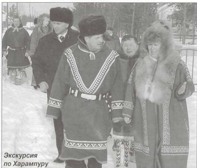
Экскурсия по Харампuru

Все дали очень высокую оценку возрождению древнего Харампура, отметили, что подобный опыт нужно развивать и прививать на территориях компактного проживания коренных народов.