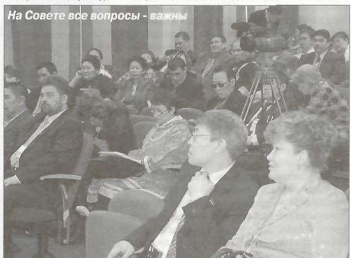
На Совете все вопросы - важны

Нам есть чем гордиться в сфере обеспечения коренных народов жильём. Так, в прошлом году было сдано в эксплуатацию около 2200 квадратных метров, в этом году предполагаем застроить более 3200 квадратных метров жилья для жителей коренной национальности. В настоящее время в каждом национальном посёлке Пуровского района ведётся активное строительство не только нового жилья, но и объектов здравоохранения, культуры. Построены школы в капитальном исполнении.