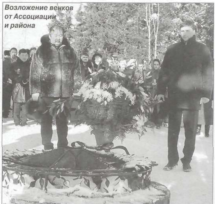
Возложение венков от Ассоциации и района

В. Н. ПИВНЕНКО - председатель Комитета Государственной думы РФ по проблемам Севера и Дальнего Востока в своем приветствии поблагодарила за приглашение принять участие в семинаре и заявила, что и впредь - а Валентина Николаевна уже не первый созыв возглавляет работу данного комитета - будет очень плотно работать совместно с Ассоциацией. Дала высокую оценку ее предыдущей работе: «Именно благодаря этой организации проблематике коренных малочисленных народов уделяется все больше внимания. Примером этому может служить продление Международного десятилетия коренных