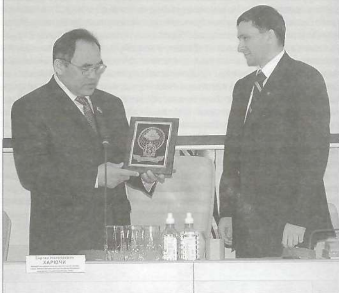
Вручение памятного подарка от округа главе Пуровского района