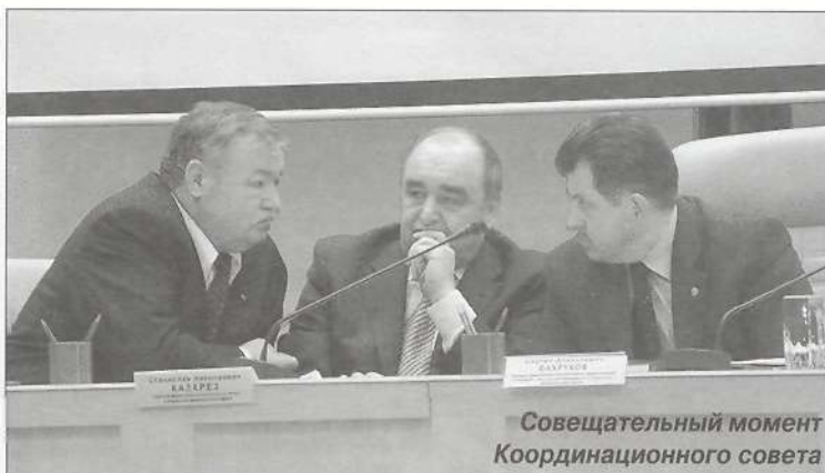
Совещательный момент Координационного совета

Ещё одна проблема - доступность услуг образования для проживающих в районах Крайнего Севера. Анализируя итоги 2005 года, мы можем констатировать, что количество студентов из числа коренных народов у нас уменьшается. В ряде школ-интернатов не преподаются те или иные предметы, а получить высшее образование без этих дисциплин невозможно. В ЯНАО и ХМАО органы государственной власти и местного самоуправления прилагают силы для того, чтобы эти вопросы решались, но здесь нужна консолидация усилий, в том числе, в рамках национального проекта «Образование».