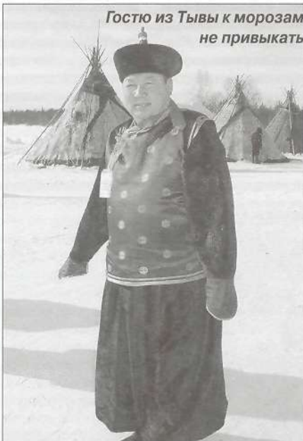
Гостю из Тывы к морозам не привыкать