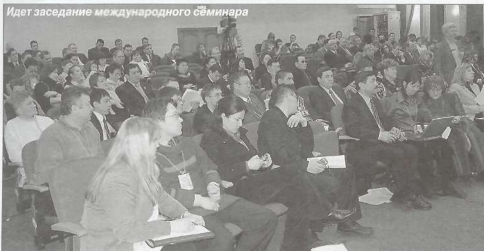
Идет заседание международного семинара

ри. Рассказала о совместной с представителями коренных народов работе над воплощением в реальность социальных проектов, таких, как Школа ремесел, курсы по оленеводству, по сохранению лососевых и ряда других. Создание экологических центров на местах, выработка экспертной оценки при выборе «рыба или нефть», возможность развития альтернативных источников существования для аборигенов, развитие экотуризма и пр. - вот неполный перечень программ, по которым работают представители данного международного проекта. В актив проекта ПРООН можно записать активную работу по разработке плана мероприятий по смягчению воздействия газопровода на лососевых, в результате которого был заморожен проект газопровода на Даль-