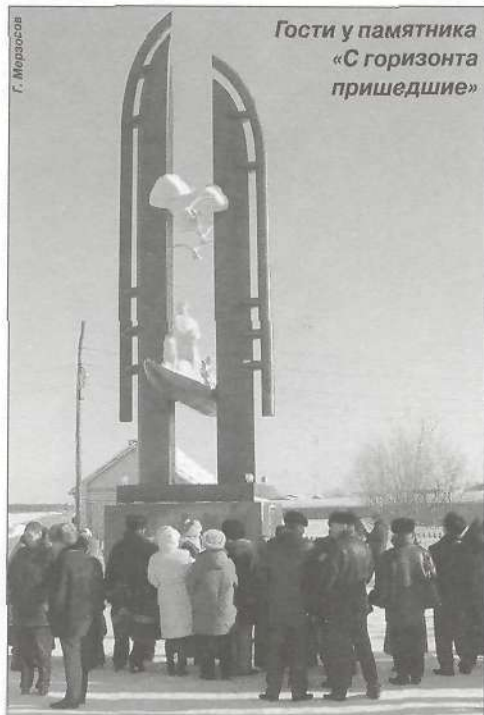
Гости у памятника «С горизонта пришедшие»

16 марта все участники семинара начали знакомство с Пуровским районом с посещения памятника «С горизонта пришедшие», затем, возложив венки к монументу, отдали дань памяти погибшим пуровчанам.