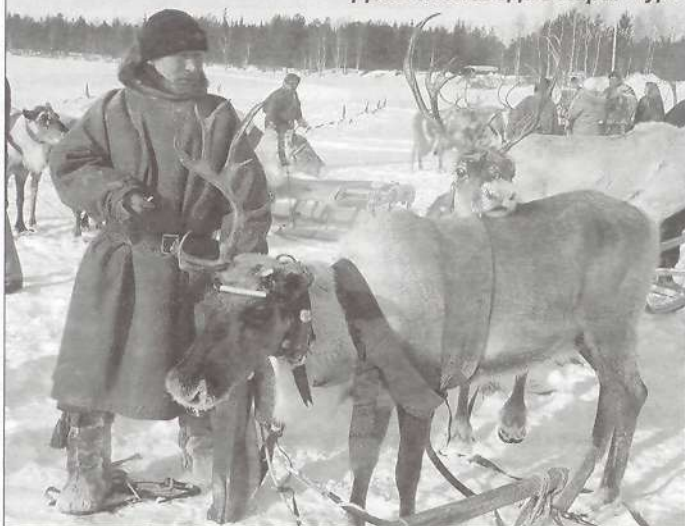
День оленевода в Харампуре

ется при заключении соглашений с нефтегазовыми предприятиями.