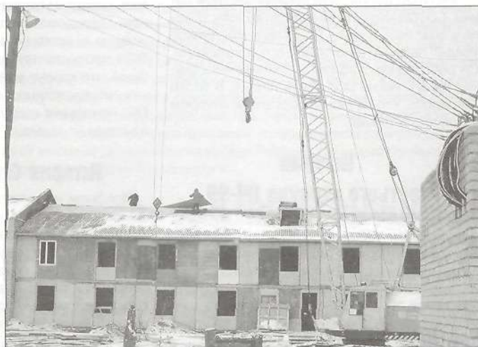
Восстанавливаемый после пожара дом