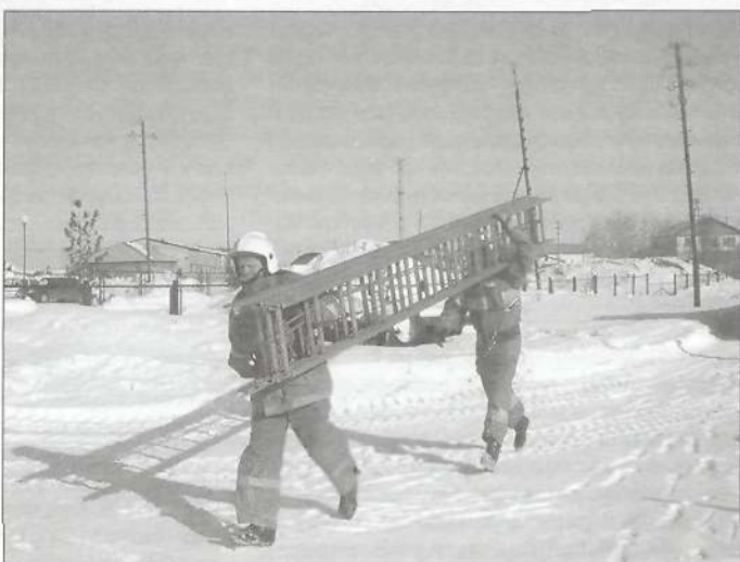
Тренировка на полосе психологической подготовки

п. Уренгой трудятся достойные люди, поэтому и в целом он заслуживает уважения. И когда в посёлке случается беда - пожар, то в течение 15 минут собирается весь личный состав - и начинается борьба со стихией огня. Потому что «если не мы, то...» - рассуждают они.