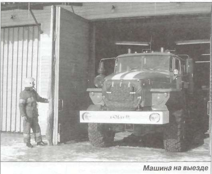
Машина на выезде