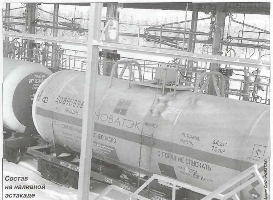
Состав на наливной эстакаде

«Российская газета» (приложение) 16 февраля 2006 года