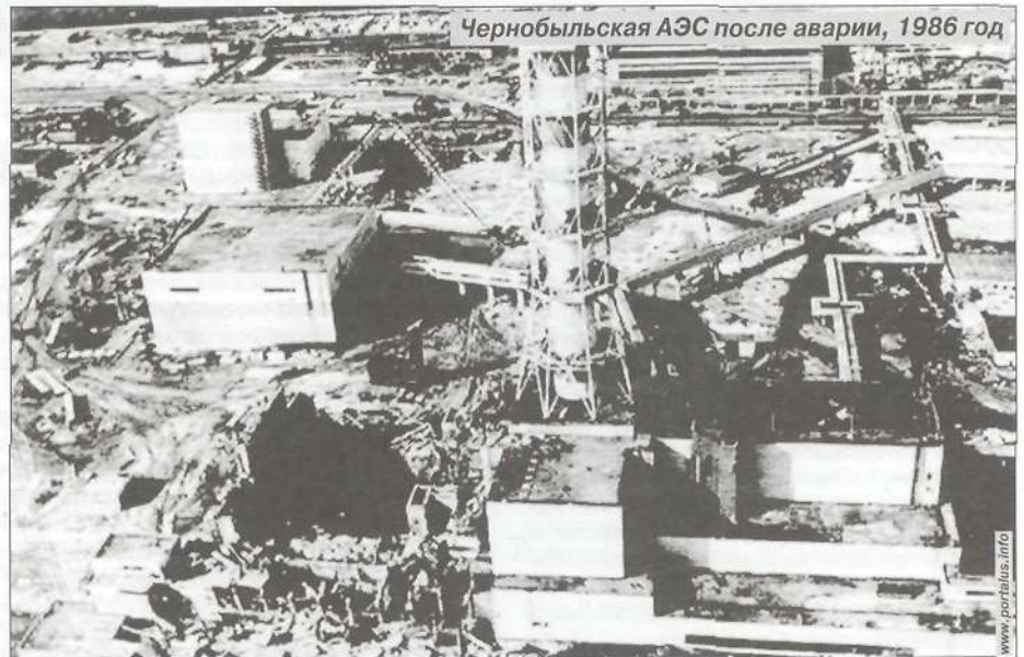
Чернобыльская АЭС после аварии, 1986 год

ние. Работающим ветеранам предоставляется ежегодный очередной оплачиваемый отпуск в удобное для них время, а также дополнительный оплачиваемый отпуск продолжительностью 14 календарных дней. Такова помощь государства. Но не все входящие в данную категорию граждане пользуются предоставленными льготами. На это есть несколько причин: некоторые считают эти льготы ничтожными, некоторые скрывают, что были в Чернобыле, а некоторым вообще чужды иждивенческие настроения. Конечно, последние - это те люди, которые несмотря на трагедию, произошедшую с ними, смогли состояться в этой жизни, им повезло больше других. Но как бы то ни было, даже они не в силах забыть о самой страшной техногенной катастрофе XX века. Об этой трагедии надо помнить. Ради тех, кто первым осознал свою беспомощность перед радиацией, перед этим невидимым врагом, но все же противостоял ей ценой своей жизни, ради тех, кто пытался свести последствия сильнейшего радиационного взрыва к минимуму, ради тех, кто и по сей день испытывает на себе последствия этой трагедии. Е. ТКАЧЕНКО