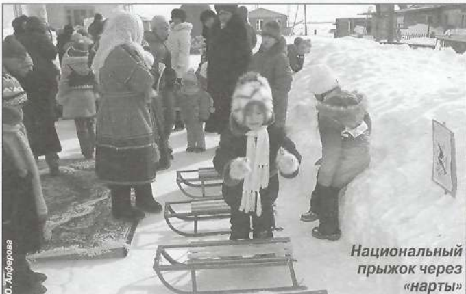
Национальный прыжок через «нарты»