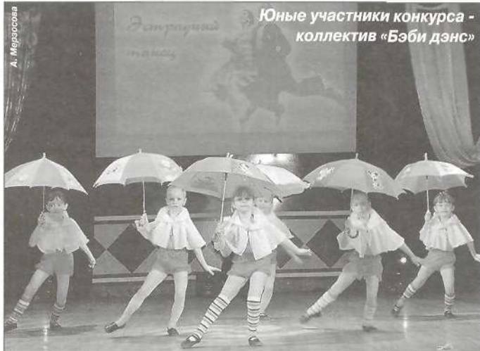
Юные участники конкурса - коллектив «Бэби дэнс»

ни - танцевальный коллектив «Морошка» (г. Тарко-Сале). В номинации «Народный танец (ансамбль)» (возрастная категория 14-17 лет) диплом I степени вновь был вручен коллективу «Виктория», диплом III степени получил коллектив «Школьная лесенка» (п. КС-02). В номинации «Народный танец (коллектив)» (7-10 лет) диплом III степени был вручен участникам коллектива «Бэби дэнс» из п. Уренгой. В номинации «Народный танец (коллектив)» (14-17 лет) диплом I степени получили участники коллектива «Морошка», диплом III степени - участники коллектива «Экзерсис» (п. Уренгой). В номинации «Эстрадный танец (коллектив)» (7-10 лет) диплом II степени увезли с собой юные танцоры из коллектива «Бэби дэнс». В номинации «Эстрадный танец (коллектив)» (11-13 лет) не было равных танцевальному коллективу «Экзерсис». В номинации «Эстрадный танец (ансамбль)» (11-13 лет) диплом I степени был вручен коллективу «Виктория», диплом III степени - коллективу «Всплеск» (п. Пуровск). В номинации «Эстрадный танец (ансамбль)» (14-17 лет) дипломы I и II степеней заслуженно получили участники коллектива «Виктория», диплом III степени - участники коллектива «Экзерсис».