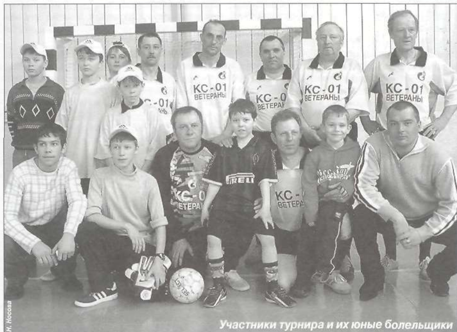
Участники турнира и их юные болельщики