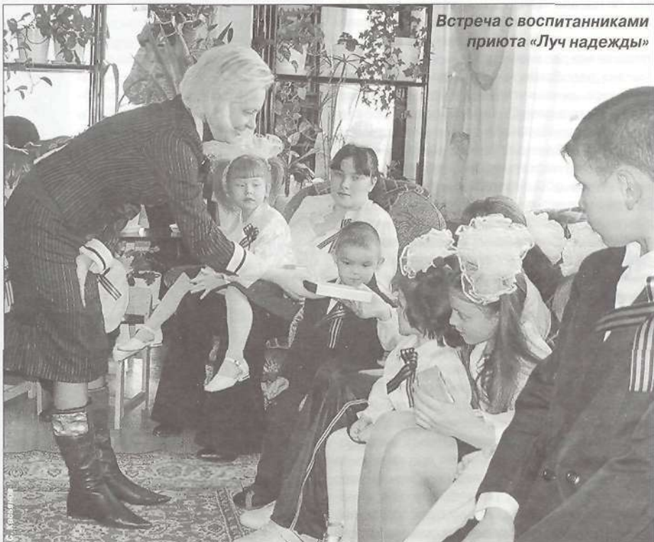
Встреча с воспитанниками приюта «Луч надежды»