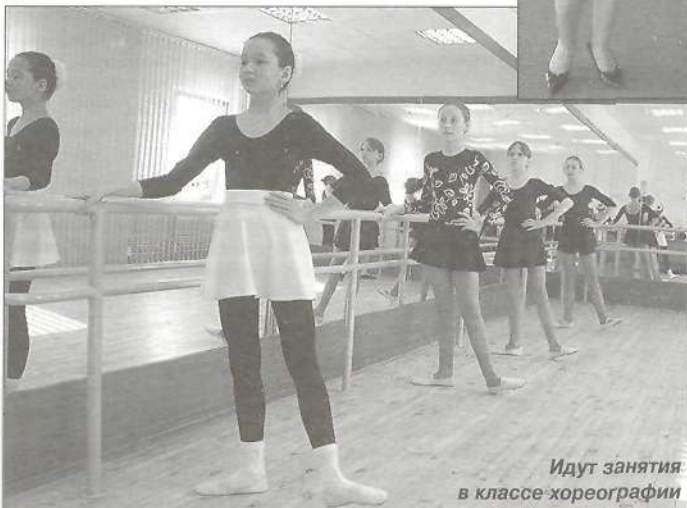
Идут занятия в классе хореографии