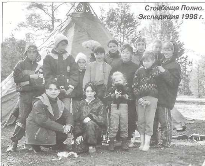
Стойбище Полно. Экспедиция 1998 г.

Учебные исследования обычно продолжают в течение учебного года. Здесь школьники работают уже со справочной литературой, газетными и журнальными материалами, представляют свои выступления и доклады на уроках, конференциях, различных конкурсах.