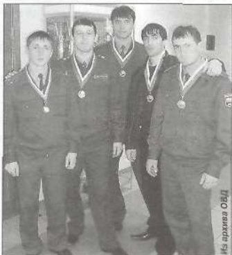
Из архива ОВД