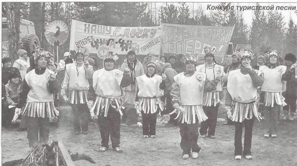
Конкурс туристской песни

И. ПЯК, инструктор-методист по туризму ЦДТик