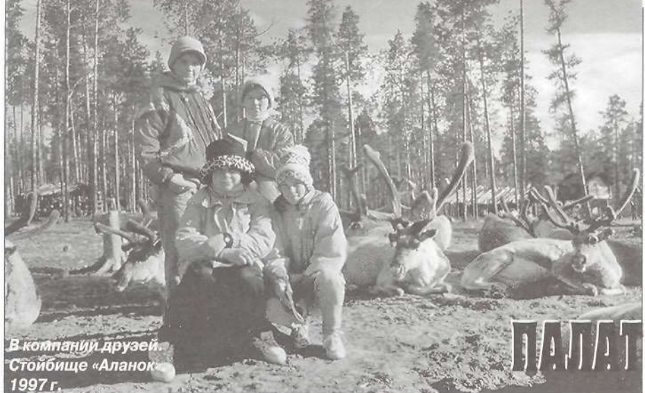
В компании друзей. Стойбище «Аланок» 1997 г.