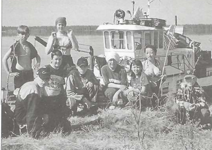
Станция Таз, поселок Долгий - 503 стройка. Июнь 2002 г.