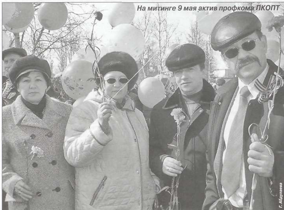
На митинге 9 мая актив профкома ПКОПТ