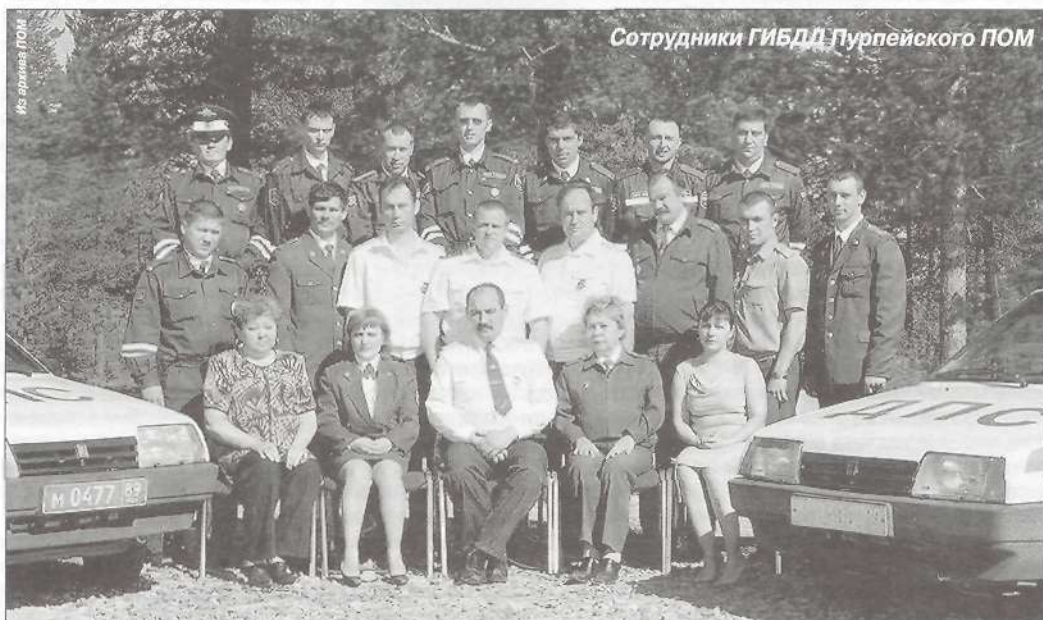
Сотрудники ГИБДД Пурпейского ПОМ

Ханымей был создан очень своевременно. С открытием федеральной автодороги Сургут - Салехард, проходящей через эту часть территории района, движение автотранспорта здесь увеличилось в несколько раз. Достаточно посмотреть анализ выявленных нарушений и дорожно-транспортных происшествий, чтобы понять, что нагрузка на личный состав подразделения резко возросла. Возьмем, к примеру, 2003 год: по сравнению с предшествующим вдвое увеличилось количество выявленных нарушений Правил дорожного движения, тогда же резко выросла и аварийность на обслуживаемых участках федеральной автодороги. Тем не менее, сотрудникам ГИБДД удалось взять под контроль и стабилизировать ситуацию - за последние два года эти показатели не имеют тенденции к росту. За прошедшие 5 месяцев текущего года общая аварийность снизилась вдвое, а количество дорожно-транспортных происшествий, совершенных по вине иногородних водителей,