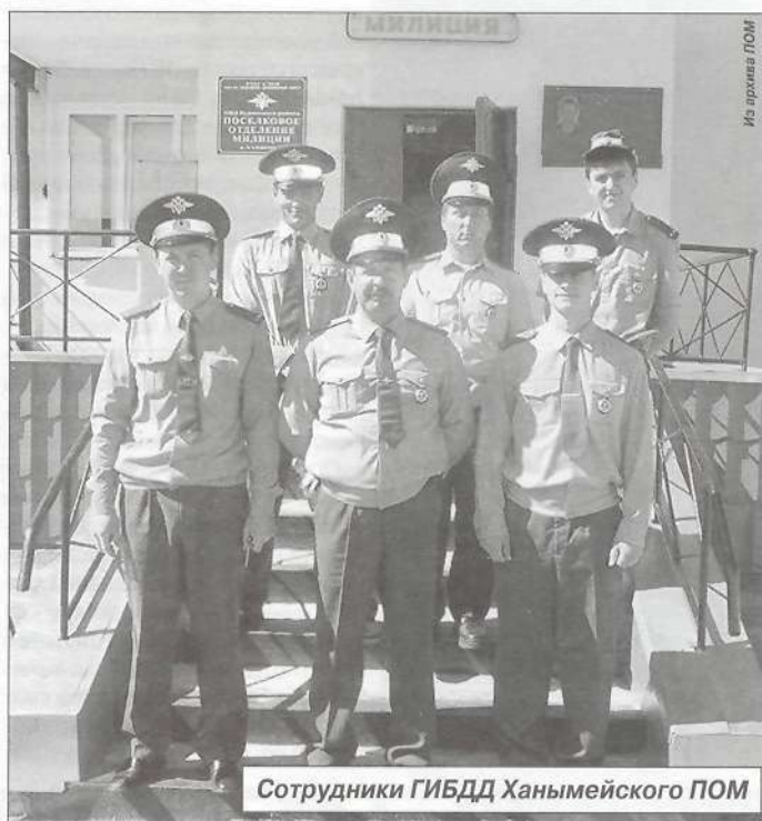
Сотрудники ГИБДД Ханымейского ПОМ

Для удобства жителей этой части Пуровского района, ранее вынужденных решать все проблемы, связанные с транспортом, в районном центре, в поселке Пурпе было создано полноценное подразделение Госавтоинспекции практически с полной структурой. Кроме взвода ДПС в его составе действуют регистрационно-экзаменационная группа, группа административной практики, работают инспекторы технического и дорожного надзора, агитации и пропаганды. Территория обслуживания подразделения огромна и простирается от восточной границы района, включая поселок Толька, до Ханымея. Сеть автодорог различных категорий, в том числе зимников, составляет более двух тысяч километров. На этой территории расположено большинство нефтяных и газовых месторождений юга Ямало-Ненецкого автономного округа и несколько вахтовых поселков нефтегазодобывающих предприятий. Помимо