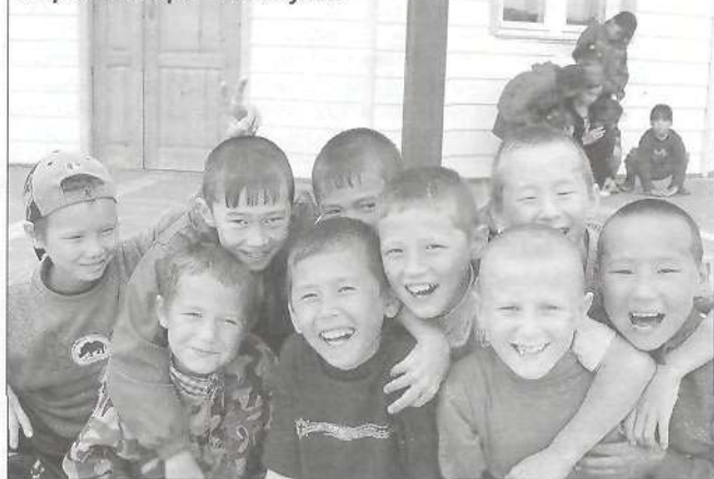
Хорошая пора - каникулы!