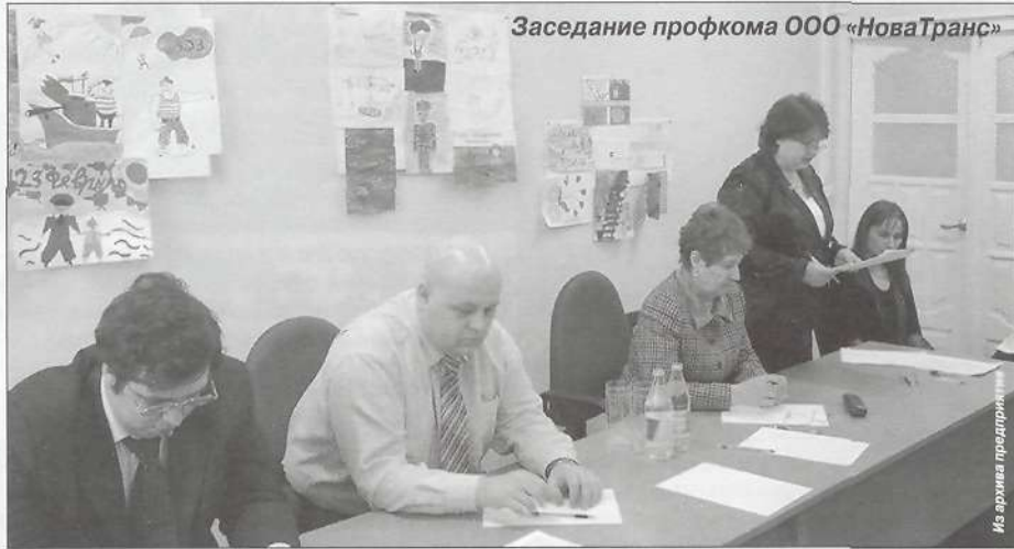
Заседание профкома ООО «НоваТранс»

Мы провели серьезную работу, в результате которой были приняты и внесены в коллективный договор ООО «НоваТранс»: правила внутреннего трудового распорядка; уточнения по дополнительным выплатам к заработной плате, тарифным ставкам районного коэффициента, процентным надбав-