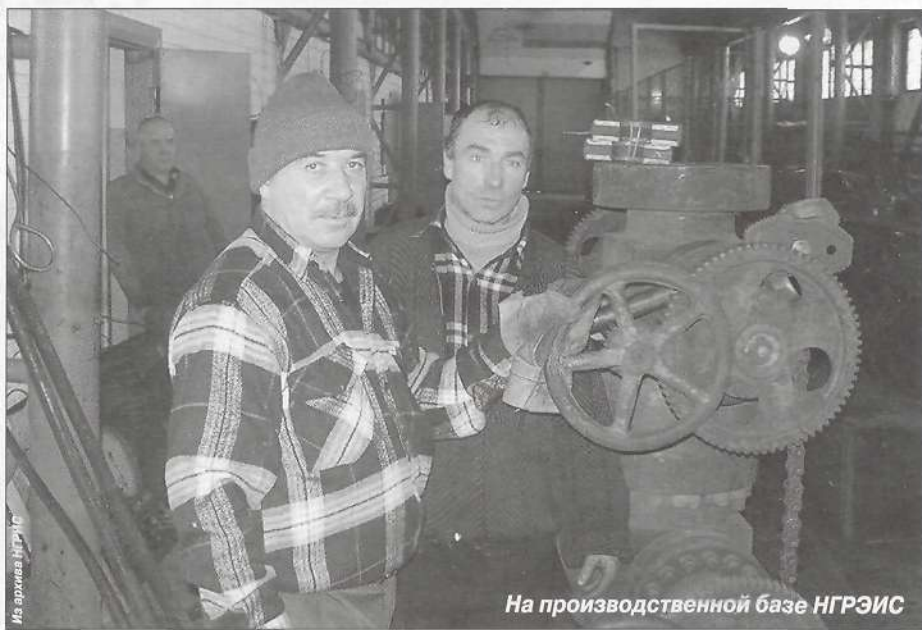
На производственной базе НГРЭС