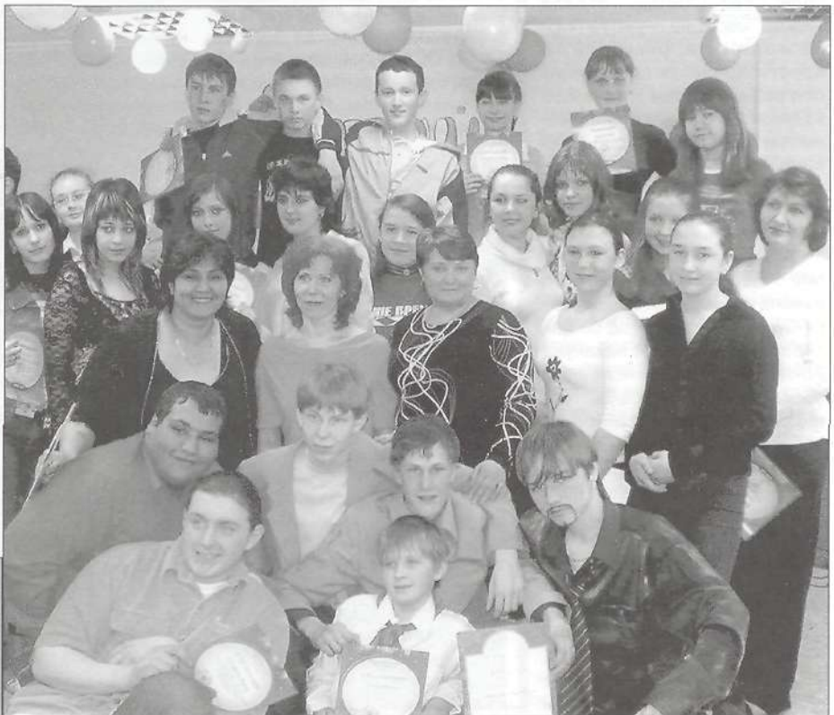
Фото на память после награждения активистов клуба «Островок» за 2005-2006 учебный год

Мы всегда рады, когда к нам приходят папы и мамы, рассказывают о своих детях и советуются по проблемам воспитания. Связь педагог - родитель - ребенок, к сожалению, в последние годы утратила свои