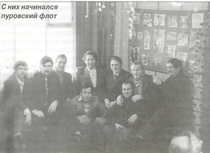
С них начинался пуровский флот