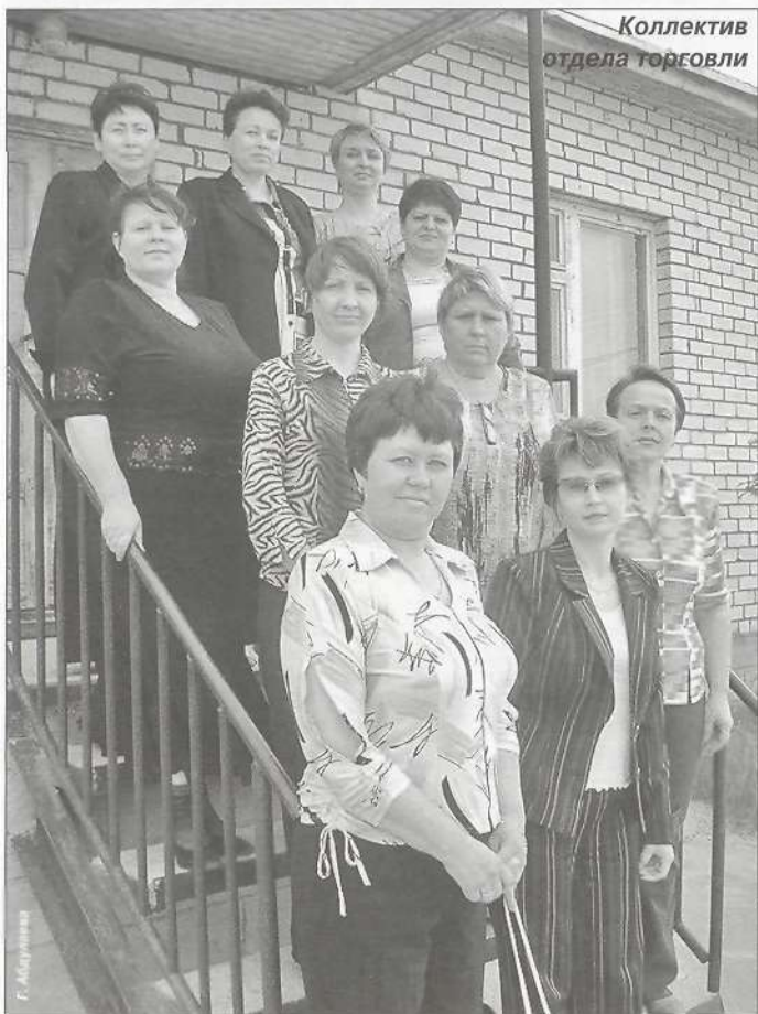
Коллектив отдела торговли

- Поставщики у нас надежные, не один год с ними работаем. В тендерных торгах участвуем. Но позиция руководства однозначная - мы принимаем продукцию только по ГОСТу. И основное условие - берем напрямую у производителя, не занимаясь перекупками. И претензии, если возникают, адресуем напрямую своему поставщику. Выгоднее, дешевле и более оперативно вопросы решаются.