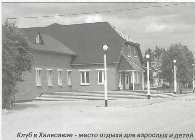
Клуб в Халясавэе - место отдыха для взрослых и детей

Но это не единственное достижение Халясавэя за этот год. Со всем недавно был сдан новый капитальный четырехквартирный одноэтажный дом с централизованным отоплением, ванной и туалетной комнатами. В данный момент приступили к строительству идентичного дома, а на будущий год запланирован еще один капитальный четырехквартирник. Можно с уверенностью сказать о том, что дома в Халясавэе растут, как грибы. За последние пять лет в поселке появились новые улицы капиталок: Строителей, Школьная, Центральная. Наверняка этот список будет продолжен. Всего в национальном поселке 17 домов в капитальном исполнении, в которых проживает одна треть от общего числа жителей.