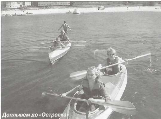
Доплывем до «Островка»

лее отличившихся и активных и награждаем их сувенирами. Впереди последний месяц лета. Мы гарантируем, что он пройдет не менее весело, чем предыдущие. У нас запланированы такие мероприятия, как спортивно-интеллектуальная игра «Дневной дозор», «Смотр косичек», «Оригами-шоу», «Оранжевая дискотека», «Морское randevu», «Ручейковая регата». У вас, ребята, возникло желание принять во всем этом участие? «Островитяне» ждут вас. Вместе с нами весело отдыхать в своем родном городе, мы уверены, что поможем вам приобрести новых и надежных друзей, найти для себя интересное и увлекательное занятие и, конечно же, запастись здоровьем и силами для нового учебного года.