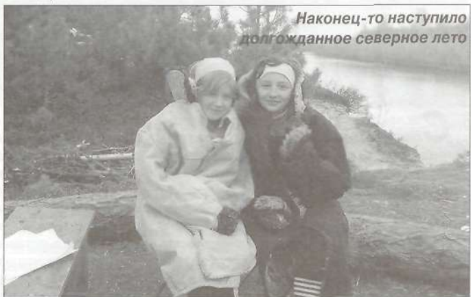
Наконец-то наступило долгожданное северное лето

Конечно, буду! Потому что здесь никого и никогда не обижают. Потому что здесь можно выиграть классные призы. В «Островке» мы узнаем очень много полезного для себя. Потому что мы научимся красиво вышивать, плести из бисера, вязать, выжигать, делать аппликации.