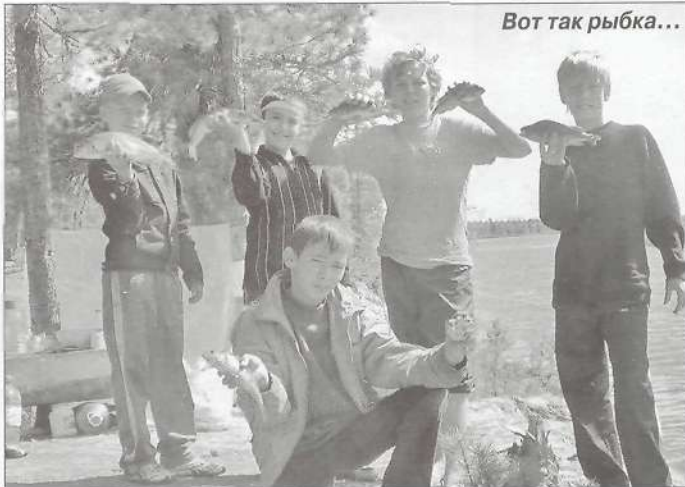
Вот так рыбка...

Для школьников летние каникулы - самое долгожданное время. В последний учебный месяц, когда дети начинают считать дни до начала отдыха, родители начинают ломать голову, куда же лучше отправить ребенка, чтобы их чадо хорошо отдохнуло: в лагерь или в гости к бабушке? Но бывает и такое, что планы и поездки срываются. И что же тогда делать? А тогда к вам на помощь придут педагоги подросткового клуба «Островок». Каждый день с двенадцати часов дня до шести часов вечера на различных площадках города дети могут поиграть в подвижные игры, принять участие в конкурсах, посостязаться в силе и ловкости в спортивных соревнованиях, проверить себя на выносливость, сходить со своими сверстниками в поход. Поход - это не только разбивание бивака, разжигание костра, но и различные конкурсы: «Замкостроительный бум», «Картофельные игрища», «Костер дружбы». Поэтому дети, которые знают