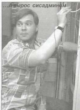
...А вырос сисадмином

- Индустрия игр заставила компьютеры развиваться и наращивать вычислительные мощности, то есть повышать производительность компьютеров. Поэтому для обычной работы того, что есть, даже больше чем надо, если речь не идет о, допу-