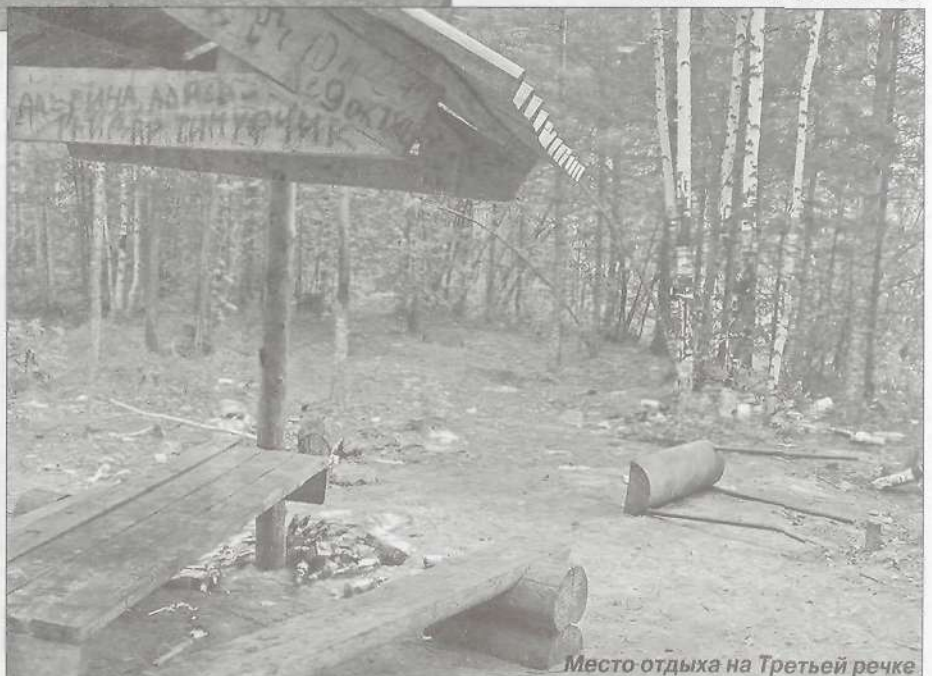
Место отдыха на Третьей речке

Проблема накапливающегося годами мусора затрагивает не только наш с вами город, и даже страну, но и мир в целом. Даже в экономически развитых странах на сегодняшний день остро стоит проблема утилизации мусора без нанесения вреда окружа-