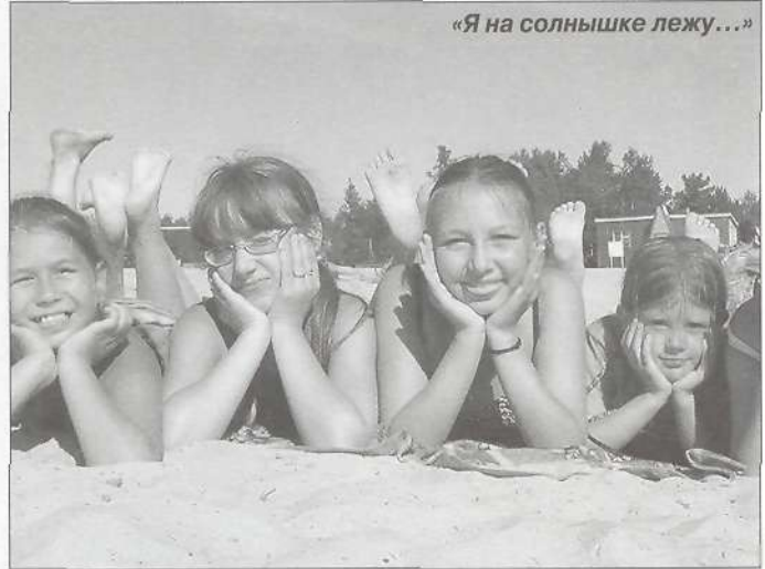
«Я на солнышке лежу...»

Детский боди-арт - это что-то, но «островитяне» проявляют свои художественные способности, участвуя и в «Музее асфальтовой живописи».