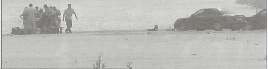
На берегу р. Айваседо-Пур

ющей среде. Решение этой проблемы от нас с вами не зависит, но мы можем не засорять среду нашего обитания, будь то дом, работа или место отдыха.