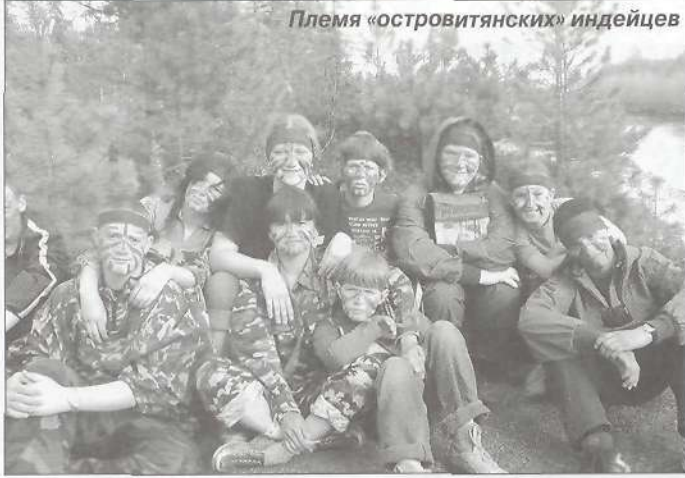
Племя «островитянских» индейцев

1 июня стал для подросткового клуба «Островок» знаменательным днем по двум причинам. Во-первых, в стенах клуба состоялся праздник, посвященный Дню защиты детей, с веселыми конкурсами, играми, эстафетами. В этот день невозможно было увидеть грустных лиц детей. Они были счастливы: бегали, прыгали, играли, шутили и при этом сотрясали стены клуба своим веселым смехом. К тому же всей детворе вручили подарки, преподнесенные активной молодежью «Таркосаленфтегаза» и «Пурнефтегазгеологии». Во-вторых, с этого дня у педагогов подросткового клуба началась работа на летних площадках по месту жительства.