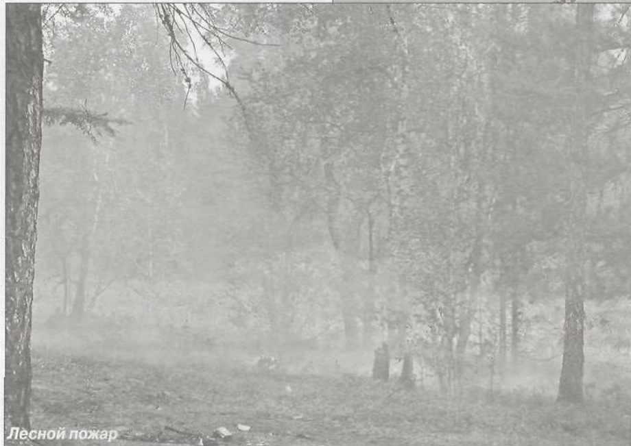
Лесной пожар в окрестностях Тарко-Сале

ружает. Я говорю сейчас не об окружающих нас людях, а о природе, которая безмолвно терпит все наши покушения на ее красоту и уникальность. Оставляя мусор в неполюженных местах, мы покушаемся даже на ее здоровье, ведь нарушаем хрупкое ее равновесие. А ведь с последствиями такого халатного отношения к природе жить не нам, а нашим детям. А где гарантия, что они не будут поступать так же, как мы? Ведь дети берут пример с родителей.