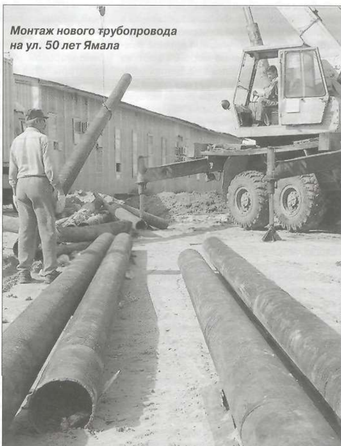
Монтаж нового трубопровода на ул. 50 лет Ямала