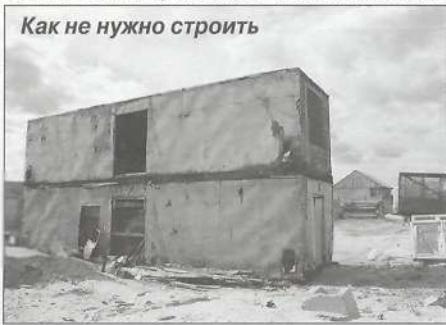
Как не нужно строить

- В настоящее время в Пурпе под строительство индивидуального жилья выделено 150 земельных участков, и семьдесят процентов граждан строительство ведут. Но практически во всех случаях, как я уже говорила выше, есть нарушения: либо не согласованы проекты, с чем мы постоянно боремся, либо не выполнены акты «выноса земельного участка в натуру», то есть не размечены по координатам границы земельного участка на местности и так далее. Подчеркну, что размечать границы должна специализированная фирма, имеющая лицензию, а приглашать ее обязан сам землепользователь.