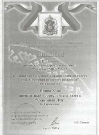
Диплом III степени окружного конкурса СМИ

Благодарим всех, кто помог, содействовал, поддерживал наш проект, за чуткость, понимание и терпение. Наши победы и успехи - это и ваша заслуга!