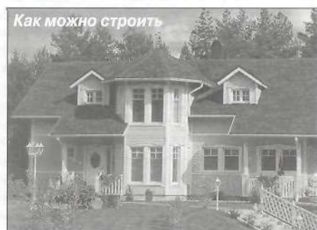
Как можно строить

на сегодняшний день у нас таких полномочий нет. Мы можем выписать предписание, можем вызвать инспекцию по архитектурному надзору. Но в любом случае: что такое 500 рублей штрафа в настоящее время?