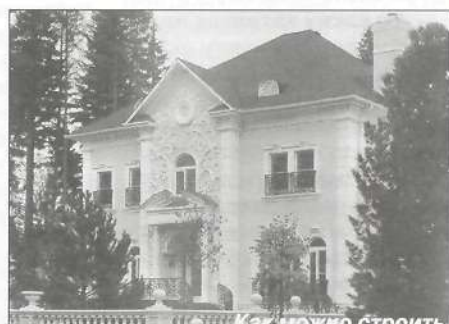
Как можно строить

- Когда гражданину выделяется земельный участок, с ними заключается договор аренды. Первоначально на один год, а затем - до 10 лет. Это максимальный срок аренды, применяемый в Пуров-