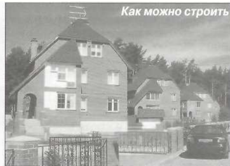
Как можно строить

- Если бы у нас были на местах какие-то существенные полномочия, например, мы бы могли наказывать людей штрафами... Но