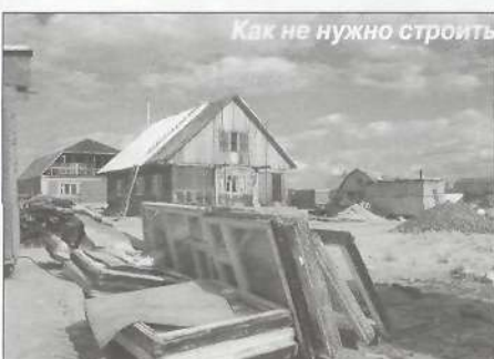
Как не нужно строить

но боремся, либо не выполнены акты «выноса земельного участка в натуру», то есть не размечены по координатам границы земельного участка на местности и так далее. Подчеркну, что размечать границы должна специализированная фирма, имеющая лицензию, а приглашать ее обязан сам землепользователь.