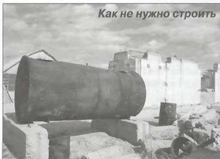
Как не нужно строить

- И сколько сегодня граждан Пурпе ведет строительство, и у скольких из них документы не оформлены надлежащим образом?