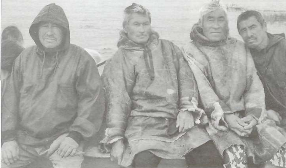
Самбургский генофонд - налицо

Проведя часть времени экспедиции в школе-интернате, я познакомилась с новшествами в процессе обучения маленьких аборигенов. Особо рада внедрению в школе национального компонента. Это замечательно, что пришло понимание данного как необходимости. В этом немалая заслуга ученых. Только наши ученые Сибирского