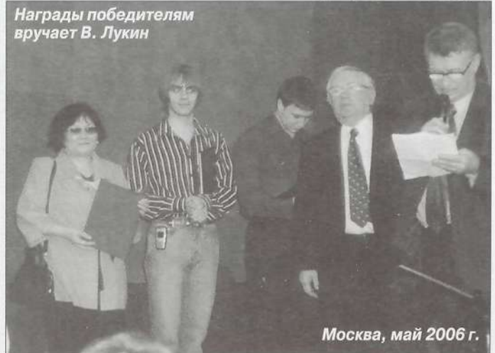
Москва, май 2006 г.