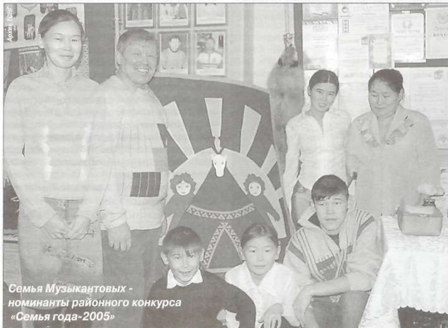
Семья Музыкантовых - номинанты районного конкурса «Семья года-2005»

Отдел информации и связей с общественностью ТСНГ