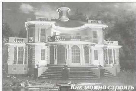
Как можно строить