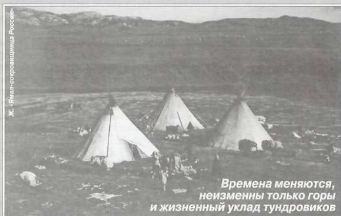
Ж. Явире-сохранительница России

Мы не знаем дальнейшую судьбу Сэротэтто, но недолго дли-