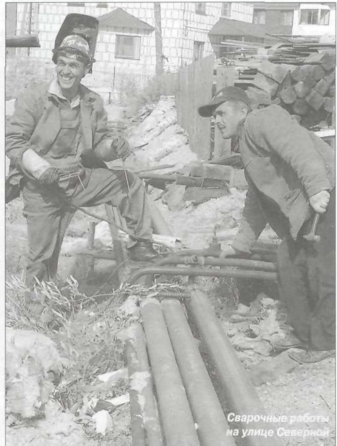
Сварочные работы на улице Северной

- Конечно. По заказу администрации района фирма «АСКО» разработала план перспективного развития инженерных сетей и строительства новых котельных. Кроме того, идут переговоры с ОАО «НОВАТЭК», которому для запуска второй очереди Пуровского ЗПК