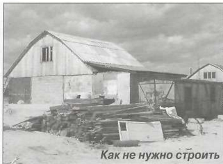
Как не нужно строить

ведет к увеличению числа граждан, не оформивших документы, но начавших строительство.