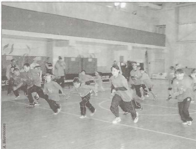
Игра «Воробьи и вороны» - команда Харампура

знакомились и нашли себе друзей в разных поселках.