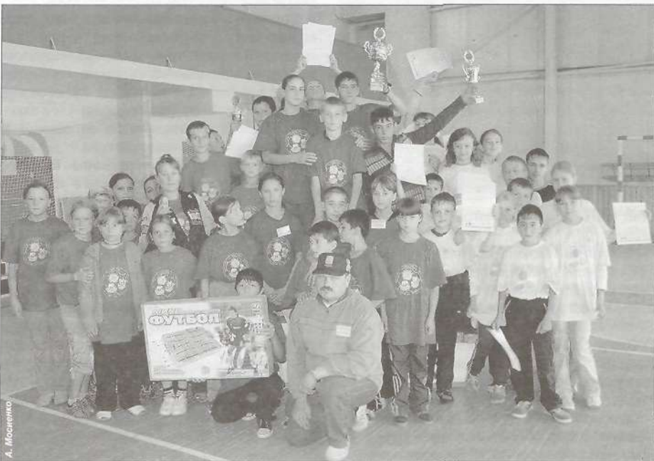
Пьедестал почета Спартакиады: (слева направо) команды Уренгоя, Пурпе, Тарко-Сале