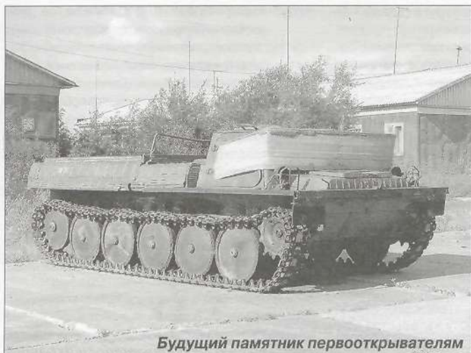
Будущий памятник первооткрывателям

гласно генплану планируется построить коттеджный поселок на 45 домов. Неподалеку уже сделана отсыпка и при скором завозе бетонных плит будет построена вертолетная площадка, столь нужная таркосалинцам во время ледохода для доставки через реку Пур к железнодорожной станции. В этом году людей пришлось высаживать прямо в тундру.