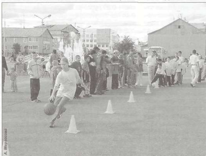
Один из этапов «Веселых стартов» - команда Тарко-Сале

в зале КСК «Геолог». После чего здесь же прошло торжественное построение, награждение команд и закрытие Спартакиады.