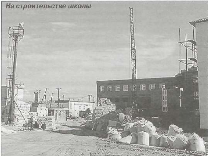
На строительстве школы