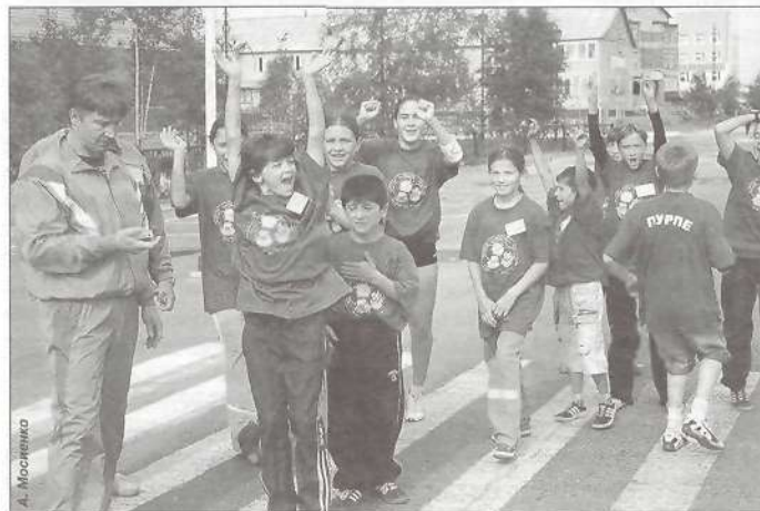
Команда Пурпе на легкоатлетической эстафете

12-14 августа 2006 года в г. Тарко-Сале прошла вторая районная летняя Спартакиада по спортивно-подвижным играм среди детских и подростковых команд по месту жительства «Спортивное лето -2006». В ней участвовали семь команд по 12 человек в возрасте от 9 до 14 лет, представлявших поселки Уренгой, Самбург, Пуровск, Пурпе, Ханымей, Харампур и г. Тарко-Сале.