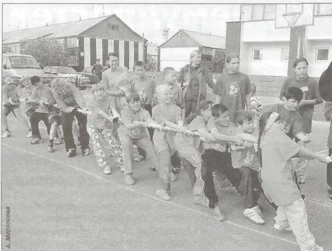
Перетягивание каната - команда Ханымей