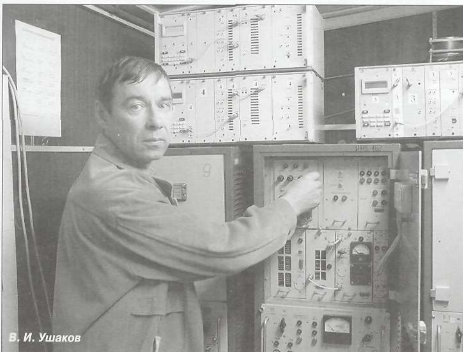
В. И. Ушаков