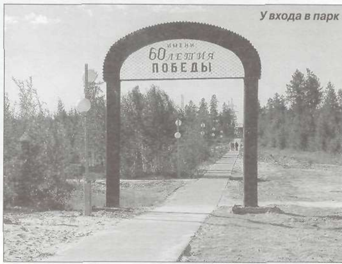
У входа в парк

В жилом доме напротив здания поселковой администрации тоже ведутся работы - меняют канализационные трубы.