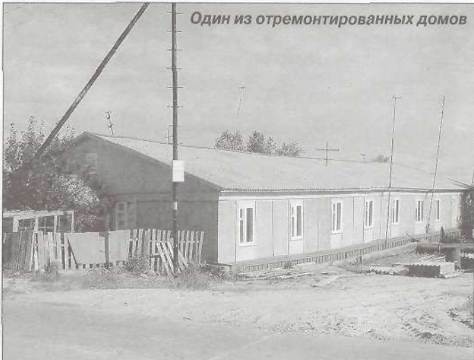
Один из отремонтированных домов