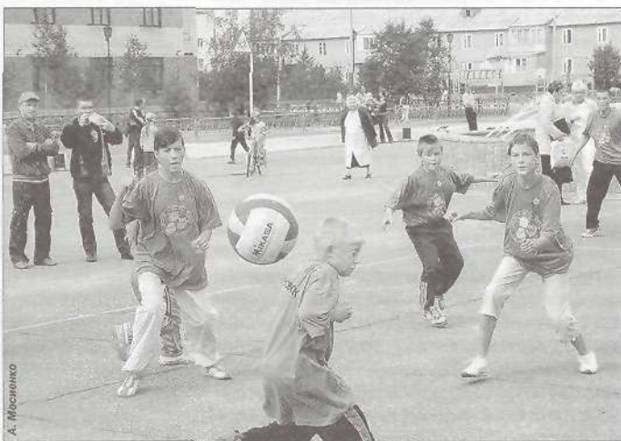
Игра «Охотники и утки» - команда Пуровска