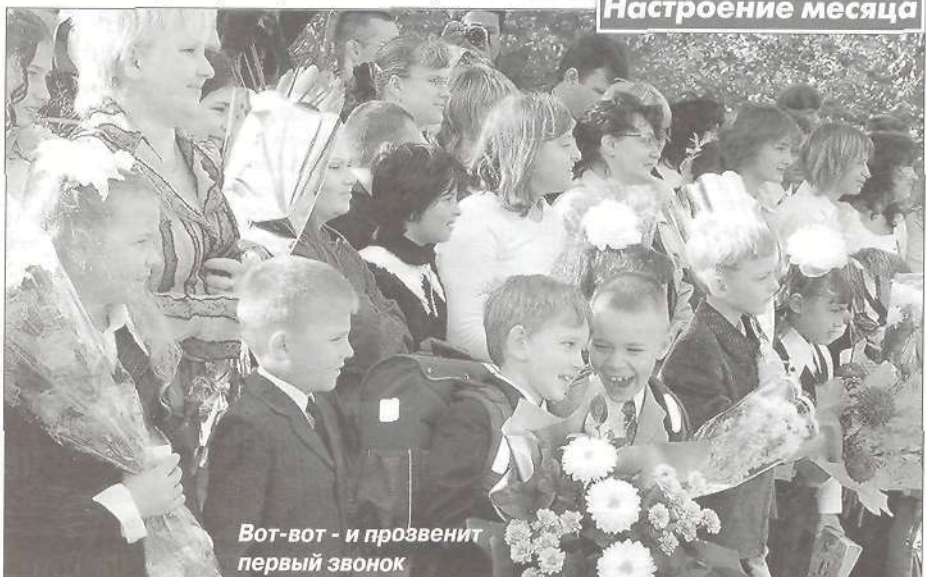
Вот-вот - и прозвенит первый звонок

Автор идеи и её воплощения С. ПИНСКАЯ, фото автора.