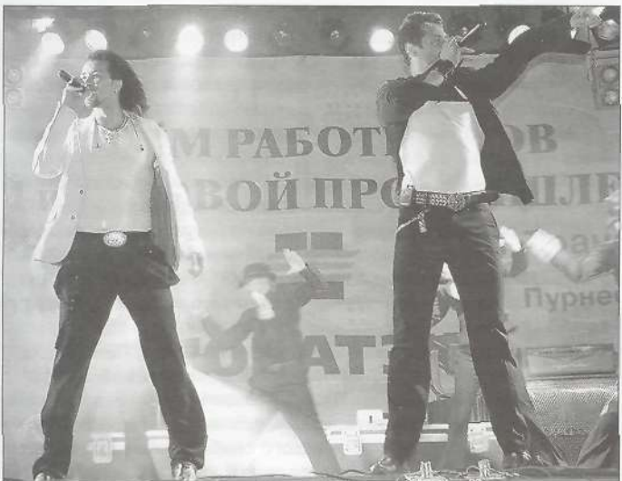
Фото А. МЕРЗОСОВОЙ, Р. АБДУЛЛИНА, А. МОСИЕНКО, Е. ТКАЧЕНКО, О. ЕРМАКОВОЙ, Г. АБДУЛАЕВОЙ