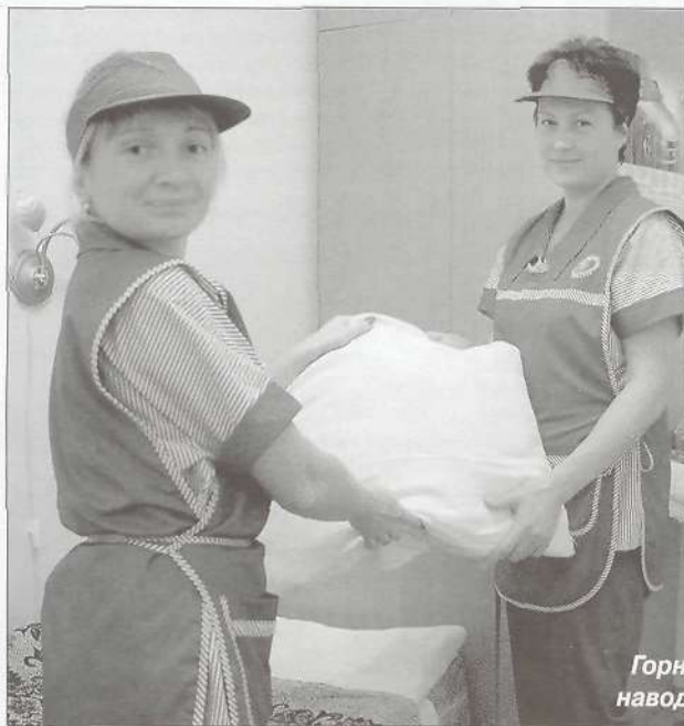
Горничные ВЖК наводят порядок

Завершился конкурс 1 сентября осмотром объектов ООО «Таркосаленфтегаз»: кафе в офисе компании, ВЖК и столовых на нефтяном промысле, в поселке Пионерном, газовом и газоконденсатных промыслах. Каждая столовая и каждый ВЖК, которые посетила комиссия, удивляли своими неповторимыми особенностями. Заметно, по сравнению с итогами прошлого года, подтянулась столовая на нефтянке. А новое здание ВЖК обслуживающий персонал поста-