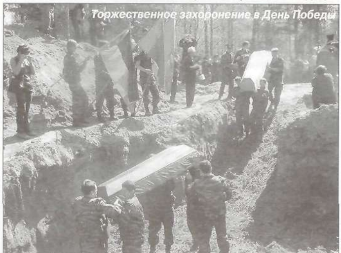
Торжественное захоронение в День Победы