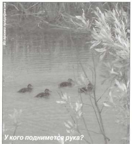
У кого поднимется рука?

- В апреле этого года на встрече в Сыктывкаре президент Путин обозначил проблемы лесной отрасли, по пунктам перечислив слабые звенья лесопромышленного комплекса. Необработанная древесина, так называемый кругляк,