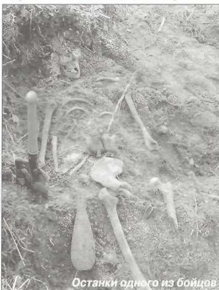
Останки одного из бойцов