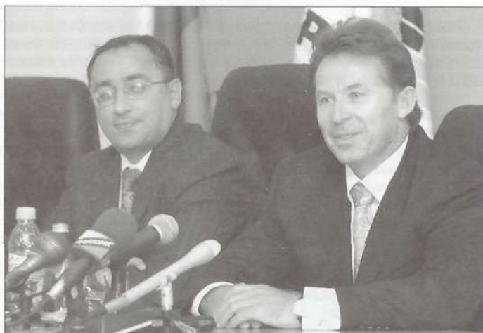
Генеральный директор ООО «РН-Пурнефтегаз» Эдуард Тропин и президент ОАО «НК «Роснефть» Сергей Богданчиков отвечают на вопросы журналистов

Определяя место «РН-Пурнефтегаза» среди других добывающих компаний «Роснефти», Сергей Михайлович отметил, что ресурсная база предприятия позволяет говорить об увеличении добычи газа и жидких углеводородов. Планируется, что предприятие к 2011 году будет добывать более 13 миллионов тонн нефти и конденсата, значительно вырастут и дебиты на новых скважинах - предположительно с 30 до 100 тонн в сутки. Это станет возможно благодаря новым технологиям в области разработки сложных в геологическом отношении месторождений, которые сегодня появились в мире, России и уже апробируются в «РН-Пурнефтегазе». Их применение в ближайшем будущем позволит компании резко увеличить объемы бурения на месторождениях общества. В будущем году число бригад по бурению увеличится более чем в три раза, а к