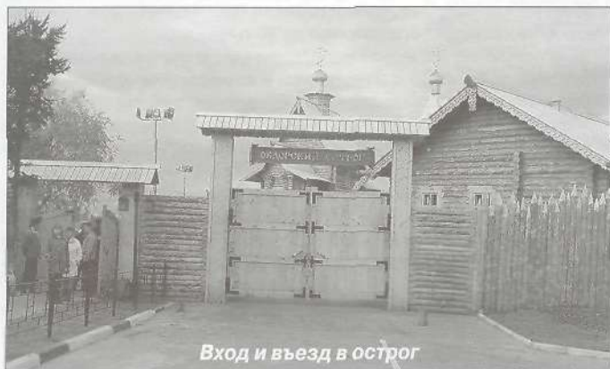
Вход и въезд в острог

9 сентября 2006 года окружная столица г. Салехард отмечал свой день рождения. Празднование Дня города началось с торжественного открытия Обдорского острога. Принять участие в этом мероприятии приехали представители сибирского и донского казачества, Донской казачий хор.