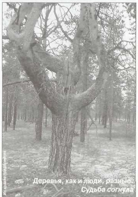
Деревья, как и люди, разные. Судьба согнута

А коллегам своим накануне профессионального праздника хочу сказать так: мы работали, работаем и будем работать, несмотря на все сложности и трудности периода реформаций. Работникам лесного хозяйства желаю крепкого здоровья, семейного благополучия, понимания правильности избранного пути.