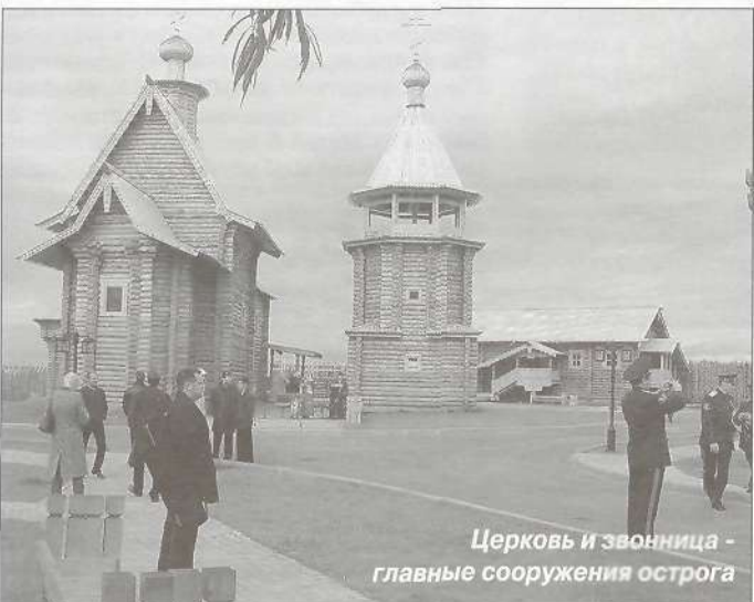
Церковь и звонница - главные сооружения острога

Поздравляя гостей и жителей Салехарда, атаман Сибирского казачьего войска, первый заместитель губернатора Ямала Анатолий Острягин сказал: «Это замечательный дар - в Сале-