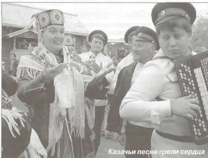
Казачьи песни грели сердца

Напомним, что в Салехарде на историческом месте недалеко от слияния рек Полуй и Обь создан историко-архитектурный