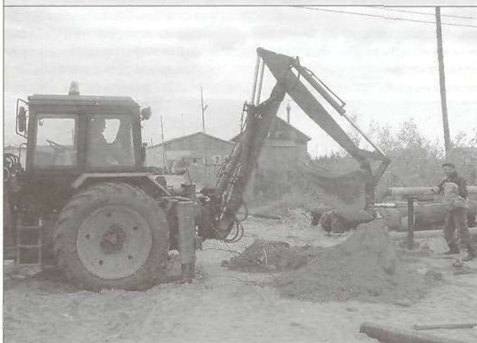
Работы по укладке газопровода на новые стойки опоры между микрорайонами 3 и 5 ведет ООО «Спецстроймонтаж»