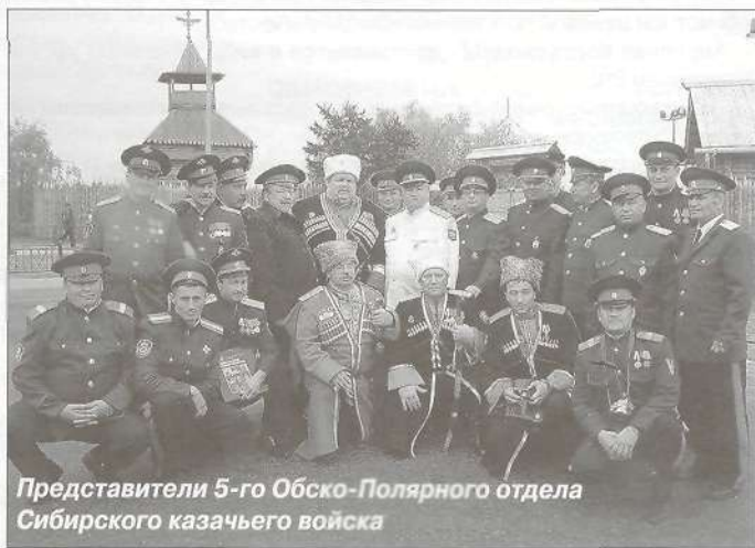
Представители 5-го Обско-Полярного отдела Сибирского казачьего войска

харде воссоздан Обдорский острог. В 1595 году казаки Березовского уезда построили эту крепость, и рядом с аборигенными поселениями появилось село Обдорск. Такой возрожденной казачьей крепости нет от Уральских гор до Камчатки. Все зна-