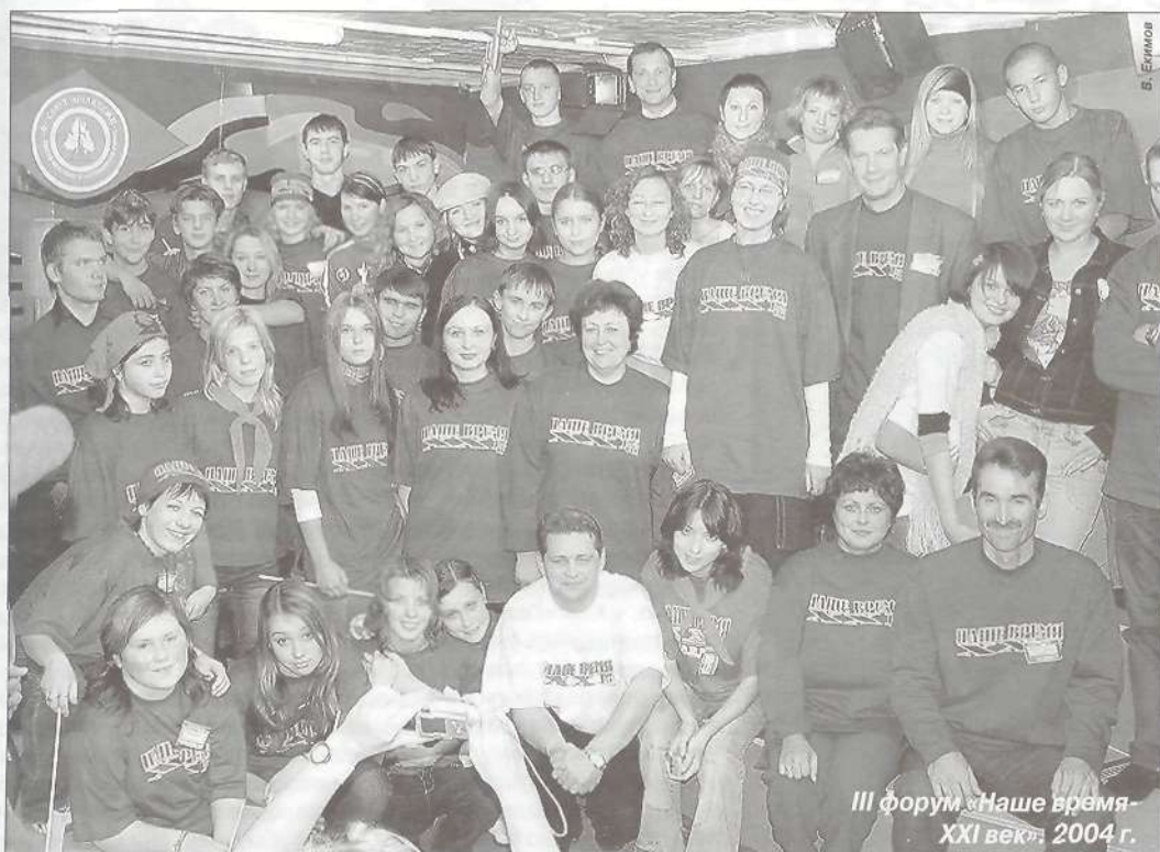
III форум «Наше время - XXI век»: 2004 г.

рами, продюсерами телевидения юные корреспонденты получают новые знания. Именно на телефоруме у ребят есть уникальная возможность задать вопрос настоящему профессионалу своего дела - именитому телевизионщику. Не забудут поговорить и о средствах выразительного монтажа, и об основах телевизионной журналистики.