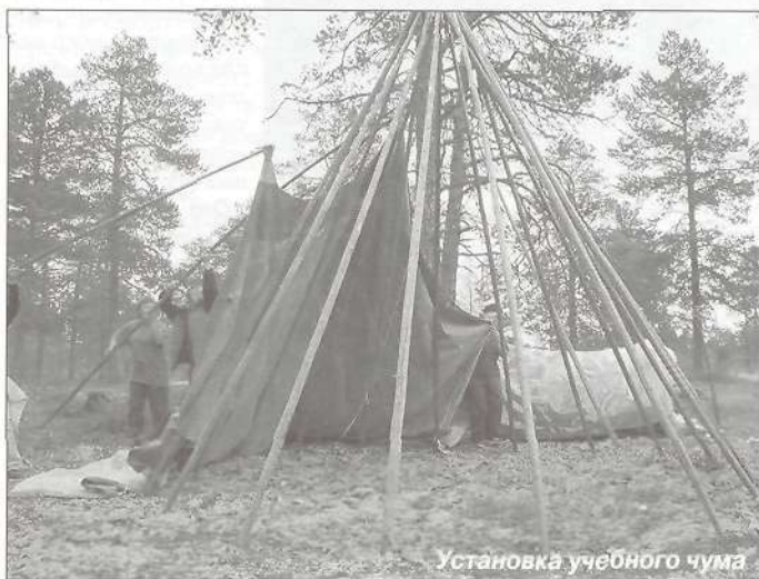
Установка учебного чума