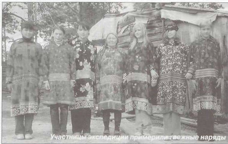
Участники экспедиции примерили тяежные наряды

Приехав в 12 часов ночи в стойбище Сопочиных, участники экспедиции разгрузили продукты и снаряжение, установили палатки и, поужинав, в 1.30 ночи легли спать. Следующий день ушел на обустройство бивака, уборку территории, подготовку