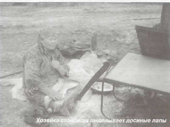
Хозяйка стойбища выделывает лосиные лапы