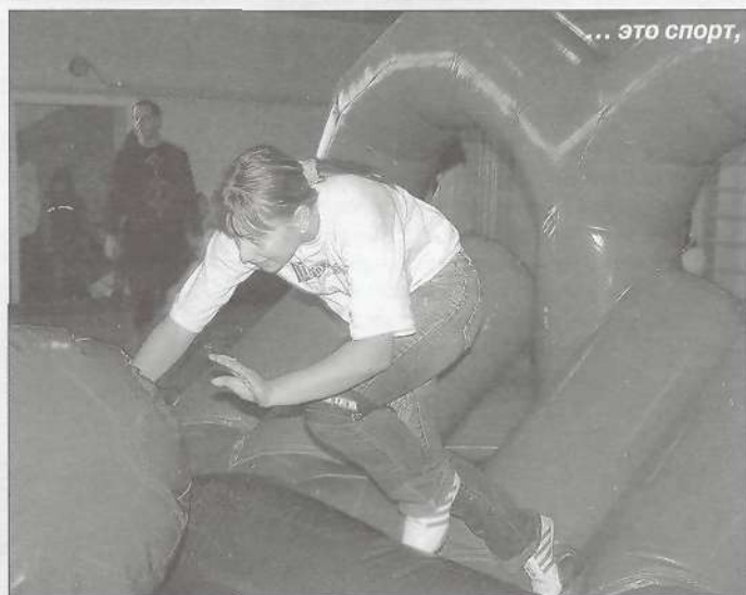
... это спорт,