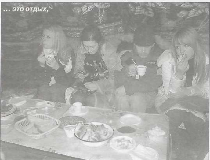
... это отдых,

В последний день для членов жюри и участников форума была организована экскурсия в национальное стойбище. Экскурсанты смогли познакомиться с укладом жизни коренных малочисленных народов Севера, отведать блюда традиционной кухни. Было немного смешно наблюдать, как ребята, да и члены жюри подготовились, а точнее не подготовились к экскурсии: многие, видимо, чтобы лучше смотреться в кадре, не стали надевать зимние шапки, теплые куртки, поэтому знакомство с жизнью коренных северян было прак-