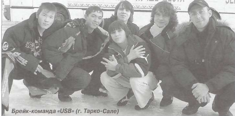
Брейк-команда «USB» (г. Тарко-Сале)

- ТАРКО - САЛЕ - НЕТ - ЛУЧШЕ МЕСТА НА - ЗЕМ