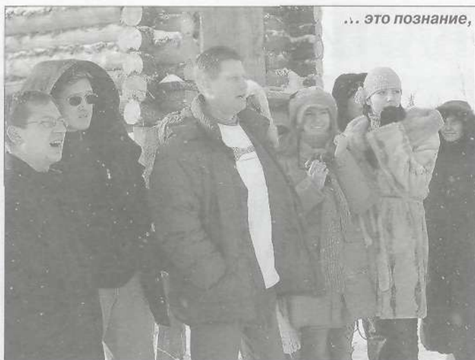
... это познание,

заны отрывки из лучших конкурсных сюжетов прошлых лет, а также прошла презентация старого гимна форума в новом звучании.