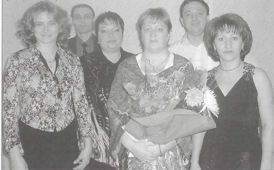
Тренеры КСК «Уренгоец»