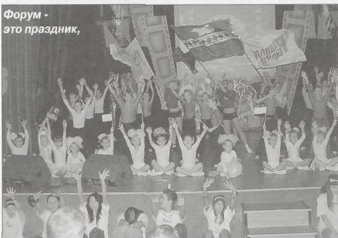
Форум - это праздник,

На прошлой неделе 22-25 октября Тарко-Сале встречал гостей - юных телевизионных журналистов со всех уголков России, приехавших на проходивший под девизом «За здоровый образ жизни» V Межрегиональный телефорум молодежи «Наше время - XXI век», организованный Пуровской ТРК «Луч» и региональным штабом Ямало-Ненецкого автономного округа ВОО «Молодая гвардия Единой России». Своё творчество представляли корреспонденты из Москвы, Санкт-Петербурга, Екатеринбурга, Челябинска, Омска, Тюмени, Ханты-Мансийска, Салехарда, Ноябрьска, Нового Уренгоя, Надыма, Муравленко, Тазовского, Мужей и населенных пунктов Пуровского района. Спонсорами выступили: ОАО «НОВАТЭК», ООО «НоваТранс», ООО «НоваЭнерго», ООО «Пуровская компания общественного питания и торговли «Пурнефтегазгеология».