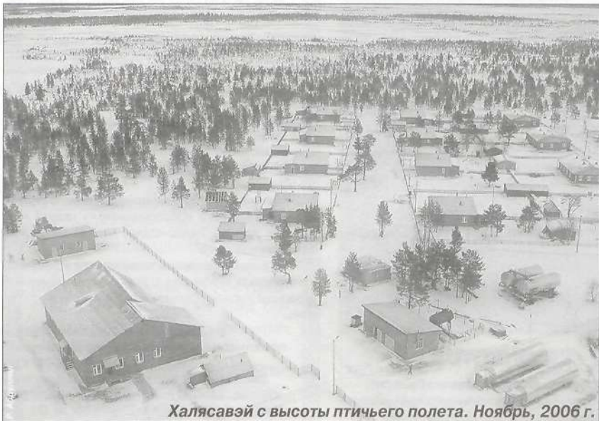
Халясавэй с высоты птичьего полета. Ноябрь, 2006 г.