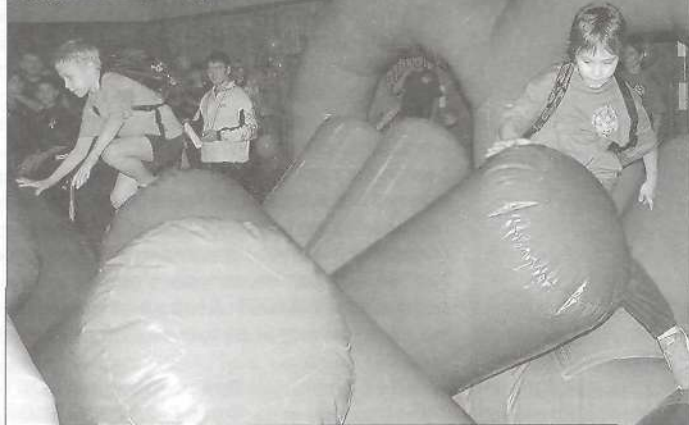
Полоса препятствий - надувной кошмар

Казалось бы, что смешного в бегущем или прыгающем человеке. На мой взгляд, ничего. Но то, как мы ползали, прыгали и бегали, вызывало у зрителей и судей такую бурю эмоций, что я порой смущалась чуть не до слез. Ну, улетел мой мячик, ну, пошибал он фишки, почему я вместо того, чтобы дальше выполнять задание, бросилась расставлять их по местам, честно скажу, до сих пор не пойму. Зато народ рассмешила. Еще веселило зрителей то, как мы преодолевали эту зловещую полосу препятствий. И если в начале эс-