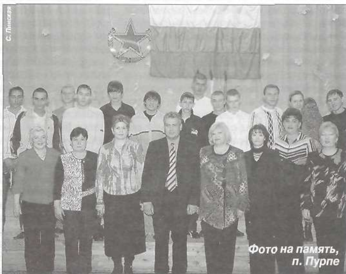
Фото на память, п. Пурпе