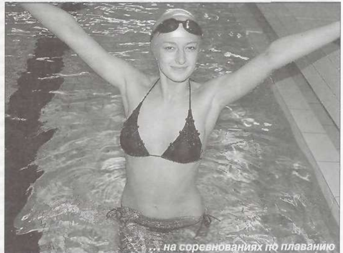
... на соревнованиях по плаванию

кие синие ленты, а на голове у трех - сверкающие диадемы. В обычной обстановке эти нарядные аксессуары можно было считать нарушением формы одежды, но только не в этот день. За право обладать каждым из них девушкам пришлось упорно побороться.