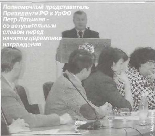
Полномочный представитель Президента РФ в УрФО Петр Латышев - со вступительным словом перед началом церемонии награждения

Газета «Северный луч» в октябре стала победителем открытого конкурса на лучшее освещение СМИ реализации приоритетных национальных проектов в Уральском федеральном округе в номинации «За лучшее освещение приоритетного национального проекта «Образование». Высокую награду из рук полномочного представителя Президента Российской Федерации в Уральском федеральном округе Петра Михайловича Латышева получил главный редактор газеты, денежная премия, соответствующая рангу победителей, придет банковским переводом. А теперь все по порядку.