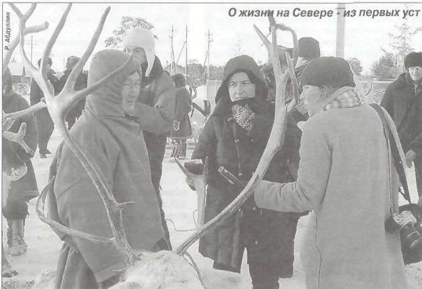
О жизни на Севере - из первых уст