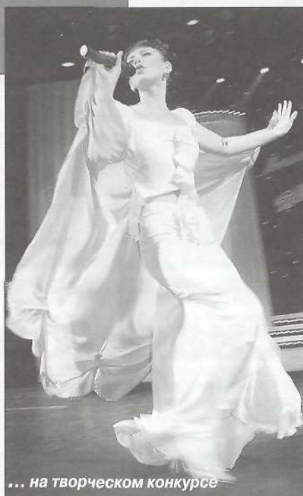
... на творческом конкурсе

С. СКИБА , инспектор по связям со СМИ штаба ОВД МО Пуровский район, капитан милиции.