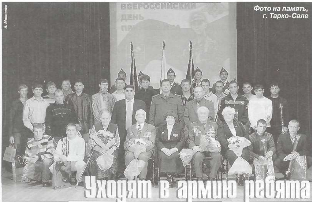
Фото на память, г. Тарко-Сале