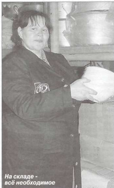
На складе - всё необходимое

Суровая зима уходящего года подтвердила, что это не просто слова, внося коррективы в, казалось бы, благополучно сложившийся потребительский рынок Тарко-Сале. Картофель, реализуемый компанией до последнего по 8-10 рублей за килограмм, - не показатель ли ее лояльности к покупателям,