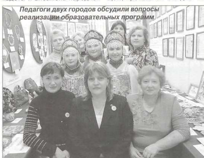
Педагоги двух городов обсудили вопросы реализации образовательных программ

- На мой взгляд, за эти три дня все мероприятия были проведены на высоком уровне. Мне очень понравилась наша встреча с новокуйбышевцами. Так же впечат-