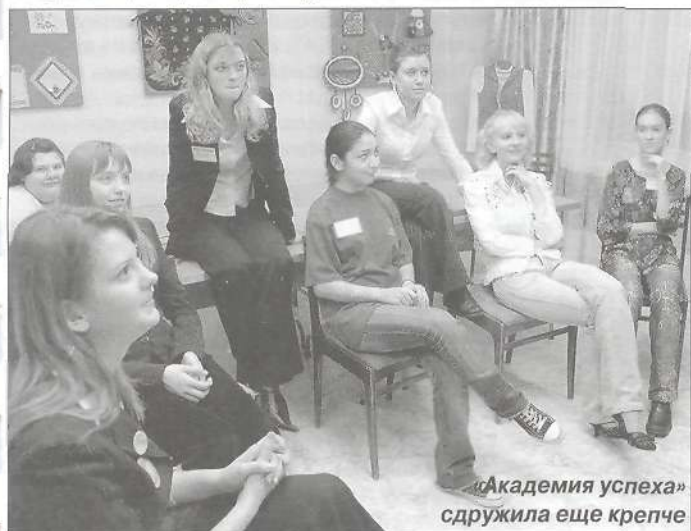
«Академия успеха» сдружила еще крепче

Последним аккордом встречи школьников двух регионов стал увлекательный тренинг «Академия успеха», который провел для