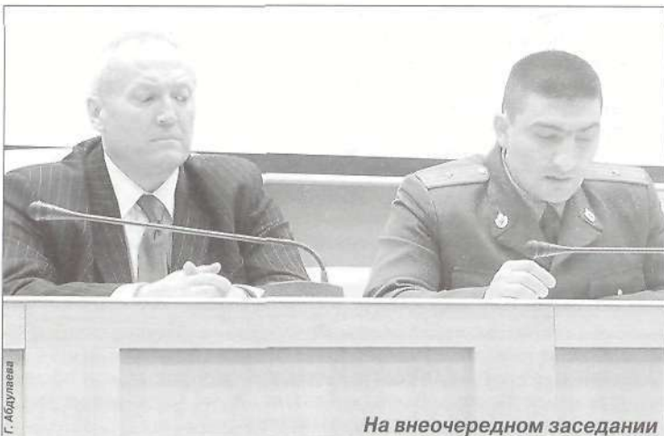
На внеочередном заседании