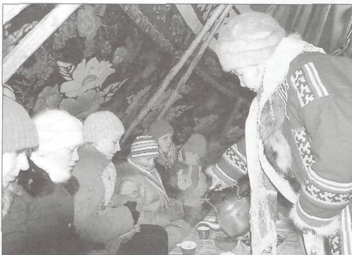
Поездка в стойбище запомнится надолго

Что кроме отдыха и новых впечатлений сулила эта встреча? Оказалось, для ребят были приготовлены не только увлекательные экскурсии. На четырехчасовой олимпиаде по математике, подготовленной Омским госу-