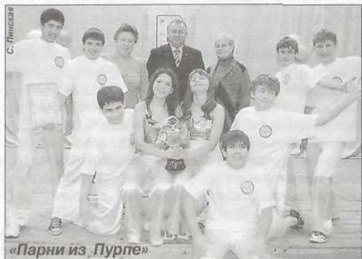
«Парни из Пурпе»

Фестиваль КВН - это праздник души! Вот и в субботу, 25 ноября, актовому залу Пурпейской средней школы № 1 был полон. Собрались любители шуток и юмора. На сцене выступили три команды старшеклассников: ПОММ (расшифровывать нужно так: поем, острым мы максимально) ПСШ № 3, «Газовые детки» ПСШ № 2 и «Парни из Пурпе» ПСШ № 1.