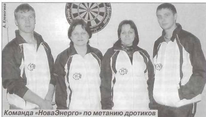
Команда «НоваЭнерго» по метанию дротиков