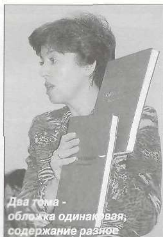
Два тома - обложка одинаковая, содержание разное

Обработать и дополнить все текстовые и фотоматериалы Евдо-