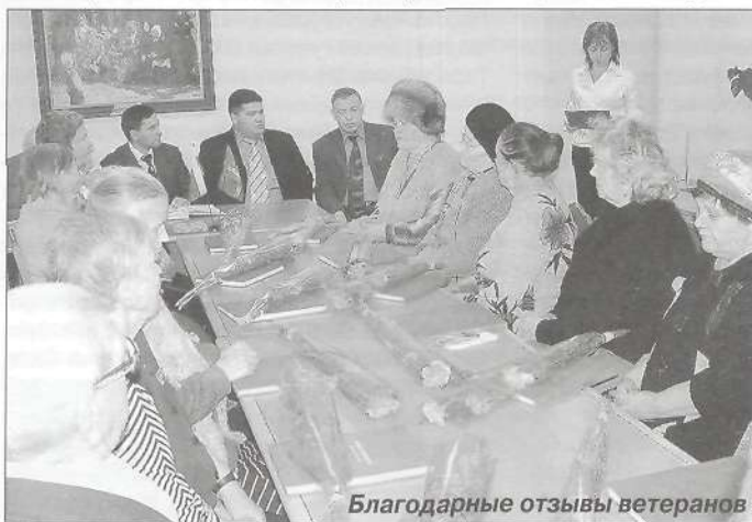
Благодарные отзывы ветеранов