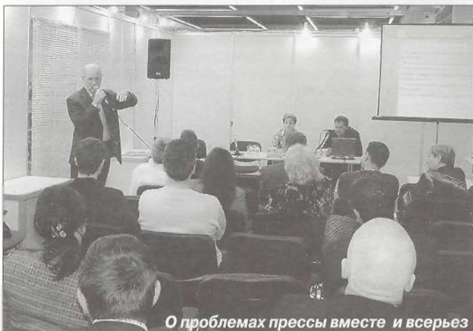
О проблемах прессы вместе и всерьез

сы, к примеру, привлекали посетителей песнями под гитару, Мордовия тоже пела, только на национальном языке. Всех поразили наши соседи (не по выставке, по жизни) — ХМАО. Во-первых, их делегация была настолько многочисленной, что даже не уместилась на один стенд, а во-вторых, всех впечатлил вокал девушки, поющей о Югорском Севере, но не с национальным колоритом, как мы все привыкли, а на хорошем эстрадном уровне. Кстати, песни эти из динамиков лились на протяжении всех дней выставки. В рамках 450-летия добровольного вхождения Башкирии в состав России участникам и гостям выставки была представлена грандиозная, красивая презентация «Печать Башкортостана». Зажигательные танцы студии «Хылыукай» («Красавица»), современные мелодии курая, демонстрации национальных костюмов первыми красавицами Башкирии собрали вокруг главной сцены десятки журналистов и телекамер, сотни зрителей. Каждое выступление сопровождалось яркими эмоциями и аплодисментами. Завершилась эта потрясаю-