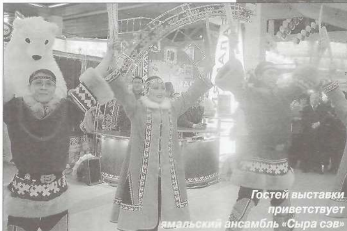
Гостей выставки приветствует ямальский ансамбль «Сыра сэв»

Выставка уже начала свою работу, а напряжение все никак не спадало — все ждали официального открытия мероприятия, которое почему-то долго не начиналось. Но вот дождался и этого. Провинциальному корреспонденту, честно признаюсь, сложно работать в условиях, когда не можешь встать со своим фотоаппаратом из подштативов стоящих над тобой телевизионных камер и когда поминутно в объектив вместо того, кого ты хочешь запечатлеть, влезает, извините, «пятая точка» тех, кому, видимо, такие мероприятия не в новинку и у которых нет озабоченности, испортит он кому-то кадр или нет. Кстати, чтобы занять даже такое неудобное место на холодном мраморном полу, приходилось его завоевывать за полчаса до начала действия. Те, кому такого счастья не выпало, немножко стесняясь, передавали фотоаппараты более удачливым с просьбой сделать пару кадров. Поэтому журналисты напоминали неких солдат, стреляющих сразу из нескольких винтовок. Лично я «стрелял» из трех фотокамер, и это был не рекорд.