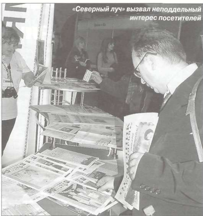
«Северный луч» вызвал неподдельный интерес посетителей

Наиболее запоминающимися были, конечно, презентации стендов. Белору-