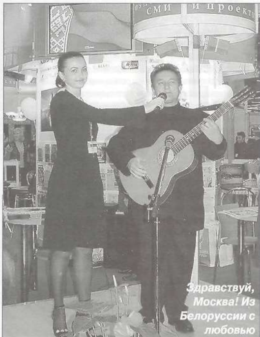
Здравствуй, Москва! Из Белоруссии с любовью

сы, к примеру, привлекали посетителей песнями под гитару, Мордовия тоже пела, только на национальном языке. Всех поразили наши соседи (не по выставке, по жизни) — ХМАО. Во-первых, их делегация была настолько многочисленной, что даже не уместилась на один стенд, а во-вторых, всех впечатлил вокал девушки, поющей о Югорском Севере, но не с национальным колоритом, как мы все привыкли, а на хорошем эстрадном уровне. Кстати, песни эти из динамиков лились на протяжении всех дней выставки. В рамках 450-летия добровольного вхождения Башкирии в состав России участникам и гостям выставки была представлена грандиозная, красивая презентация «Печать Башкортостана». Зажигательные танцы студии «Хылыукай» («Красавица»), современные мелодии курая, демонстрации национальных костюмов первыми красавицами Башкирии собрали вокруг главной сцены десятки журналистов и телекамер, сотни зрителей. Каждое выступление сопровождалось яркими эмоциями и аплодисментами. Завершилась эта потрясаю-