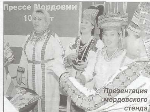
Презентация мордовского стенда