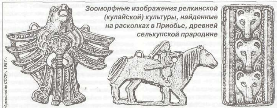
Зооморфные изображения релкинской (кулайской) культуры, найденные на раскопках в Приобье, древней селькупской прародине

На рубеже X-XI веков среди тюркских кочевников Казахстана и Южной Сибири усилились кыпчаки , западная ветвь кимакских племен. В начале XI века кыпчаки продвинулись в Заволжские и Южнорусские степи, где получили известность как половцы и куманы. С этого времени степные пространства от Днепра до Иртыша и озера Балхаш в сочинениях восточных авторов стали называться Кыпчакской степью . После завоевательных походов монгол в начале XIII века территория кыпчакских племен вошла в Золотую Орду, а сами кыпчаки составили основное ядро его населения. В середине XIV века начались и в дальнейшем не прекращались междоусобные распри владельцев отдельных улусов. На окраинах некогда единого государства возникали обособленные орды и ханства. Одно из них - Тюменское ханство . За главенство в Тюменском ханстве вели упорную борьбу потомки чингисида Шейбана из династии узбекских ханов и местная знать из сибирского ханского рода Тайбуги. В конце XV века на среднем и нижнем Иртыше тайбугины основали уже вполне самостоятельное Сибирское ханство, в состав которого вошли Тюмен-