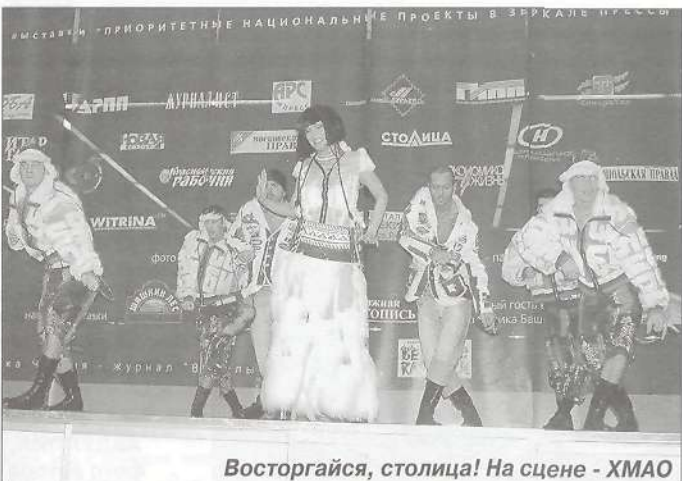
Восторгайся, столица! На сцене - ХМАО