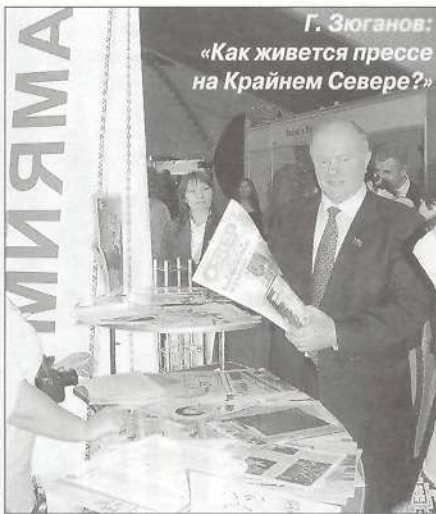
Г. Зюганов: «Как живет прессе на Крайнем Севере?»

Как все хорошее рано или поздно заканчивается, так выставка подошла к своему логическому завершению. Закончился этот трехдневный круговорот газет и журналов, участники форума стали потихоньку разъезжаться к своим рутинным редакционным заботам. В самолете стюардесса, как обычно, предлагала пассажирам периодику. Немного уставший от нее, все-таки решил почитать что-нибудь из столичного. И вот, на тебе, уже написано про выставку, уже подведены итоги. К радости обнаружил, что ямальскому представительству выделен целый увесистый абзац. Обрадовался рано. Написано там было, что вот, дескать, ямальцы опять всех поразили своей презентацией, а мы (имеется в виду издание, которое держал в руках) как истинные профессионалы не стали заморачиваться на привлечение посетителя таким образом, мы серьезная газета, и наш главный козырь – внутреннее содержание. Ничуть не правда! Внимательно изучив все представленные стенды, скажу, что ямальская пресса ничуть не хуже, если не лучше, прессы из других регионов и даже Москвы. И к нашему стенду у гостей выставки интерес был неподдельный не потому, что у нас было весело, а потому, что многие из них (люди, в основ-