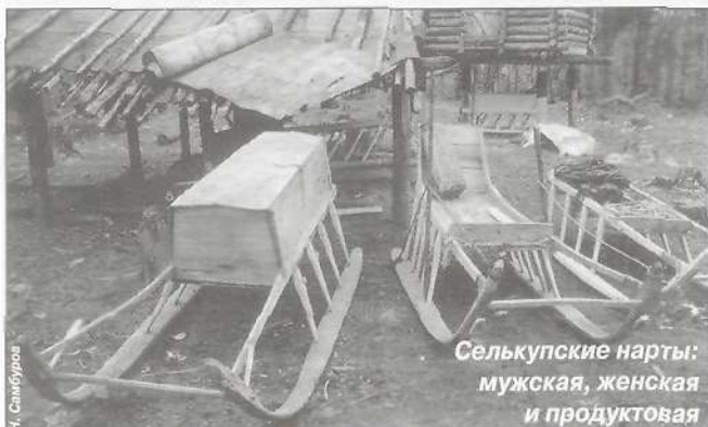
Селькупские нарты: мужская, женская и продуктовая

чае – кедр. Деревья в жизни селькупов издавна играли большую роль. Поэтому в религиозных верованиях немаловажное значение уделяется культуре деревьев. Кедр селькупы считают деревом нижнего мира – духов зла, болезней. В ходе обряда требуется задобрить хозяина-духа кедра, для этого ему необходимо принести жертвенный дар. Находят молодой кедр, старший из мужчин обращается к духу со словами извинения и просит разрешения на то, чтобы срезать дерево. После этого на кедр привязывают приклад в виде полоски ткани черного цвета.