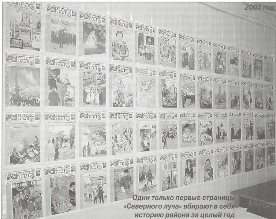
Одни только первые страницы «Северного луча» вбирают в себя историю района за целый год

Теперь о периоде нынешнем. В осмысленной пройденной народ понял, что Родину у него отняли, а взамен ничего не дали. Все забрали себе. Четыре десятка олигархов вла-