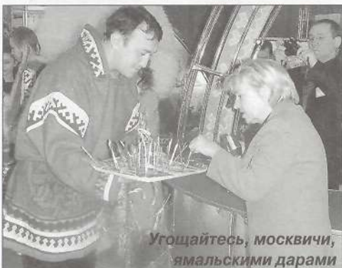
Угощайтесь, москвичи, ямальскими дарами