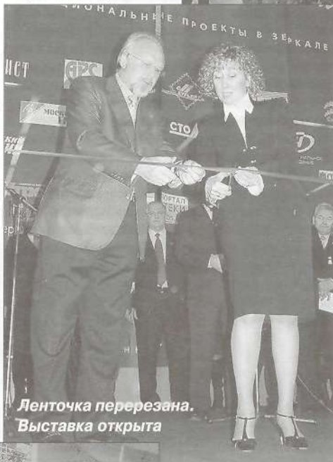
Ленточка перерезана. Выставка открыта

И вот, наконец, 22 ноября - начало работы выставки. Ямальский стенд, установкой и оформлением которого за день до того занимались не только профессиональные сборщики, но и сами журналисты, как всегда, смотрелся «на ура». В этом году в выставке приняло участие более сорока представителей средств массовой информации автономного округа. Посетителям выставки была предоставлена возможность узнать, как живет Ямал, чем дышит. Причем, можно было это сделать не только из представленной печатной продукции, но и посмотрев видеофильм, подготовленный коллегами-телевизионщиками. Вопросы москвичей «Ой, а вы с Ямала?», «Ой, это же так далеко?», «Ой, а как же там можно жить?» поначалу забавляли, но через пару дней начали раздражать. Чем-то это все напомнило сакраментальный вопрос: «Есть ли жизнь за МКАД?». Да, товарищи москвичи, есть, и не хуже, чем у вас!