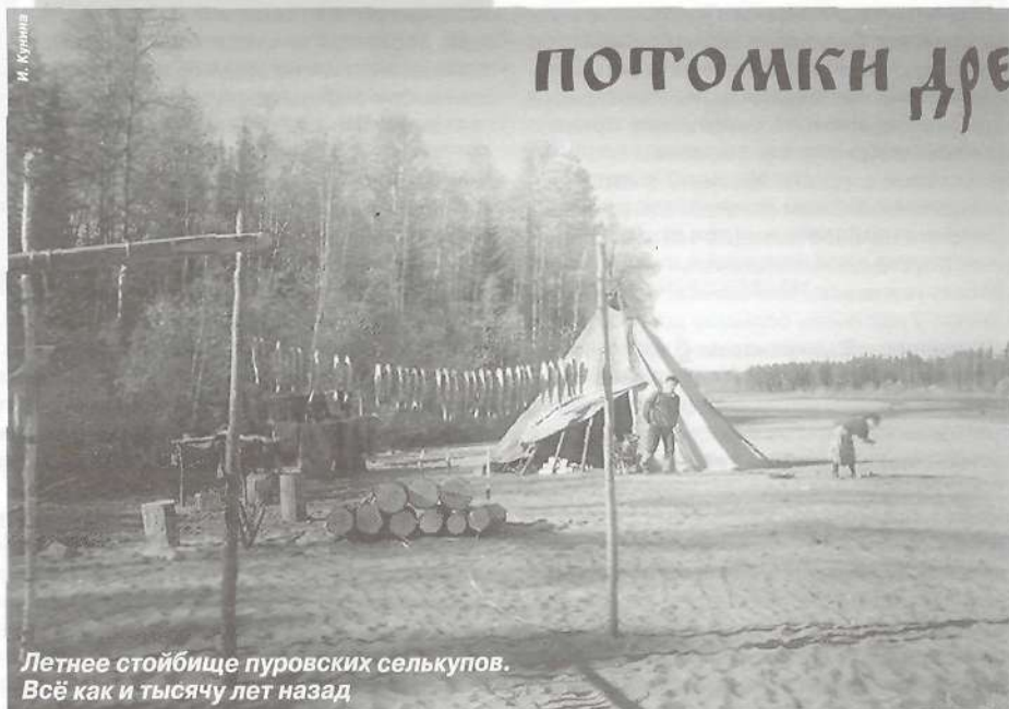
Летнее стойбище пуровских селькупов. Всё как и тысячу лет назад