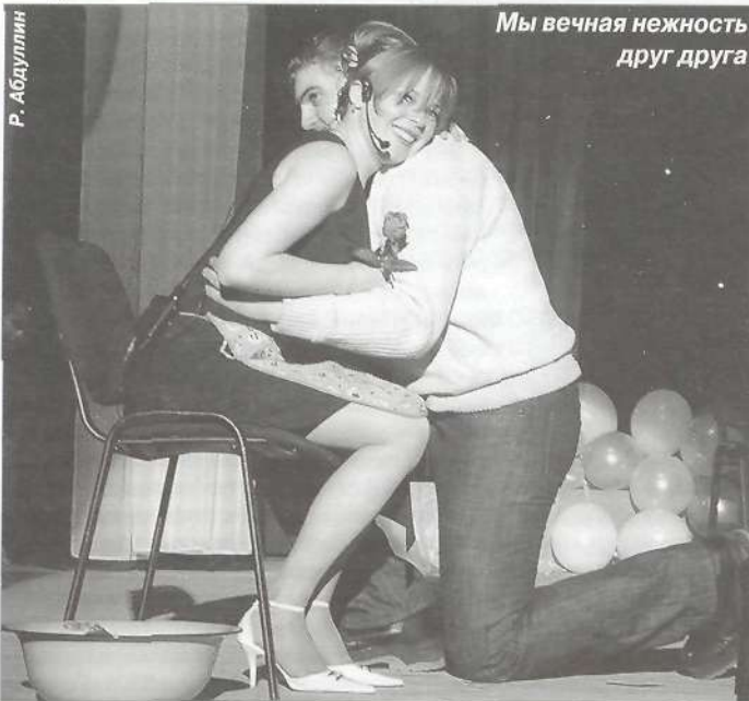
Мы вечная нежность друг друга