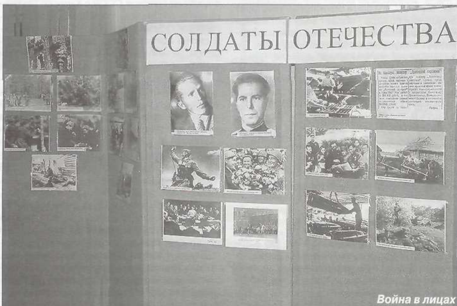
Война в лицах