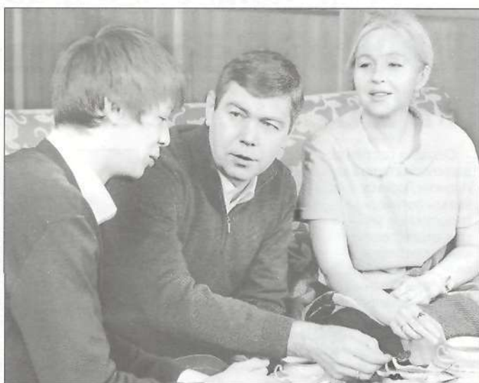
Вместе они преодолеют любые трудности!..