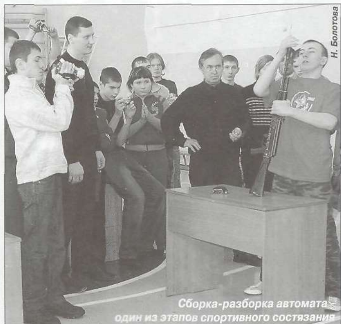
Сборка-разборка автомата один из этапов спортивного состязания