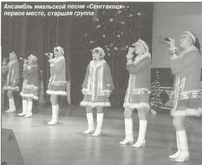
Ансамбль ямальской песни «Сенггакоця» - первое место, старшая группа