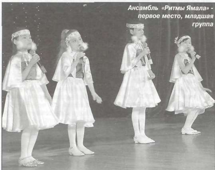
Ансамбль «Ритмы Ямала» - первое место, младшая группа