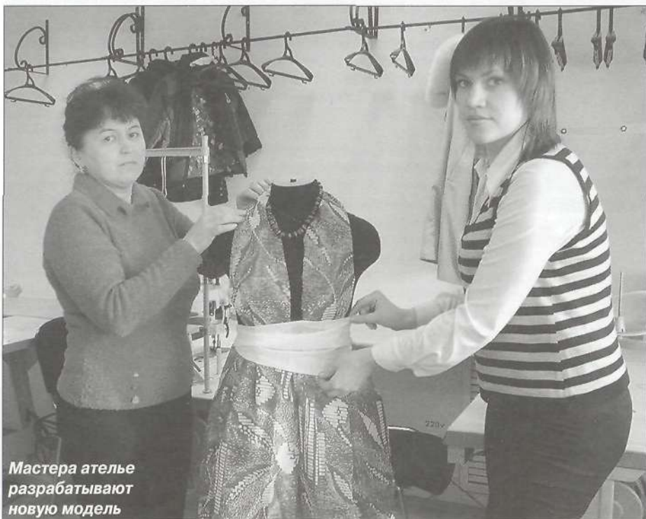
Мастера ателье разрабатывают новую модель