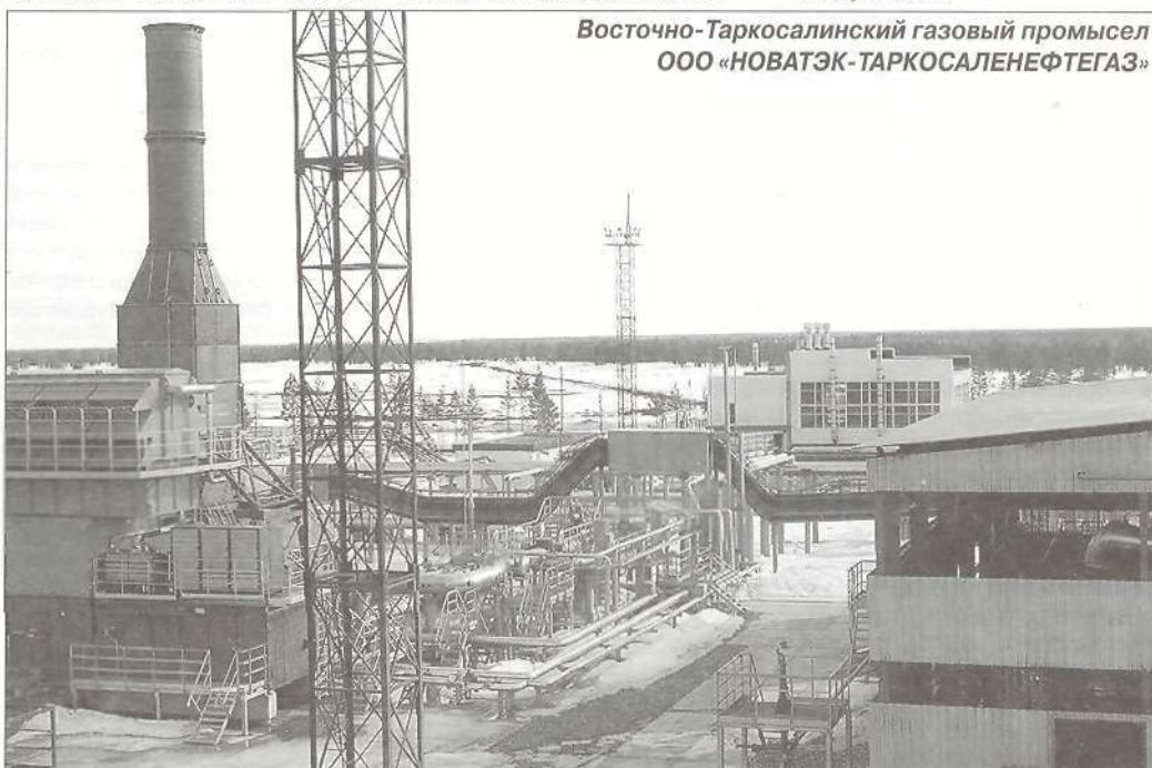
Восточно-Таркосалинский газовый промысел ООО «НОВАТЭК-ТАРКОСАЛЕНЕФТЕГАЗ»

Химико-аналитическая лаборатория была создана практически одновременно с запуском газового промысла, за это время ее коллектив вырос более чем в три раза. Средний возраст сотрудников - 30 лет. Несмотря на то, что все специалисты имеют специализированное высшее образование, не перестают учиться по сей день. Жизнь подвигает. Область аккредитации постоянно расширяется, требует новых знаний: здесь и экологический мониторинг, и охрана труда, и контроль качества выпускаемой продукции. Например, в прошлом году освоили новый метод - хроматографический анализ нестабильных жидких углеводородов, причем не только на газовую, но и на жидкую часть.