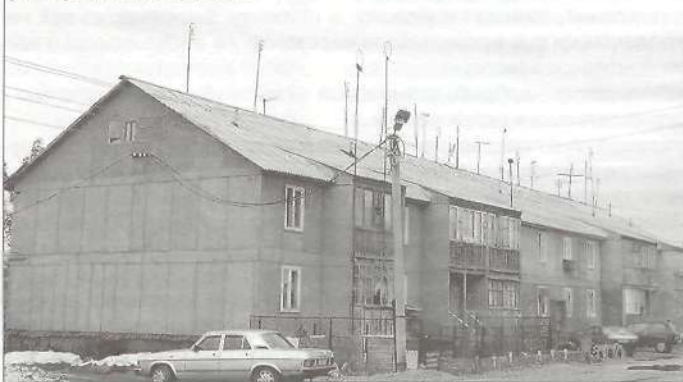
ул. Приполярная, д. 2