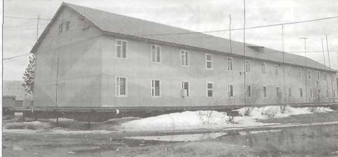
ул. Энтузиастов, д. 2