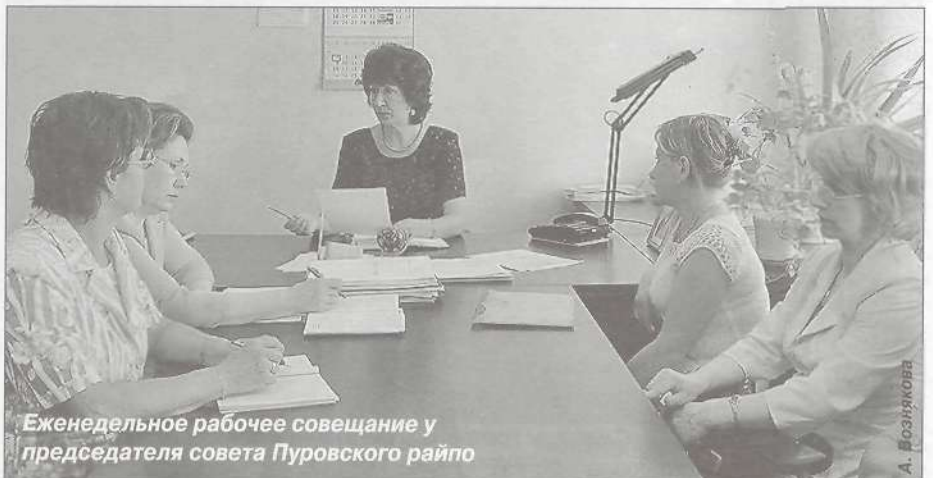
Еженедельное рабочее совещание у председателя совета Пуровского райпо