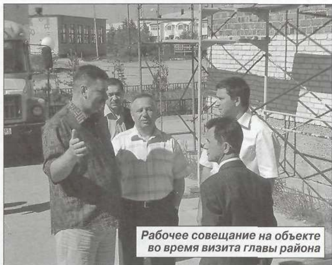
Рабочее совещание на объекте во время визита главы района

Работаем с досуговыми объектами. Неплохо осуществляет свою деятельность подростковый клуб «Юность». С работниками клуба налажены тесные связи, они присутствуют на планерках, и все проблемы, которые возникают на уровне нашего муниципального образования, решаются совместно и быстро. Кроме того, в поселении есть клуб ветеранов «Золотая осень». Буквально на днях в клубе состоится совещание, на которое будут приглашены председатель