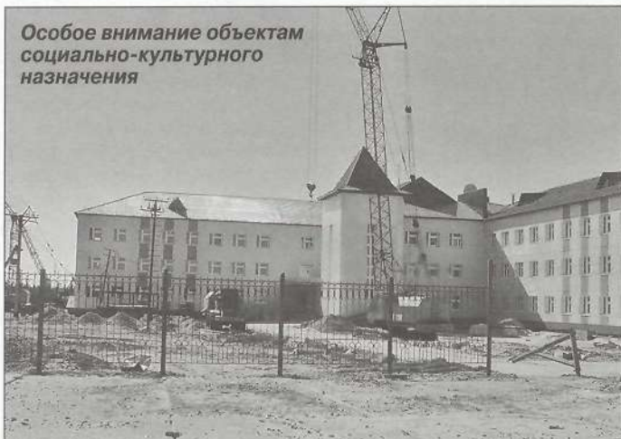
Особое внимание объектам социально-культурного назначения

Основной проблемой для нас, как и в прошлые годы, остается жилищная. Решаем мы ее несколькими путями. Первый - провели переговоры с Пуровским фондом жилья и ипотеки. Сейчас осуществляем все необходимые процедуры по отведению участка под строительство ипотечного дома в районе железно-