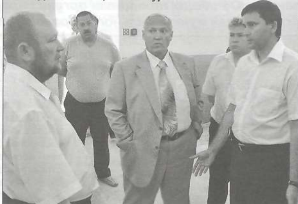
Выездное совещание в Пурпе

ления и планы по прокладке кольцевого водопровода и очистных сооружений.