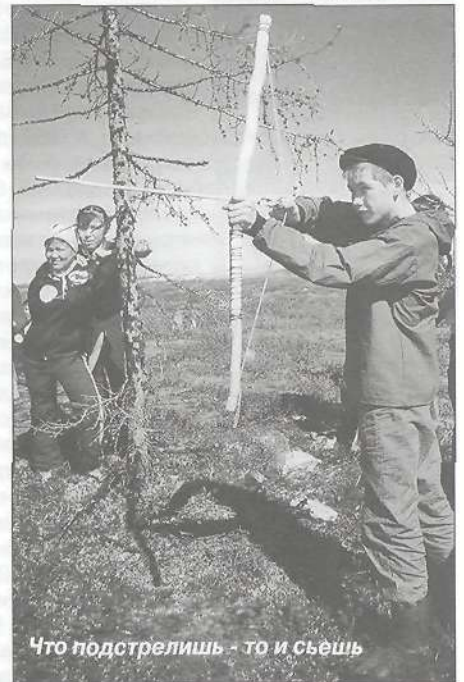
Что подстрелишь - то и съешь

После подведения итогов этапов соревнования жюри объявили команду «Барс» победителем первой туристской игры «Самбургский герой». Немного уступили пожарным и заняли второе место «Гринписовцы» школы-интерната. Третий результат по количеству набранных очков - у «Дикарей 21 века» - коллектива старшеклассников. На память об участии в игре представители