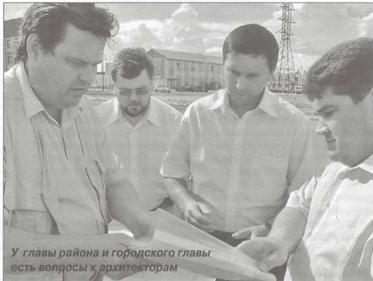
У главы района и городского главы есть вопросы к архитекторам

дач, поставленных перед городской властью. В этом году запланировано асфальтирование одиннадцати улиц. Новое дорожное покрытие появится на «злославной» улице Тарасова, где будет организовано двустороннее движение, проложен тротуар, установлен светофор. Реконструируют и улицу Губкина: выполняется ямочный ремонт, газонную часть дороги укроет «покрывало» из травы и цветов. Отдельного внимания в этом году удостоены улицы Юбилейная и Ленина, к прокладке тротуаров на которых уже приступили. Преобразится и улица 50 лет Ямалу – расширится дорожное полотно и появится новая пешеходная зона.