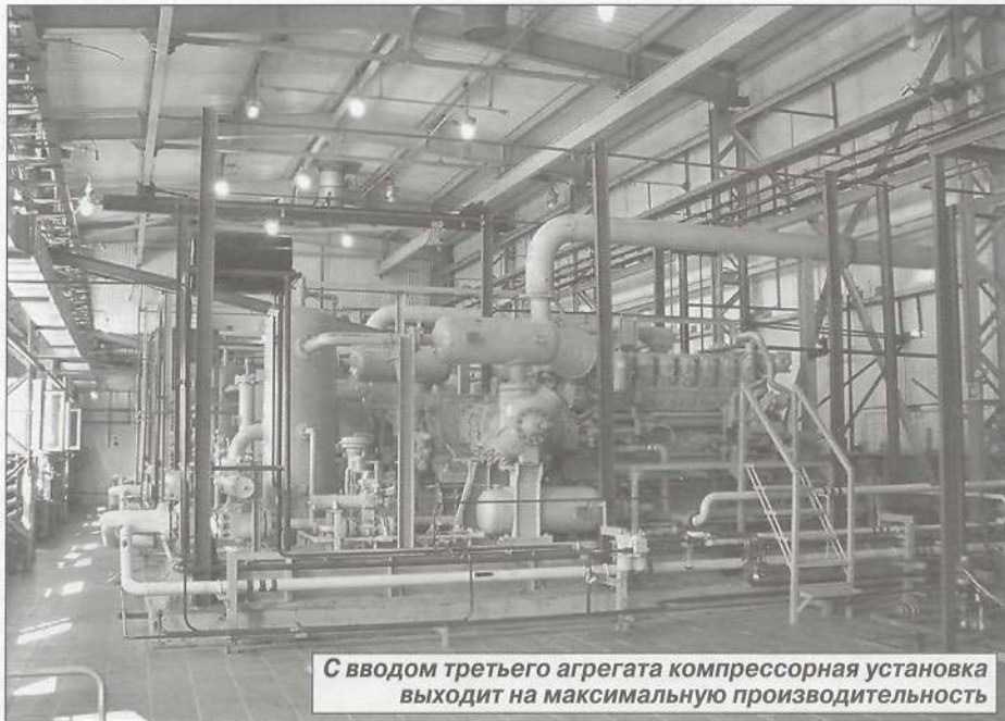
С вводом третьего агрегата компрессорная установка выходит на максимальную производительность

Нефтегазовые компании на сегодняшний день оценивают не только по уровню производства, но и по степени надежности в области экологии и промышленной безопасности. И можно сказать, что ввод в действие третьего компрессорного агрегата - это еще одна ступень по внедрению на производстве международных стандартов в области экологии.