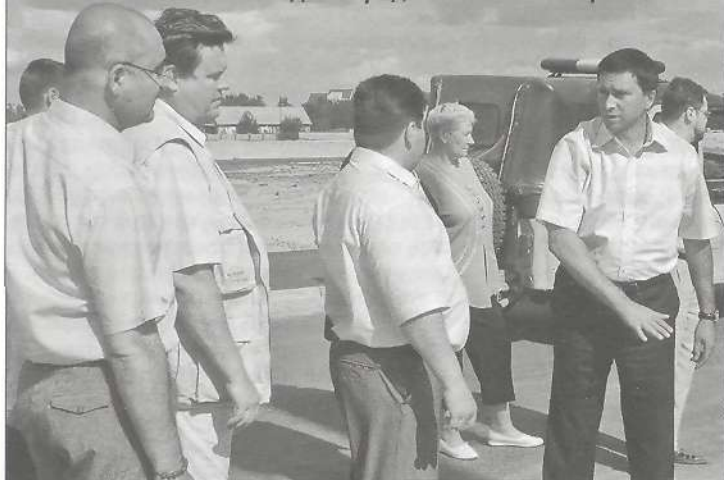
Дороги и благоустройство Тарко-Сале - вопрос номер один перед юбилейными торжествами