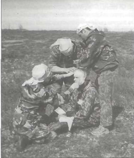
«Оказание» срочной медицинской помощи с наложением повязок