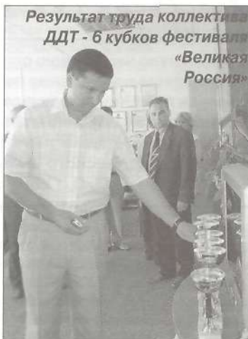
Результат труда коллектива ДДТ - 6 кубков фестиваля «Великая Россия»