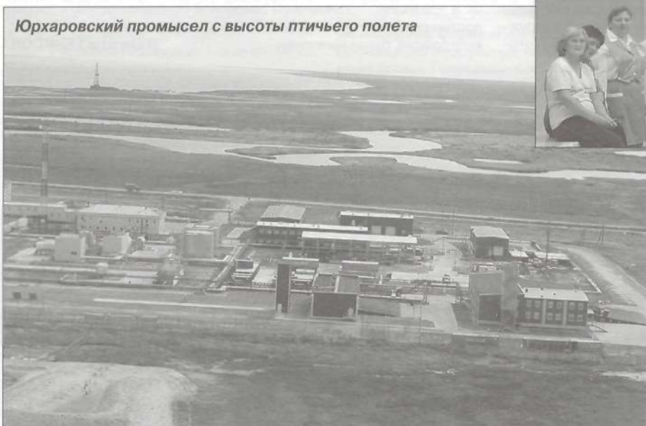
Юрхаровский промысел с высоты птичьего полета

пристыдила, сказав, что руководитель должен наоборот подбадривать, а не нюни распускать. Я поняла, что она права. С угрызениями совести легла спать, думая, что ни за что не смогу сомкнуть глаз на кровати, где панцирная сетка опускалась почти до пола, и тут же провалилась в сон.