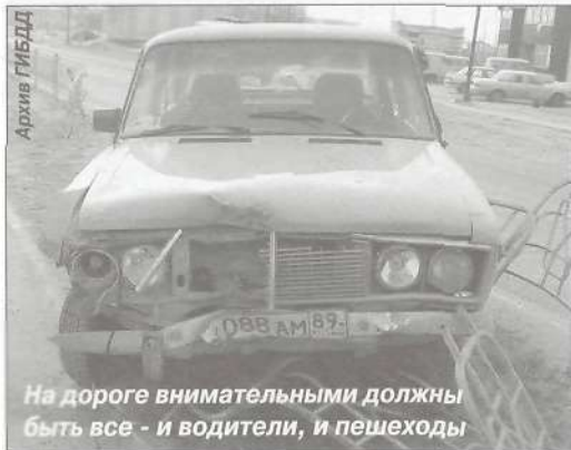
На дороге внимательными должны быть все - и водители, и пешеходы

За шесть месяцев 2007 года на территории МО Пуровский район зарегистрировано 31 дорожно-транспортное происшествие, что соответствует аналогичному периоду прошлого года.