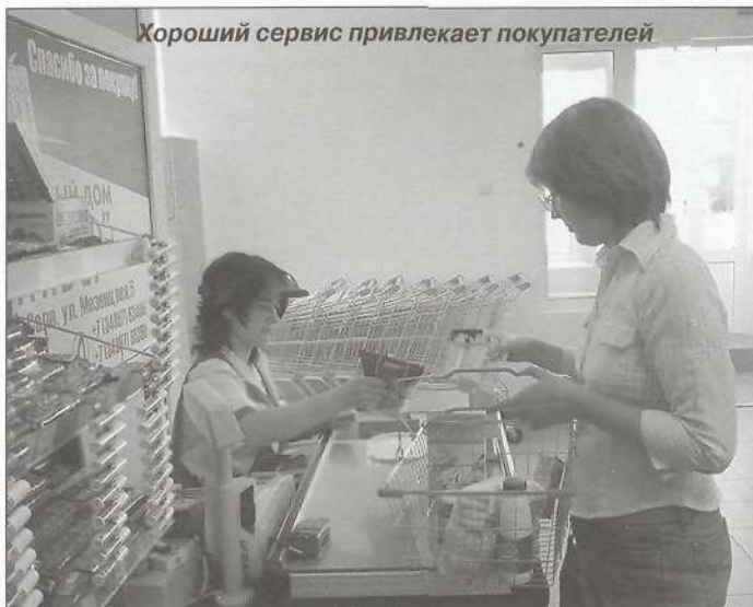
Хороший сервис привлекает покупателей