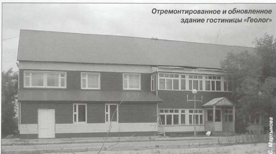
Отремонтированное и обновленное здание гостиницы «Геолог»