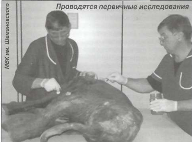
Проводятся первичные исследования