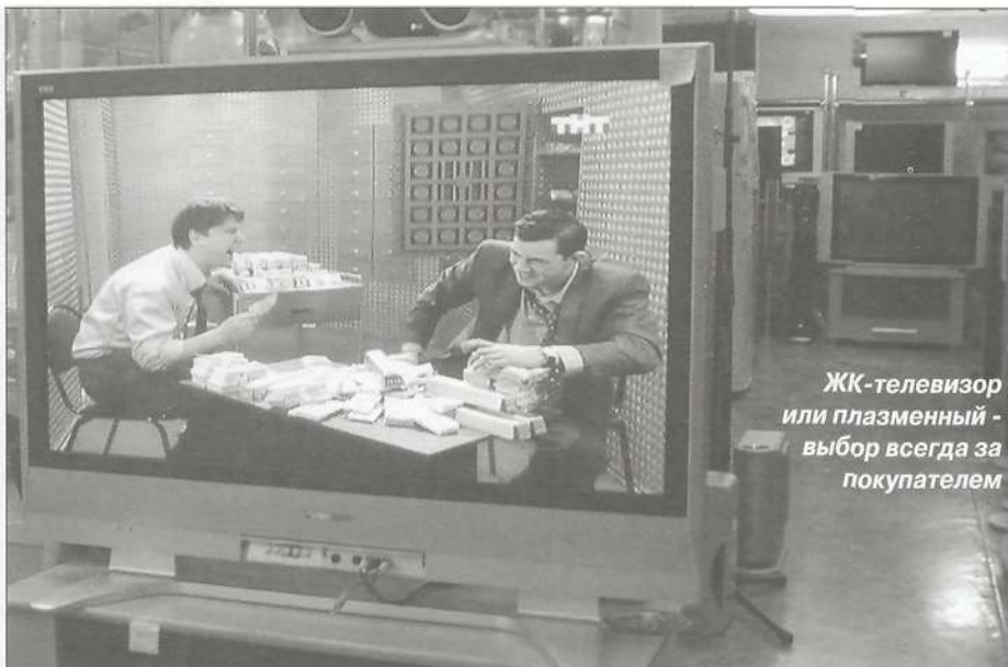
ЖК-телевизор или плазменный - выбор всегда за покупателем

- А теперь немного жизненной правды. Сейчас мы говорили о качестве картинки в идеальных условиях, что бывает крайне редко. В реальных жизненных ситуациях всё меняется местами. Дело в том, что при на-