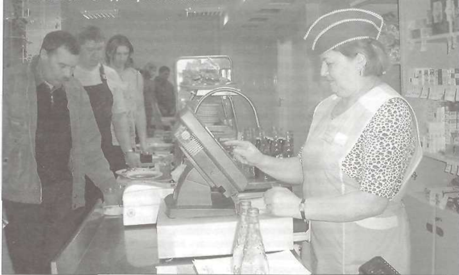
В столовой - обед по расписанию