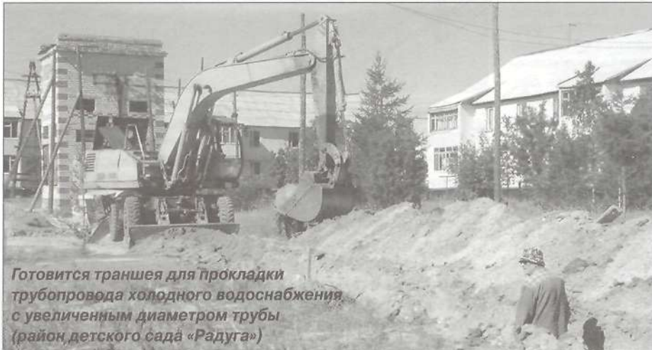
Готовится траншея для прокладки трубопровода холодного водоснабжения с увеличенным диаметром трубы (район детского сада «Радуга»)

лях. Раньше, независимо от того, насколько загружен котел, электродвигатель работал на полную мощность. Отныне эта зависимость будет соблюдаться четко: если котел загружен на 50 процентов, то и двигатель задействует в половину меньше от той энергии, на которую рассчитан.