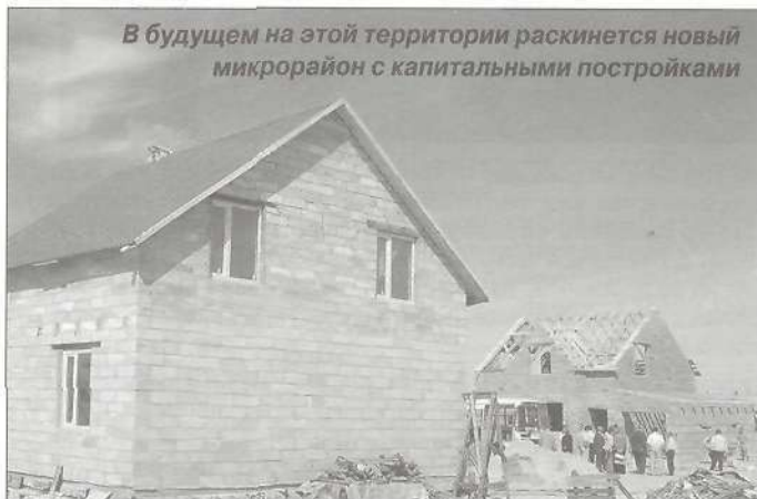
В будущем на этой территории раскинется новый микрорайон с капитальными постройками

Пресс-служба администрации Пуровского района, фото С. КАСЬЯНОВА