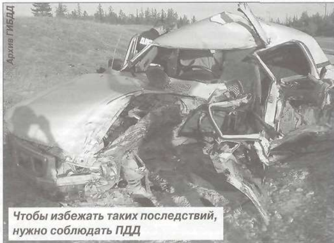
Чтобы избежать таких последствий, нужно соблюдать ПДД

Обращаться в кабинет №20 административного здания ОВД по МО Пуровский район: ул. Клубная, д. 2, телефоны: 6-39-34 или здание МОБ, кабинет № 15, телефоны: 6-50-86, 6-36-06.