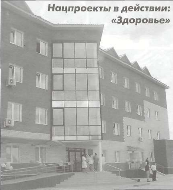
Новое здание поликлиники и Центра социальной помощи готово к приему посетителей

До организации врачебной амбулатории в 1996 году единственным лечебным учреждением в поселке Пурпе была местная амбулатория железнодорожной станции Пурпе.