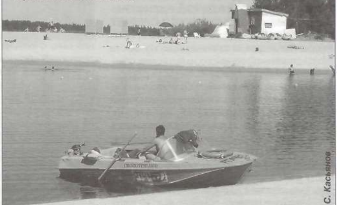
Жаркое лето 2007 года. Таркосалинский пляж