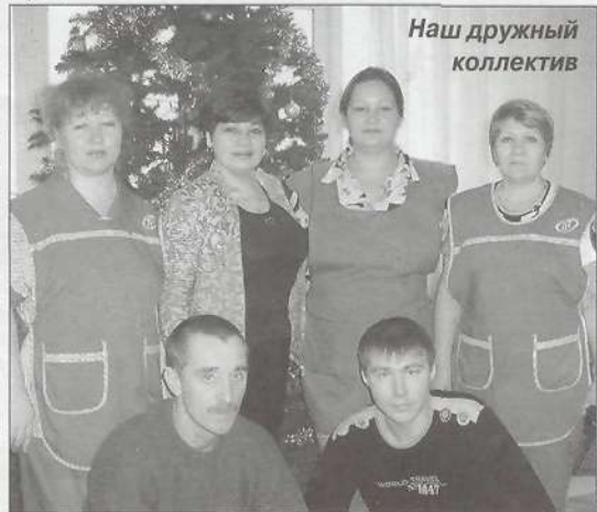
Наш дружный коллектив