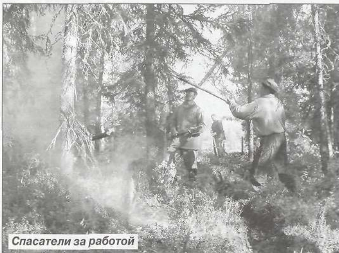
Спасатели за работой

Среди жителей района проводится противопожарная пропаганда, организуется регулярное обучение мерам пожарной безопасности. Однако далеко не все прислушиваются к нашим рекомендациям. С наступлением лета люди чаще выезжают на природу для отдыха, и, конечно же, не обходится без разжигания костра. Отдыхающие, не убедившись, что до конца потушили огонь, уезжают, а тот, вмиг покинув свой очаг, превращается из безобидной искры в мощную неуправляемую стихию. Оставленная разбитая бутылка,