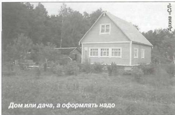
Дом или дача, а оформлять надо

Заключение органа местного самоуправления в случае, если садовый, дачное некоммерческое объединение не зарегистрировано в качестве юридического лица или земельный участок предоставлен для ведения садового или дачного хозяйства в индивидуальном порядке.