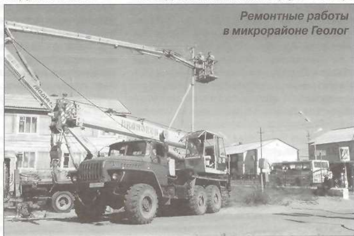
Ремонтные работы в микрорайоне Геолог

- На следующий год запланирована реконструкция линий на улице Юбилейной. И, думаю, включим сюда также улицу Совхозную - это в Тарко-Сале. В целом долгосрочный план по реконструкции подстанций и электролиний составлен на 10 лет,