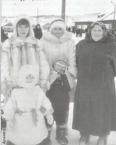
Со своими внуками на Дне оленевода в Самбурге, 2007 г.