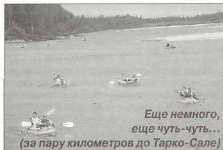
Еще немного, еще чуть-чуть... (за пару километров до Тарко-Сале)