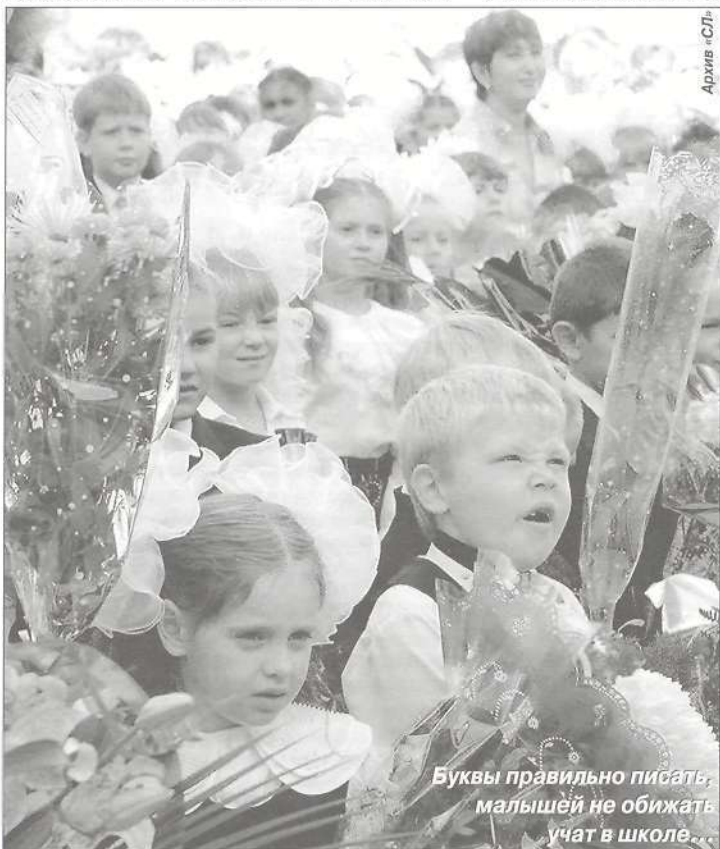
Буквы правильно писать, малышей не обижать учат в школе...

В рамках нацпроекта продолжается реализация программы «Информатизация системы образования». Сегодня доступ к глобальной сети Интернет имеют все школы. Вместе с тем по федеральной программе устанавливается новое оборудование, которое имеет более качественные характеристики, им обеспечены шесть школ - в г. Тарко-Сале и п. Пурпе. Причем трафик на этот год бесплатный. В ближайших планах бес-