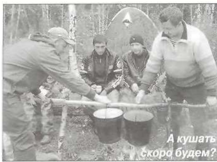
А кушать скоро будем?

нятную деталь в один и тот же неправильный паз. Тихонько материмся. В результате палатка, криво-косо, но собрана и вполне пригодна к эксплуатации. Хватаем миски. Подходим к костру в надежде покушать. Ужин не готов. Особо нетерпеливые вновь обложили костер шишками. Наконец, еда готова. К ведру протягиваются жадные руки с тарелками. Дежурный не успевает разливать, обжигает себе и остальным руки. На это внимания никто не обращает – болевые ощущения от усталости притупились. Кажется, ничего вкуснее грибного супа, приготовленного нашими «поварами», в жизни не ел. Никто не делится впечатлениями. По лесу на много километров разносится стук ложек о миски. Второе блюдо (слипшиеся макароны с тушенкой) менее вкусное и есть его совсем не хочется, но надо. Ужин благополучно (и крайне быстро) закончен, чай разлит, можно поговорить и о делах.