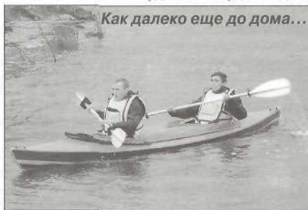
Как далеко еще до дома...

В один из моментов отдыха замечаю, что течение нас несет куда-то не туда. Подняв