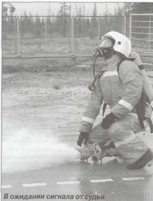
В ожидании сигнала от судьи

дыхания среде, используя специальные аппараты для защиты органов дыхания и зрения, отыскать пострадавших и успешно ликвидировать пожар в кратчайшие сроки. Сделать это, не войдя в помещение, невозможно. Из-за густого обволакивающего дыма трудно определить, куда именно подавать воду, то есть время будет потрачено впустую, тогда как в доме могут находиться живые люди, нуждающиеся в помощи, а пожар может быстро принять большие размеры. Газодымозащитники должны уметь ориентироваться в непредвиденных ситуациях, которые нередко возникают в реальности. Дом на дом у нас не похож, планировки разные, даже если взять стандартные для нашего округа двухэтажные дома пятой степени огнестойкости. Вроде строили их по одному типу, а жильцы то дверь перенесут, то ящики в коридорах поставят. Всё это еще больше усложняет и без того затрудненное продвижение в условиях плохой видимости во время пожара. С целью тренировки необходимых для ГДЗС навыков и умений мы и проводим эти соревнования.