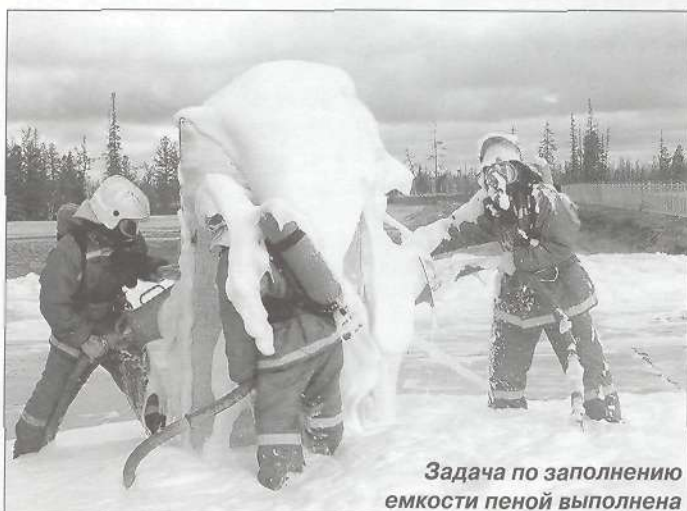
Задача по заполнению емкости пеной выполнена