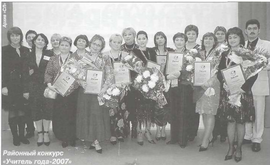
Районный конкурс «Учитель года-2007»

Сегодня школам необходима хорошая учебно-материальная база, позволяющая педагогам использовать самые современные технологии для передачи своих знаний детям. В этом году приобретены 2 кабинета информационных технологий и 8 интерактивных досок прямой проекции, 2 кабинета химии, оргтехника, учебники, обновилась мебель. Новое оборудование для учебных мастерских получит школа-интернат с. Самбург. Кабинеты психолога пополнятся аппаратами БОС. Дош-