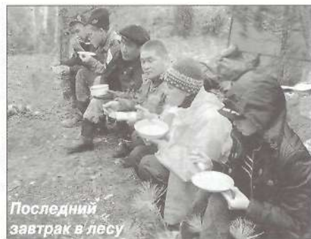
Последний завтрак в лесу

Если верить спасателям, за день мы прошли 54 километра. Недоумеваем, как это возможно, ведь планировали 40. Ну да ладно, завтра меньше плыть. По отработанной схеме разбиваем лагерь. В ведрах варится щучья уха и картошка с тушенкой. В костре жарятся неизменные шишки. Вокруг костра сушатся неизменные носки и перчатки. Идет дождь. Настроение от-