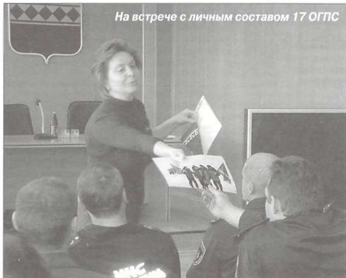
На встрече с личным составом 17 ОГПС

29 августа началась рабочая поездка депутата Государственной думы Российской Федерации от ЯНАО Натальи Комаровой по Пуровскому району. В первый день пребывания депутат посетила поселки Уренгой, Сывдарму и Пуровск.