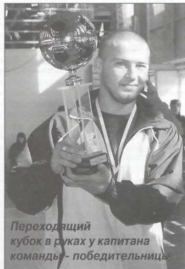
Переходящий кубок в руках у капитана команды - победительницы