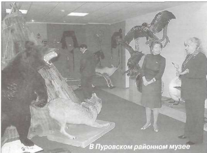
В Пуровском районном музее