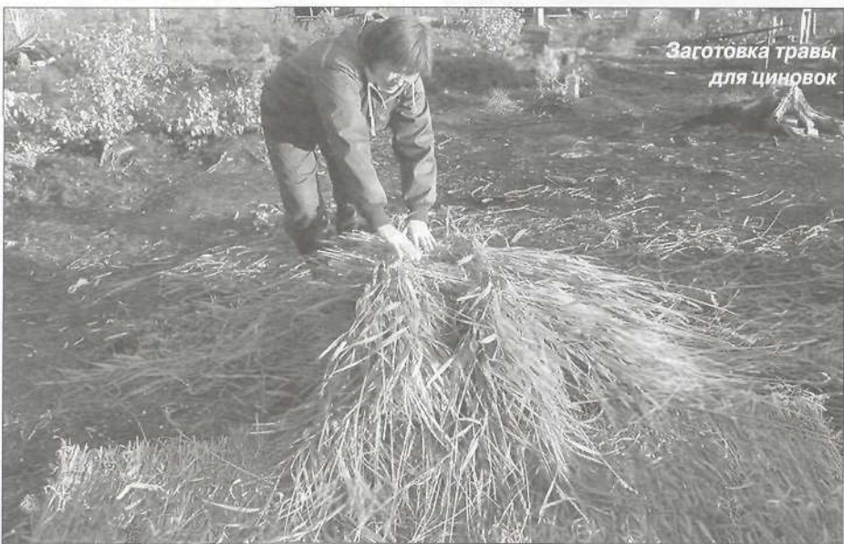
Заготовка травы для циновок

После Харампура каждый из нас поехал к своим родственникам: я - в стойбище Военто, а Полина Гилевна - на Медвежку.