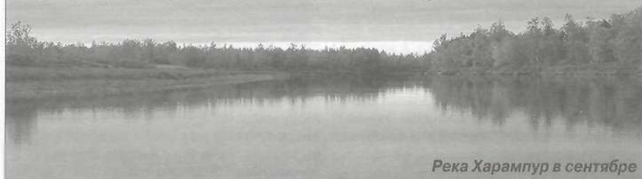
Река Харампур в сентябре

С 14 по 21 сентября Евгения Шотлевна Зернова и Полина Гилевна Турутина, методисты по ненецкой культуре районного Центра национальных культур совершили этнографическую поездку в деревню Харампур, на стойбища Военто и Медвежье. Цель поездки - сбор фольклора и заготовка циновок из трав для этнографического парка-стойбища районного Центра национальных культур. С погодой повезло: дни были теплые и сухие - отличное время для заготовки сена для циновок.