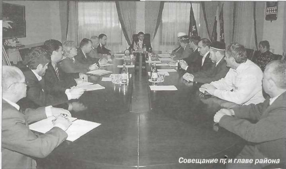
Совещание п. и главе района