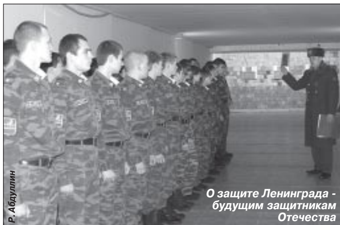
О защите Ленинграда - будущим защитникам Отечества

В преддверии празднования 65-й годовщины со дня снятия блокады Ленинграда состоялся ряд обучающих мероприятий, посвященных этой дате. В них приняли участие курсанты кадетских клас-