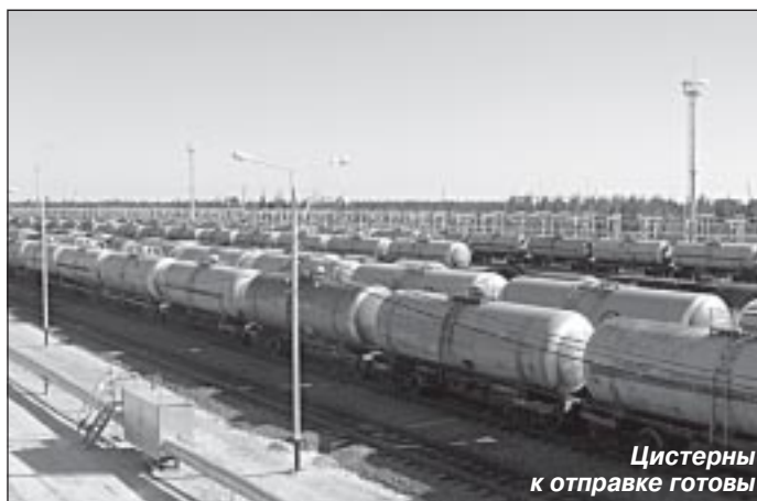
Цистерны к отправке готовы

В 80-х годах его жизнь изменилась кардинально. В 1982 году окончил Новополюцкий нефтяной техникум по специальности техник-механик оборудования нефтеперерабатывающих и химических заводов. А 1984 год ознаменован началом трудовой деятельности на Крайнем Севере, в тогда еще небольшом поселке Тарко-Сале. Начинать с помбура на буровой, так как считал, что быть в Тюмен-