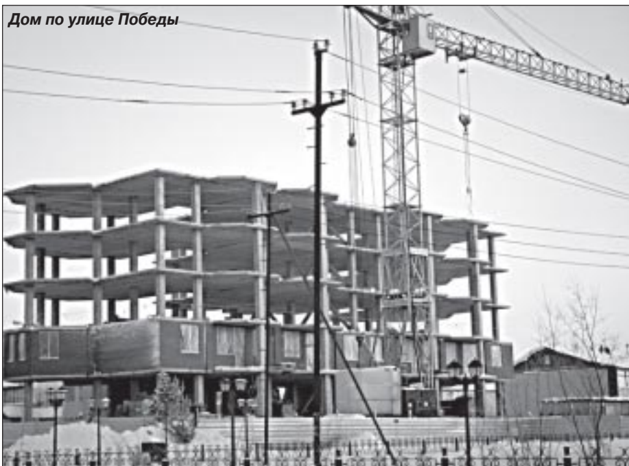
Дом по улице Победы

- Как Вы думаете, цена на жилье будет падать?