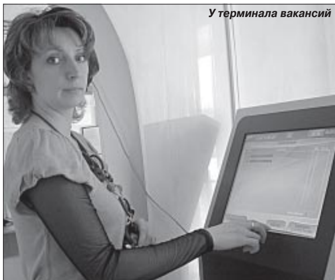
У терминала вакансий

- На сегодняшний день 17 предприятий подали сведения о сокращении штатной численности в период с 1 января 2009 года.