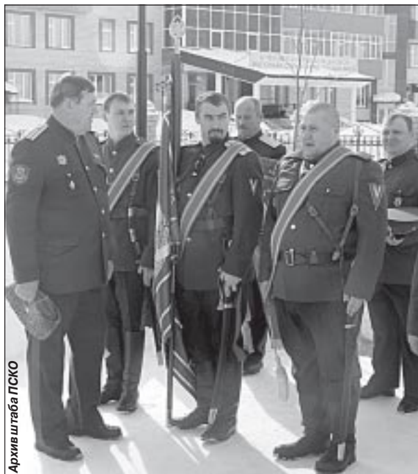
Архив штаба ПСКО

Составители: есаул Г. МЕРЗОСОВ, вахмистр П. КОЛЕСНИКОВ