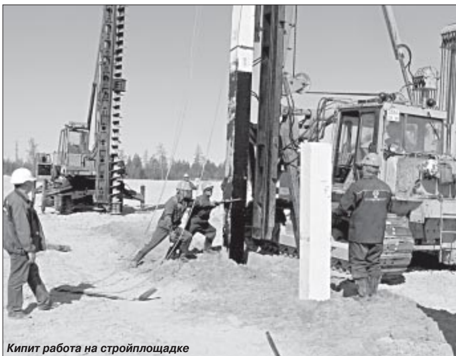
Кипит работа на стройплощадке

деть следующим образом. Попутный нефтяной газ будет подаваться для подготовки (осушки) от установки предварительного сброса воды (УПСВ) Комсомольского месторождения на ДКС. Кроме того, на ДКС будет осуществляться прием природного газа с газоконденсатной залежи Барсуковского месторождения. Уже осушенный газ пройдет в компрессорах этап компримирования (то есть сжатия и охлаждения) для снижения содержания в нем влаги и тяжелых углеводородов. Подготовленный таким образом товарный продукт поступит в магистральный газопровод транспортной системы