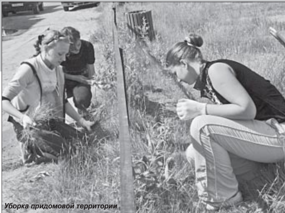
Уборка придомовой территории

В соответствии с выделенными денежными средствами «Пуровские электрические сети» выполняют работы по замене опор и проводов по улице Магистральной, заменят основание под подстанцией на улице Монтажников.