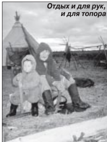
Отдых и для рук, и для топора

Нгамкэ пиркана сапвы пул пеля лаваранив. Тывка сангкомкад пул тыси пяду. Тывка-