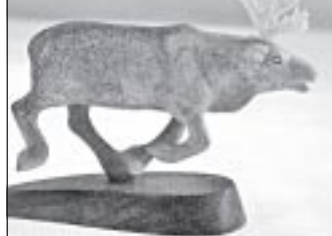
«Минурей» - из лосиного рога, 2009 г.

фессионального инструмента резчика. В последующие каникулы он работал в строительных организациях: участвовал в разборе сносимых зданий, собирал гаражные коробки, засыпал крыши керамзитом, охранял стройплощадку, строительные материалы и технику.