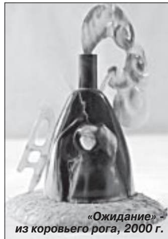
«Ожидание» - из коровьего рога, 2000 г.