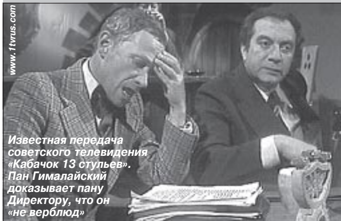
Известная передача советского телевидения «Кабачок 13 стульев». Пан Гималайский доказывает пану Директору, что он «не верблюд»