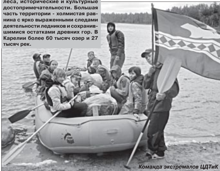
Команда экстремалов ЦДТиК

Карельская земля хранит множество тайн - от природных до рукотворных - наскальные рисунки, удивительные храмы, бурные реки для экстремалов. Воспитанники нашего районного Центра детского туризма и краеведения минувшим летом побывали в живописных труднодоступных местах Карельского края. Мы выбрали реку Чирко-Кемь, которая протекает в северо-восточной части Карелии (90 км от границы с Финляндией) и впадает в Белое море. Берега преимущественно скалистые, местами высота скалистых гряд достигает 100 метров. Маршрут наш начался с местечка Андронова гора. Получили инструктаж по технике безопасности, собрали и подготовили суда к сплаву, продукты уложили в гермоупаковки, распределились по экипажам, экипировались по всем правилам туристско-водников. Предстояло пройти участок маршрута в 111 км. Перепад воды составлял 44 метра, 25 порогов от 2 до 5 категории сложности.