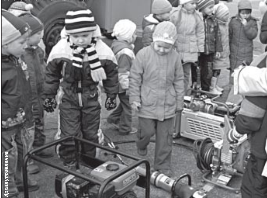
Знакомство юных пуровчан со спасательной техникой

- Всего за пожароопасный период 2009 года на территории Пуровского района было зафиксировано 128 лесных и тундровых пожаров. Основной причиной их возникновения стали сухие грозы. По количеству пожаров лето выдалось достаточно спокойным. Осложнила ситуацию экономия на авиатрулировании. Вместо этого проводился так называемый