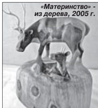
«Материнство» - из дерева, 2005 г.