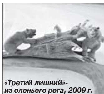
«Третий лишний» - из оленьего рога, 2009 г.

Денег на дорогу до Салехарда было в обрез, о билете на са-