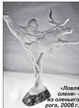
«Ловля оленя» - из оленьего рога, 2006 г.

В 1995 году после возвращения домой Сергей устроился в совхоз поваром зверокухни на ферме, где выращивали песцов. Теперь его режим дня полностью подчинялся режиму питания животных. Ранние подъемы, однообразные монотонные обязанности, отсутствие выходных – это всё, что осталось в памяти о том времени. Спустя год он уволился. Планировал поступить на художественное отделение. Но из-за несвоевременной