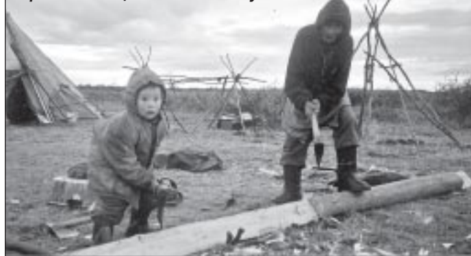
Топор в умелых руках - первый помощник по хозяйству

ярэ терсавэй тыси манрида хая. Ендад понд сэя. Хокосям нгарка и ханада.