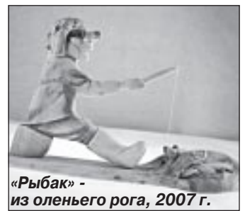
«Рыбак» - из оленьего рога, 2007 г.