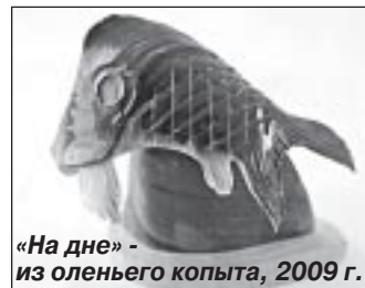
«На дне» - из оленьего копыта, 2009 г.