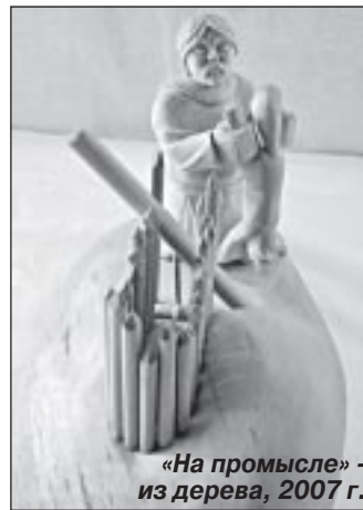
«На промысле» - из дерева, 2007 г.