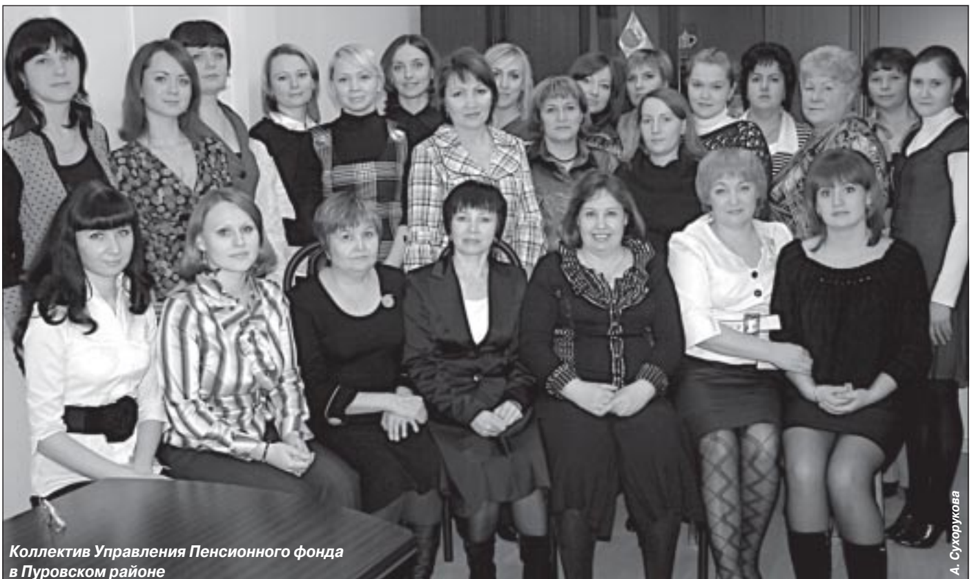
Коллектив Управления Пенсионного фонда в Пуровском районе

1 января 2010 года - Единый социальный налог заменен страховыми взносами в ПФР, Фонд социального страхования РФ и фонды обязательного медицинского страхования. При этом функция администрирования взносов в ПФР и ФОМС передана от налоговых органов. Сегодня ПФР представляет собой единую централизованную систему органов управления средствами обязательного пенсионного страхования, а также крупнейшую госструктуру, оказывающую услуги в области социального обеспечения населения.