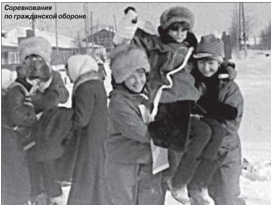
Соревнования по гражданской обороне

- Отслеживали каждого ученика, - вспоминает наша героиня, - а их в то время только на одном предприятии было около 200 человек. Приходилось вылетать на буровые, где словом, а где и делом поддерживать. Готовились вместе и к урокам, и к сдаче экзаменов.