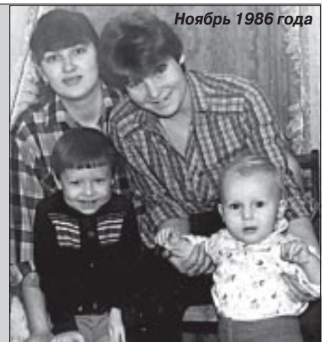
Ноябрь 1986 года