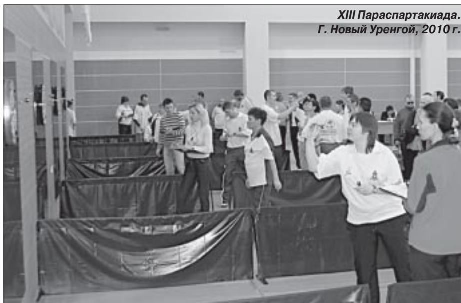
XIII Параспартакиада. Г. Новый Уренгой, 2010 г.

целях физического и интеллектуального развития способностей человека, совершенствования его двигательной активности и формирования здорового образа жизни, социальной адаптации путем физического воспитания, физической подготовки и физического развития. А Параспартакиада – это и лишняя возможность выйти за пределы своей квартиры, показать всем, что жизнь тебя не сломила, что ты не опустил руки, что борешься за свое здоровье, за право жить полноценной жизнью.