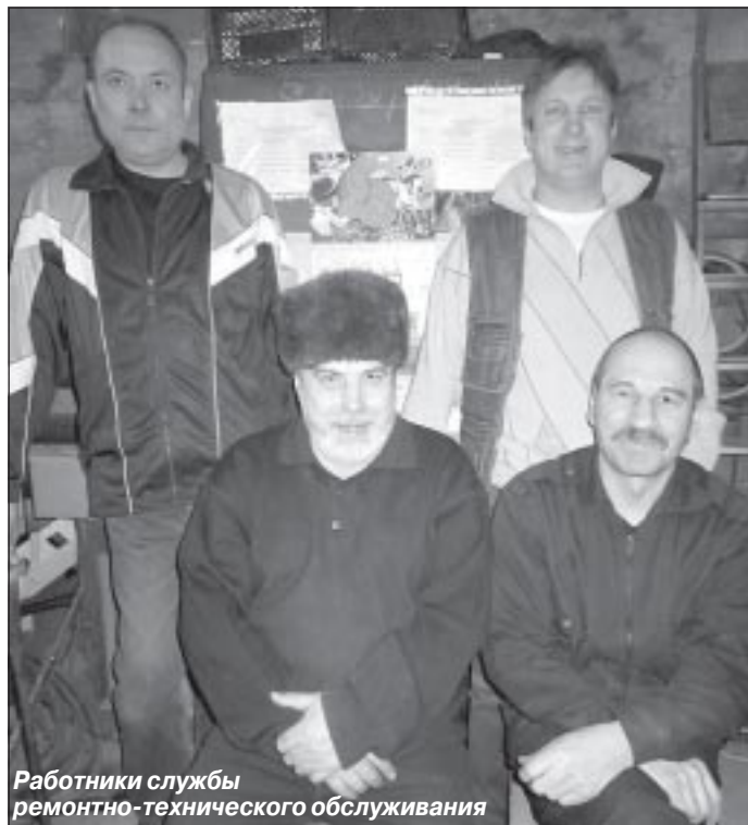
Работники службы ремонтно-технического обслуживания