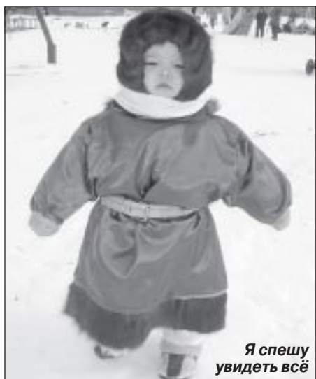
Я спешу увидеть всё

9 апреля население маленького села Самбург выросло без преувеличения раза в два. Улицы, центральная площадь и берег реки Пур были переполнены его жителями, съехавшимися со всей самбургской тундры кочевниками и многочисленными гостями, прибывавшими сюда и на вертолетах, и по зимнику. Сколько у устроителей было переживаний, что праздник сорвется из-за необычно ранней весны! Но погода не подвела. Она держалась буквально из последних «зимних» сил, давая возможность оленеводам показать себя и свои достижения. И только поздно вечером, когда все село ос-