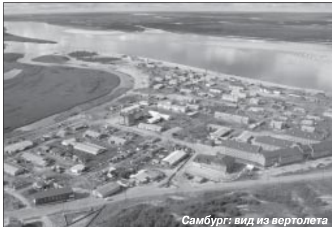
Самбург: вид из вертолета

- Всегда приятно говорить о достижениях, но неправильно было бы умолчать и о проблемах. Они есть и у Самбурга. Мы обеспокоены отсутствием чистой питьевой воды, несомненно, это негативно сказывается на здоровье односельчан. Пока отсутствует система централизованного газоснабжения. Не до конца отрегулирована транспортная схема сообщения между поселениями, что затрудняет