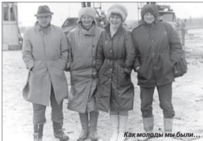
Как молоды мы были...

Я часто обращался в отдел труда Уренгойской экспедиции. На-