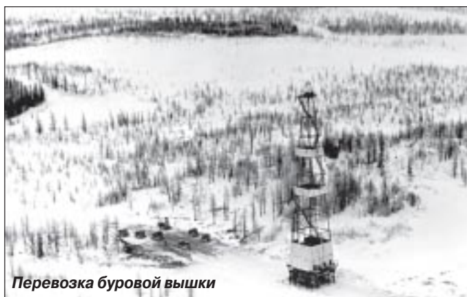
Перевозка буровой вышки