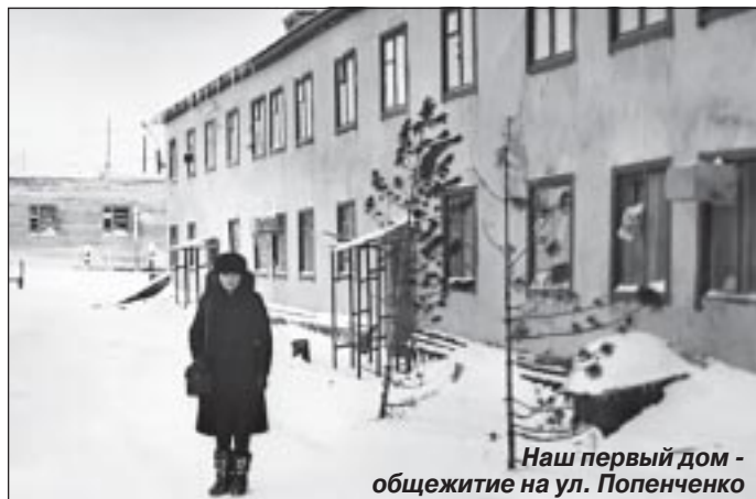
Наш первый дом - общежитие на ул. Попенченко