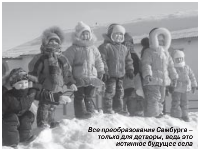
Все преобразования Самбурга – только для детворы, ведь это истинное будущее села