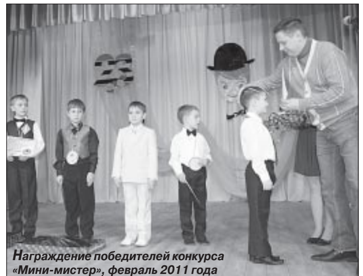
Награждение победителей конкурса «Мини-мистер», февраль 2011 года

После окончания школы, несмотря на возможность связать свою судьбу со спортивной карьерой, юноша захотел стать офицером. И поступил в Ульяновское высшее военно-техническое училище, готовившее снабженцев.