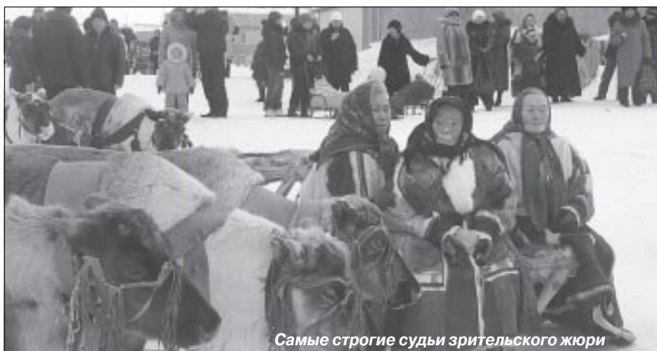
Самые строгие судьи зрительского жюри

День оленевода каждый год с большим нетерпением жду. Спешу на праздничную площадь с самого раннего утра. Рад видеть пастухов, их детей. Точно знаю, что без таких общих праздников нельзя. Они связывают