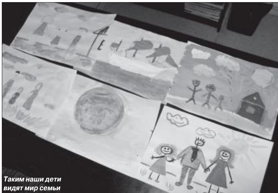
Таким наши дети видят мир семьи

Записла Светлана ИВАНОВА