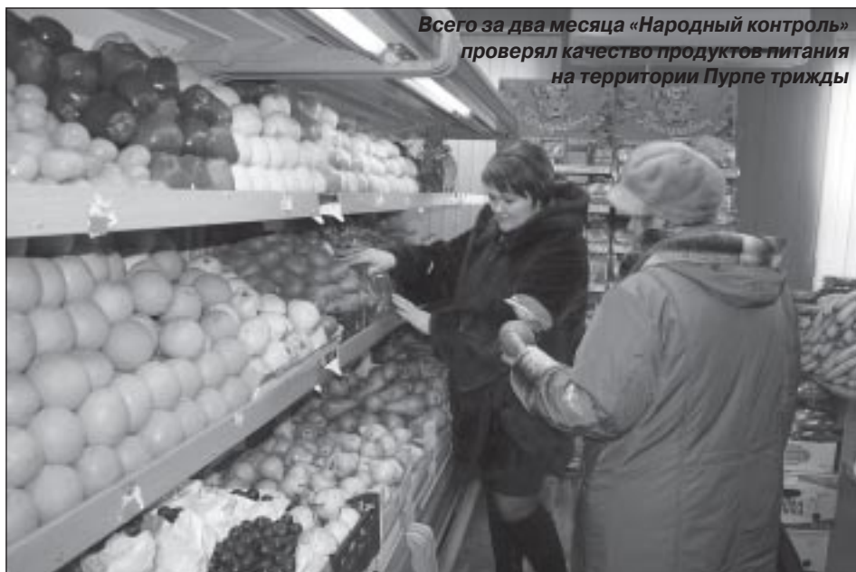
Всего за два месяца «Народный контроль» проверял качество продуктов питания на территории Пурпе трижды

Помимо устных и письменных претензий к предпринимателю, продавцу или другому ответственному лицу или обращения с исковым заявлением в конечную инстанцию – суд, есть и другие методы воздействия на тех, кто нарушает законные права покупателей. И один из них, тоже очень действенный, написать жалобу в территориальный отдел в г. Тарко-Сале управления Роспотребнадзора по