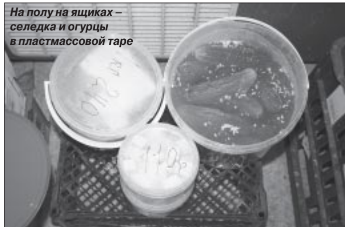
На полу на ящиках – селедка и огурцы в пластмассовой таре

Свою существенную лепту в наведение порядка на прилавках пурпейских продуктовых магазинов в настоящее время вносит и активная деятельность рабочей группы «Народного контроля», которая была создана в начале этого года на территории поселка Пурпе при первичных отделениях Пуровского местного отделения Всероссийской партии «ЕДИНАЯ РОССИЯ».