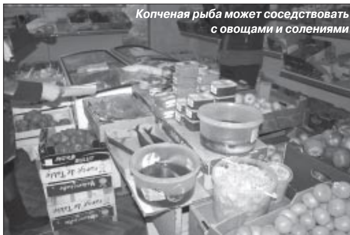
Копченая рыба может соседствовать с овощами и соленьями