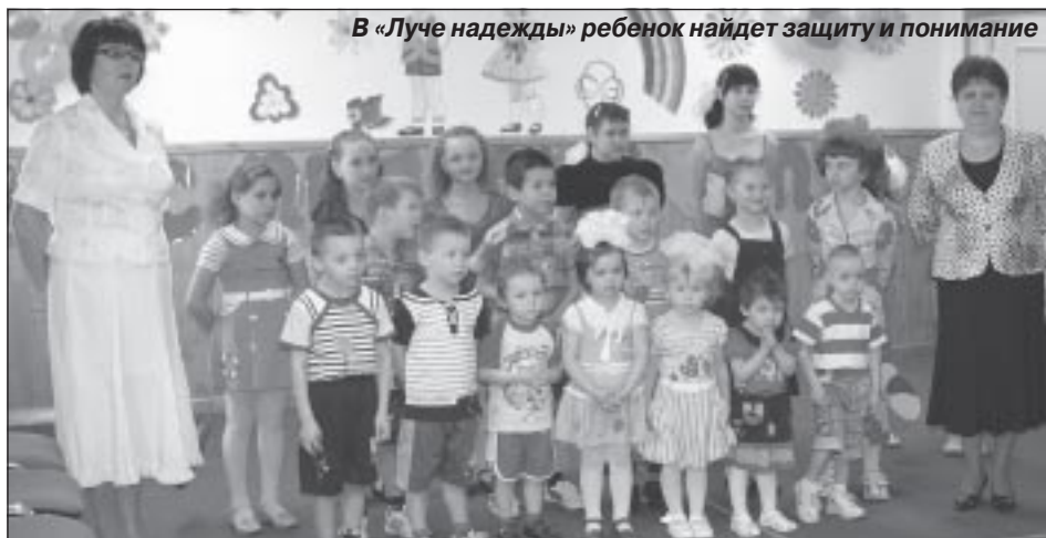
В «Луче надежды» ребенок найдет защиту и понимание

О. МИТЯНИНА, зам. директора по социальной и реабилитационной работе МУ «Социальный приют для детей и подростков «Луч надежды»