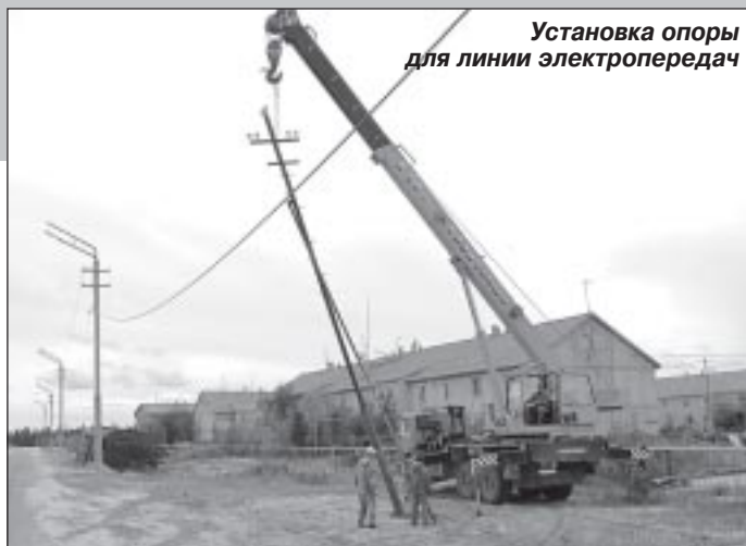
Установка опоры для линии электропередач

На подготовку к зиме из окружного и местного бюджетов в этом году было выделено три миллиона рублей. Они были освоены полностью, в результате чего произведена реконструкция электросетей в третьем микрорайоне, у домов № 13, 14 и 15. Здесь кабель был заменён на