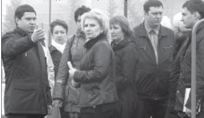
Участники выездного совещания за работой

тратить деньги на приобретение и содержание новой спецтехники (она тоже когда-то станет старой), а заключить договоры на обслуживание с транспортными предприятиями, у которых эта техника простаивает, а таковые в районе есть, и даже неподалеку от Пуровска.