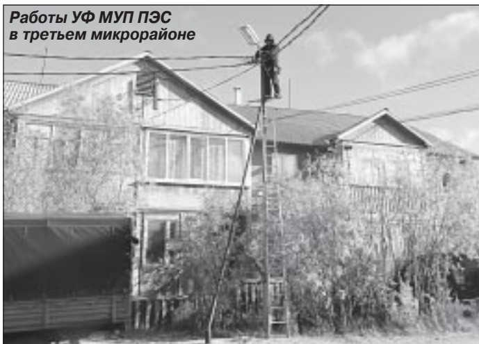
Работы УФ МУП ПЭС в третьем микрорайоне

Реконструкция системы электроснабжения поселка Уренгоя на сегодняшний день выполнена на 60 процентов. Оставшиеся 40 процентов - это голые провода и деревянные опоры, оставшиеся нам в наследство ещё с доперестроечных времён и отслужившие свой срок. Есть линии электропередач, находящиеся в плачевном состоянии. Требуется замены и электрооборудование, хотелось бы его поменять на новое и современное. К примеру, как подстанция нового образца в шестом проектом микрорайоне, которая привезена и установлена сразу в собранном виде. Но такой комплексный подход, конечно, очень отдалённый перспектива. И всё же в этом году очень много сделано. В общей сложности заменено более 60 опор, реконструировано более двух километров электросетей. При этом собственные средства