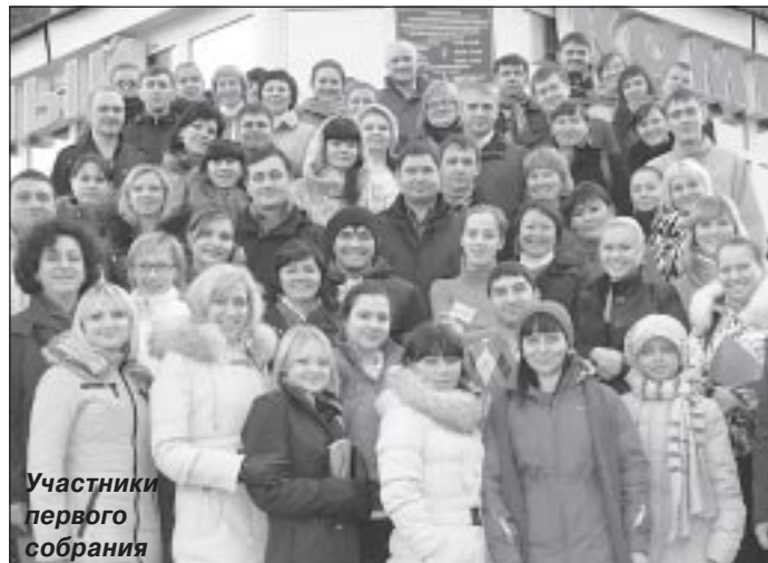
Участники первого собрания

По словам организаторов «Ключа к успеху» (МУ «Управление молодёжной политики и туризма Пуровского района»), первое собрание актива пуровской молодёжи прошло успешно. Итогом двух рабочих дней стало создание центра молодёжных инициатив, принятие