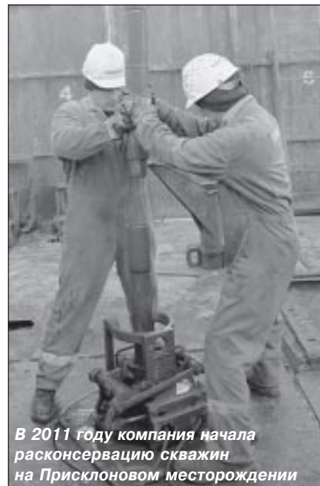
В 2011 году компания начала расконсервацию скважин на Присклоновом месторождении

Сегодня компания разрабатывает четыре месторождения Усть-Пурпейского лицензионного участка: нефтегазоконденсатное Присклоновое, нефтяные Губкинское, Центрально-Пурпейское и Крещенское. За