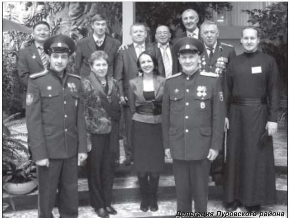
Делегация Луровского района

Важно, чтобы все, что мы с вами задумали, реализовала опытная ответственная команда. Сегодня в зале у нас присутствуют кандидаты в депутаты, действующие депутаты - вы их хорошо знаете. Я считаю, что мы абсолютно правильно поступаем,