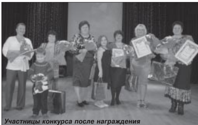
Участницы конкурса после награждения