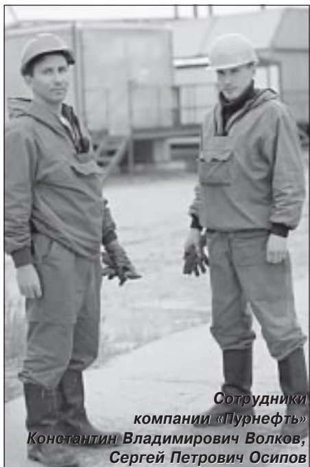
Сотрудники компании «Пурнефть»