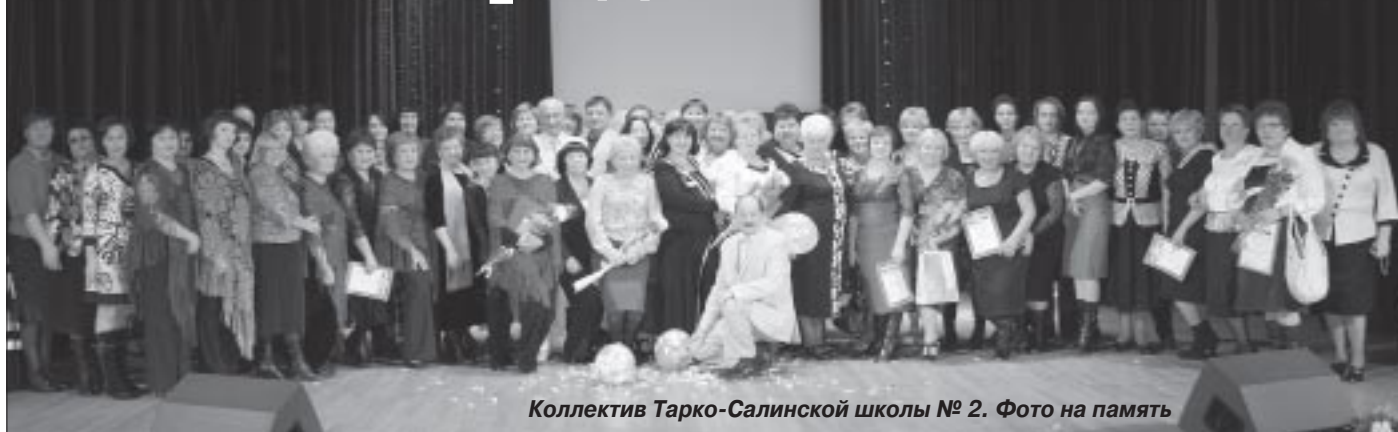
Коллектив Тарко-Салинской школы № 2. Фото на память

19 ноября Тарко-Салинская средняя школа № 2 отметила своё 25-летие. Зал КСК «Геолог» был переполнен: коллектив школы пришли поздравить представители районной и городской администраций, профсоюза работников образования, выпускники прошлых лет, родители сегодняшних учеников, да и сами дети.