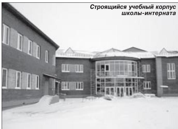
Строящийся учебный корпус школы-интерната

ческая станция и фельдшерско-акушерский пункт, который в этом году переехал в новое специализированное здание.