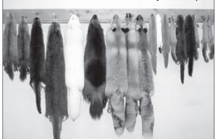
Халясовинская тайга богата пушным зверем

Также в Халясавэе есть следующие учреждения и организации: Дом культуры, отделение почтовой связи, пожарная часть, территориальный пункт МВД, филиал банка, гидрометеорологи-