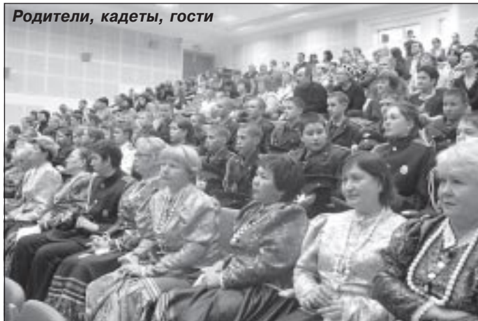
Родители, кадеты, гости