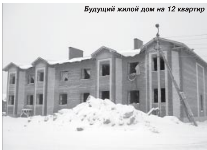
Будущий жилой дом на 12 квартир

По статье расходов на благоустройство села Халясавэй из окружного и районного бюджетов, а также местных средств выделено в текущем году более 2 миллионов 800 тысяч рублей.