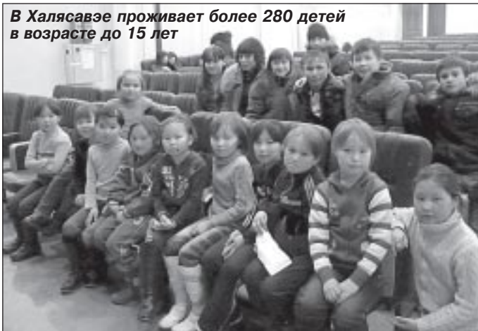
В Халясавэе проживает более 280 детей в возрасте до 15 лет

девчонки, для которых по программе «Стратегия-2020» будет построен в 2013 году детский сад на семьдесят мест.