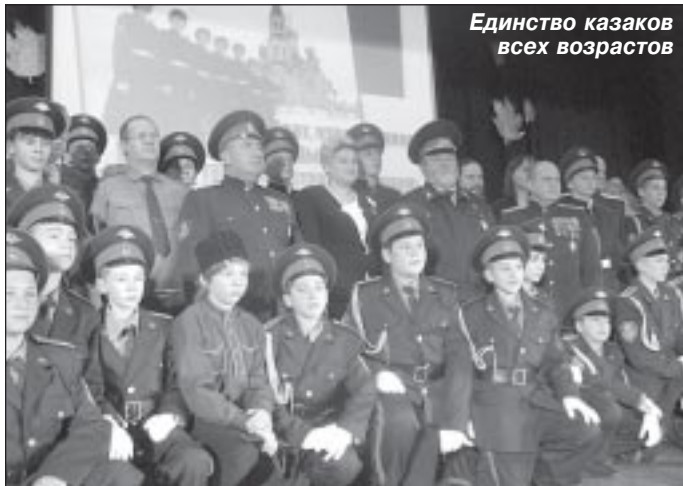
Единство казаков всех возрастов

Эта строка из песни наиболее полно отражает суть праздничного мероприятия, прошедшего 17 ноября 2011 года в Тарко-Салинской средней школе № 3 – презентации двух казачьих классов – 7 и 11 – «Возрождение» и «Светоч».