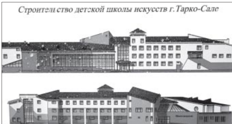
Строительство детской школы искусств г. Тарко-Сале

Не меньше летом было сделано по плану ремонта жилья. В этом году на капитальный ремонт жилого фонда выделено в пять раз больше денежных средств, нежели в прошлом. Благодаря им в адресную программу капремонта включено 26 многоквартирных домов. Таких объемов, как вы понимаете, не было никогда. Отдельно выделены средства на ремонт квартир вете-