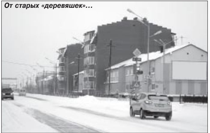
От старых «деревяшек»...