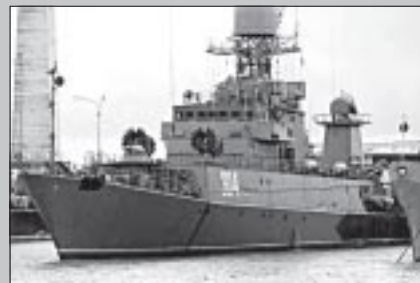
МПК-192 «Уренгой» – малый противолодочный корабль.

Смотрел на будущих моряков, уходящих этим субботним вечером в армию, и думал: а ведь пройдет совсем немного времени и память этих ребят пополнится еще одним незабываемым впечатлением –