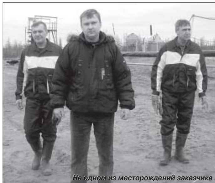
На одном из месторождений заказчика

на тендер с одними расчётами, а за это время цена на дизтопливо выросла на 10 процентов.