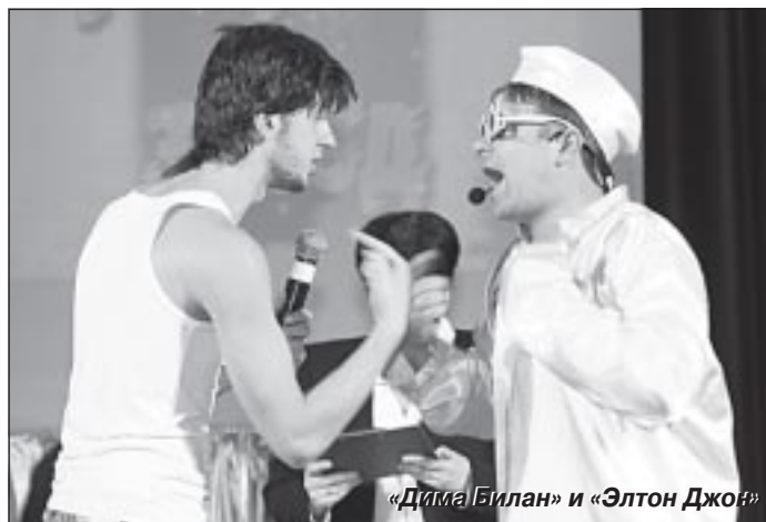
«Дима Билан» и «Элтон Джон»