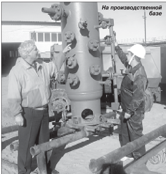
На производственной базе

К сожалению, не все предприятия своевременно платят за выполненные нашей экспедицией объёмы работ, это не лучшим образом сказывается на производственной ситуации. В результате на закупку необходимого оборудования приходится брать кредиты в банке и выплачивать проценты. К тому же, пока проходят тендеры, цены на необходимые составляющие для обеспечения производственного процесса растут. К примеру, недавно подали заявку