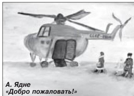
А. Ядне «Добро пожаловать!»

Во мне проснулось любопытство: что стало причиной такого светлого утра, какая погода на улице? Подбежал к окну, сквозь морозный узор на стекле увидел, что все деревья и кусты на улице покрыты пушистым снегом.