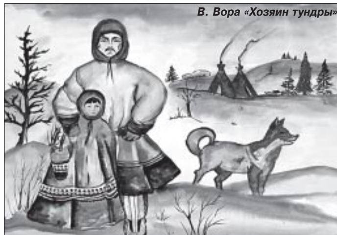
В. Вора «Хозяин тундры»

У каждого из детей свой способ выразить трепетное отношение к малой родине. Они создают рисунки, сти-