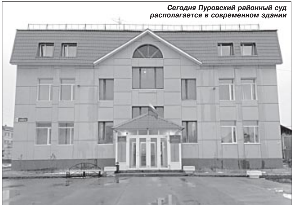
Сегодня Пуровский районный суд располагается в современном здании