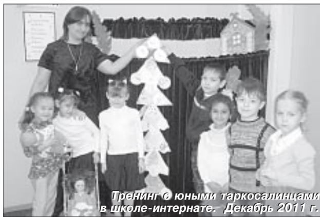
Тренинг с юными таркосалинцами в школе-интернате. Декабрь 2011 г.

Но в последние годы простого желания стать приёмными родителями или опе-