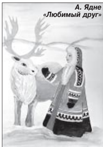
А. Ядне «Любимый друг»