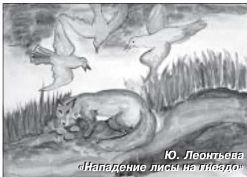
Ю. Леонтьева «Нападение лисы на гнездо»