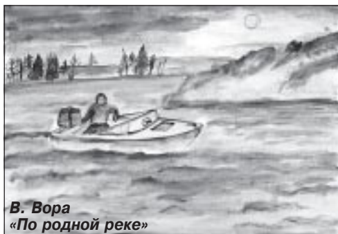
В. Вора «По родной реке»

тучи комаров, а смело с корзиной в руке идет в лес за грибами и ягодами. Весь день грибников и ягодников радует пение птиц. Этот многоголосый лесной хор - автор и исполнитель самой прекрасной музыки.