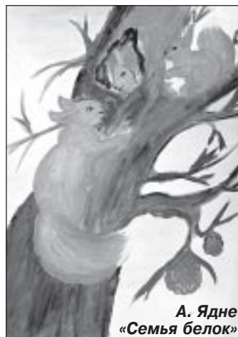
А. Ядне «Семья белок»

Лето на Ямале короткое, но теплые дни в этот период не редкость. Бывалый человек никогда не обращает внимание на