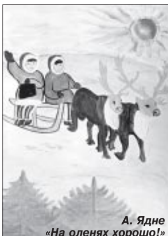
А. Ядне «На оленях хорошо!»

Я подозреваю, что многие считают, что мой любимый полуостров Ямал на карте совсем