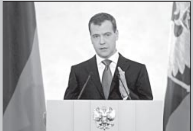
политической и социально-экономической жизни России, мы представляем вниманию читателей.

Каких изменений и в каких сферах ждать россиянам в 2012 году? Ключевые выдержки из Послания, определяющие предстоящую трансформацию