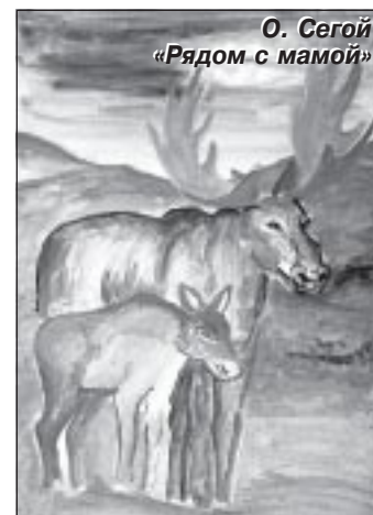
О. Серой «Рядом с мамой»

Весной тундра просыпается от долгого зимнего сна. Понемногу сходит снег, из-под него