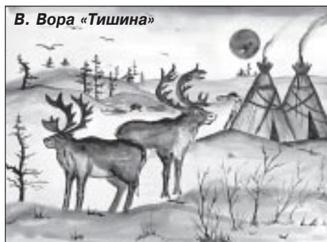
В. Вора «Тишина»

Ненцы - гостеприимные люди. Когда бы вы ни приехали к нам в тундру - ночью или днем - вас встретят доброй улыбкой