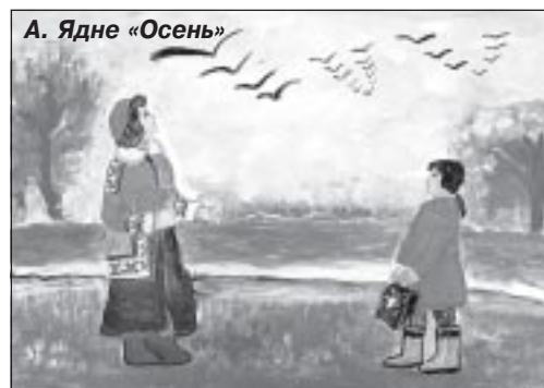
А. Ядне «Осень»